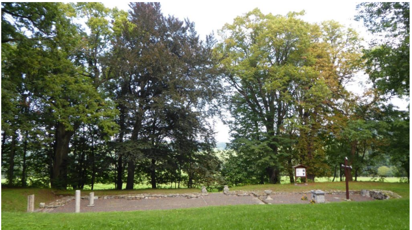
Kraftort Kirchenfundamente Rothenbaum heute