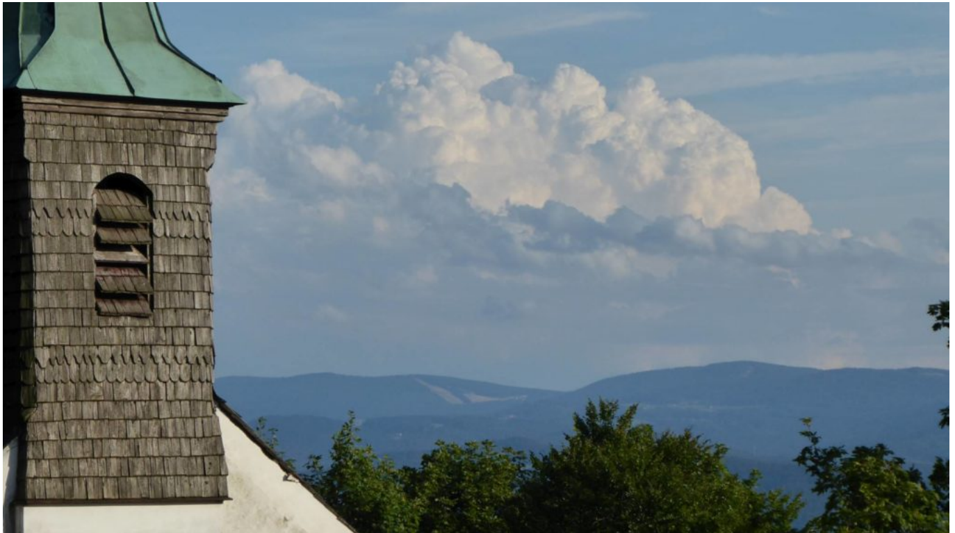
Vom Gipfel des Haidstein Blick auf den Wolfgangsweg mit Predigtstuhl, Pröller und Münchshöfen bei St. Englmar