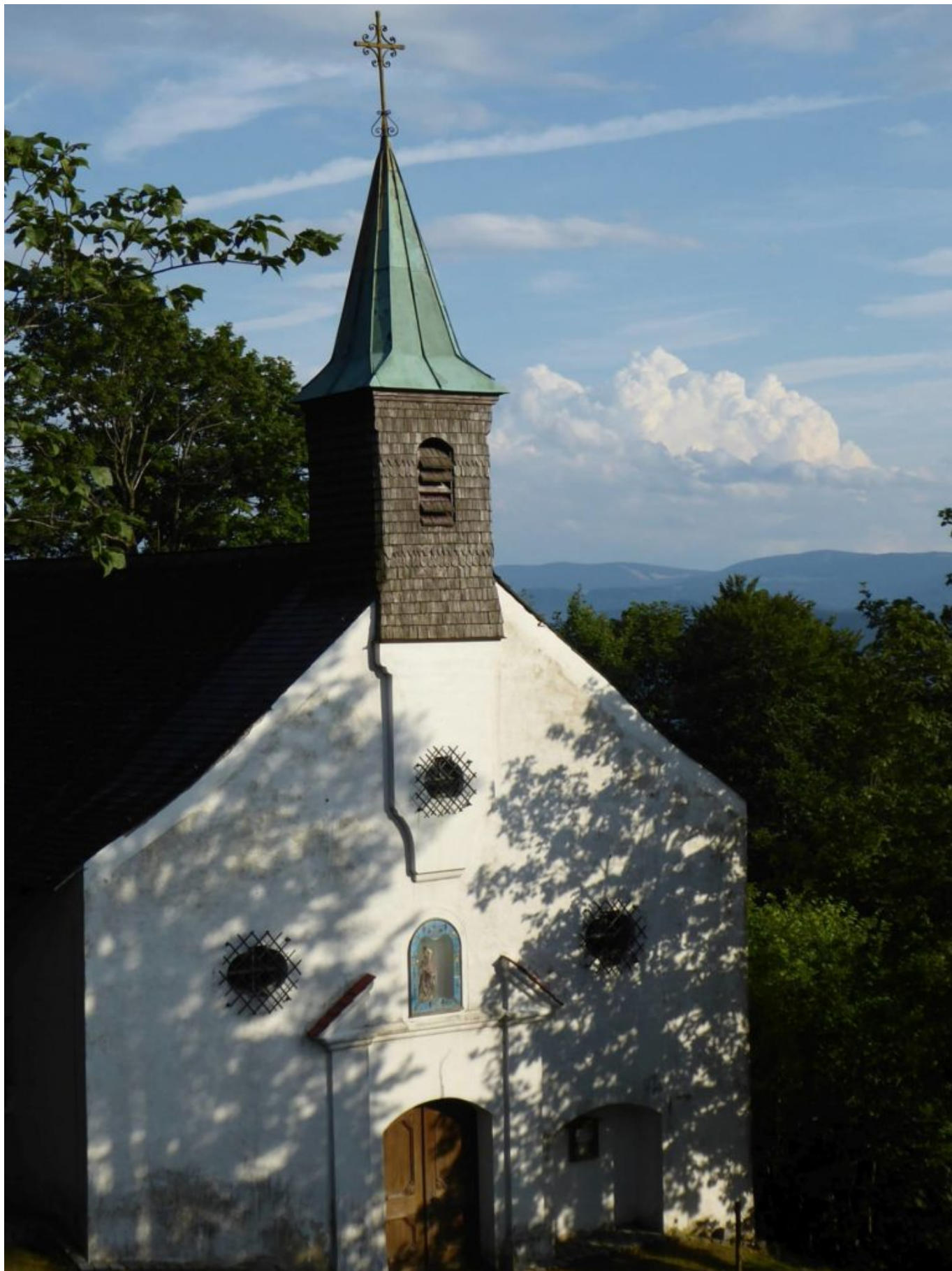
St. Ulrich Haidstein – im Altarbild „eine Kopie des Passauer Mariahilfbildes, zu dessen Füßen sich links der Hl. Ulrich und