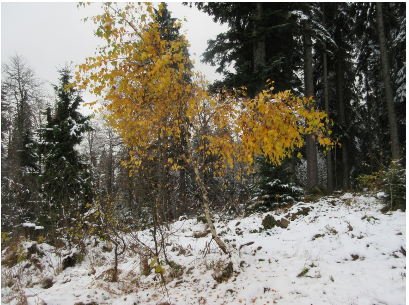
Goldener Gruß im ersten Schnee – Arber-Region 2021