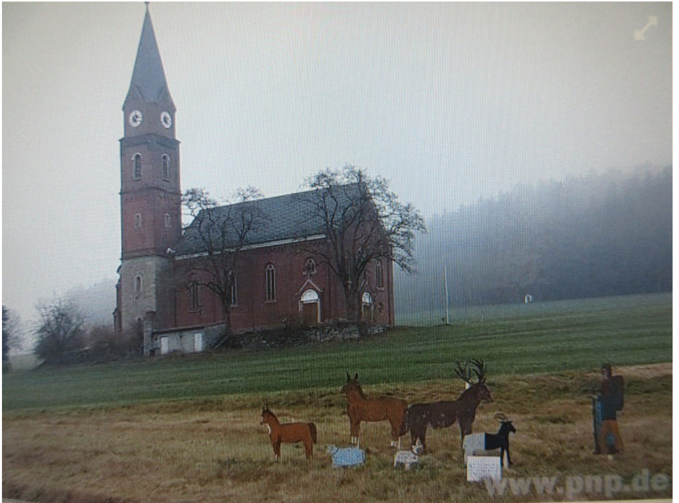
Hirtenszene in Kirchaitnach mit Impuls-Tafel