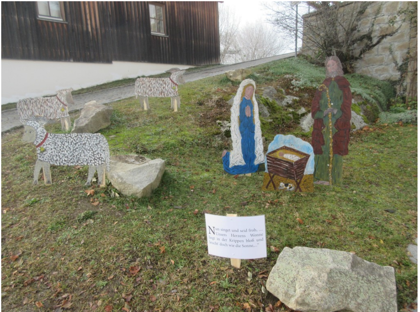
Krippenszene mit Impuls-Tafel am Kirchplatz von Kollnburg – – Foto: Elke Weber