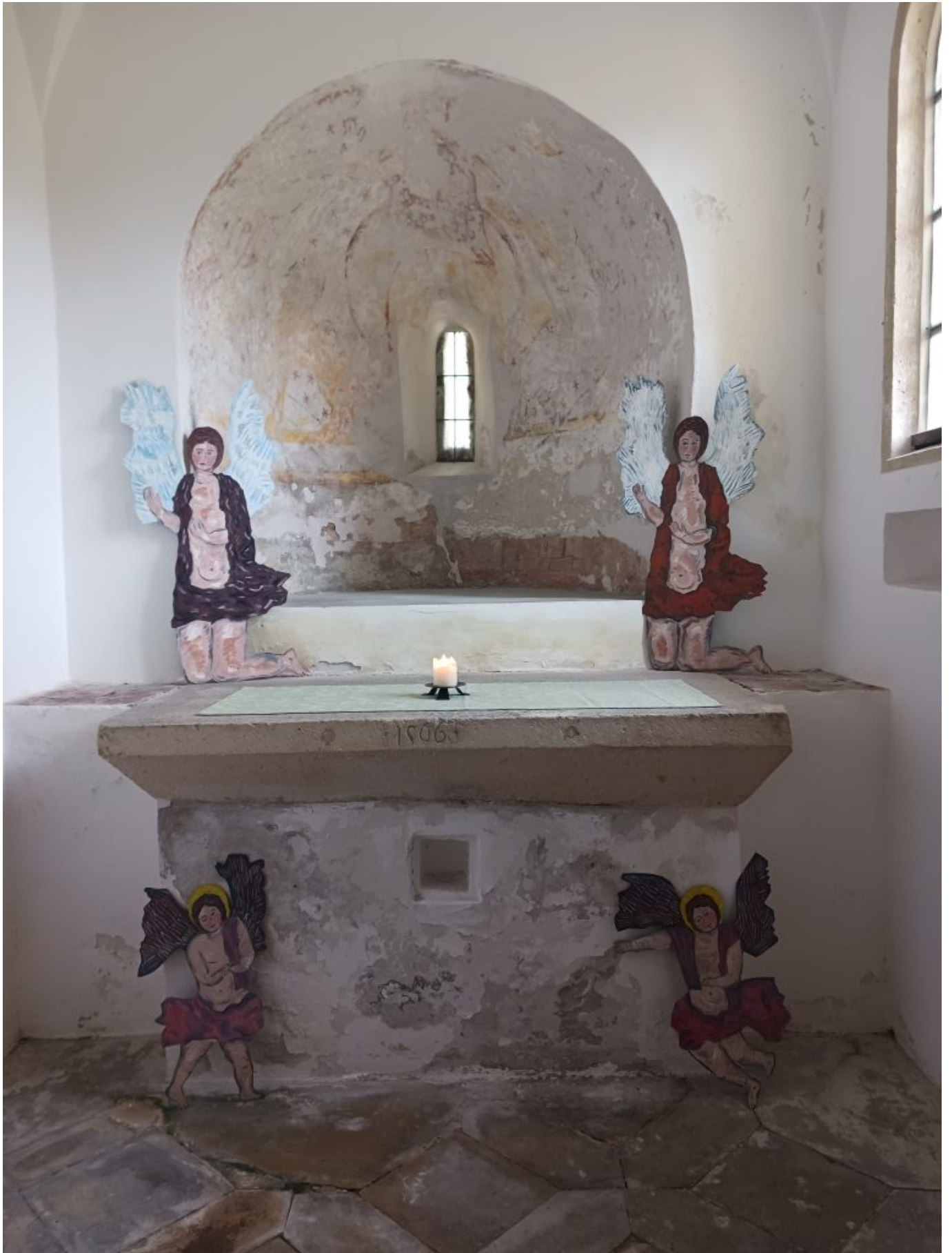
Franks "Kunst-Auffang-Station" – hier: 4 Putten