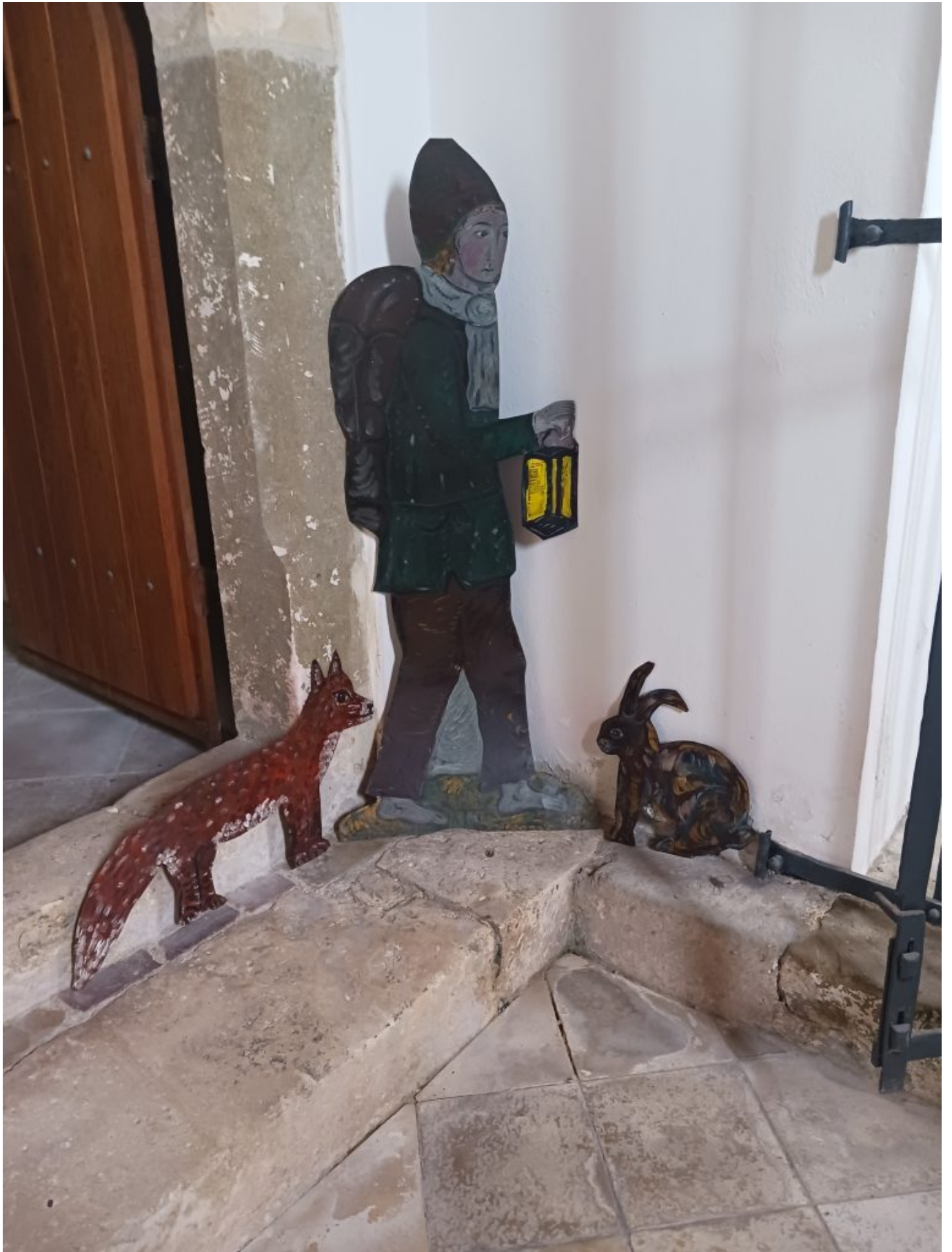
Ziegenhirt, Fuchs und Hase