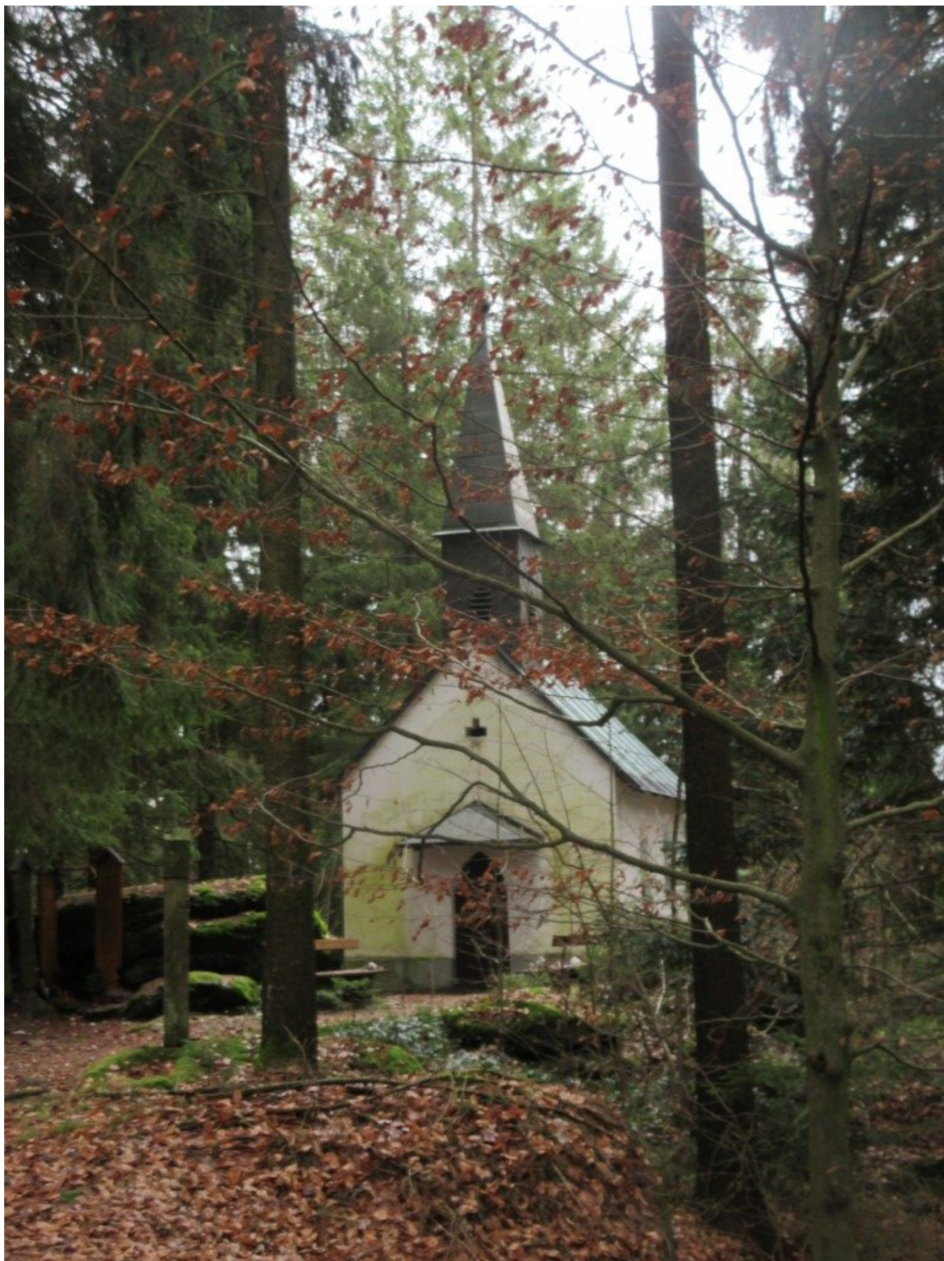
Die im Wald gelegene Steinzenkapelle ist dem Erzengel Raffael geweiht.