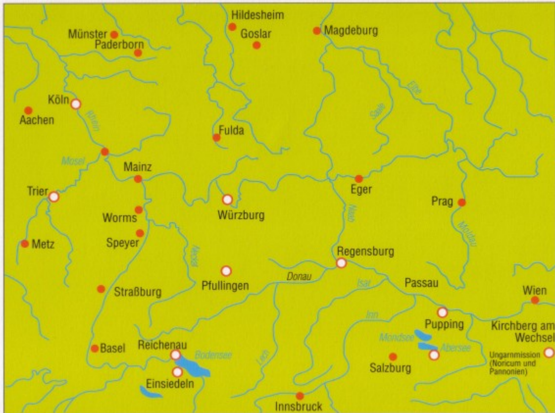
2. Der heilige Wolfgang. Grafik der Lebensstationen des hl. Wolfgang