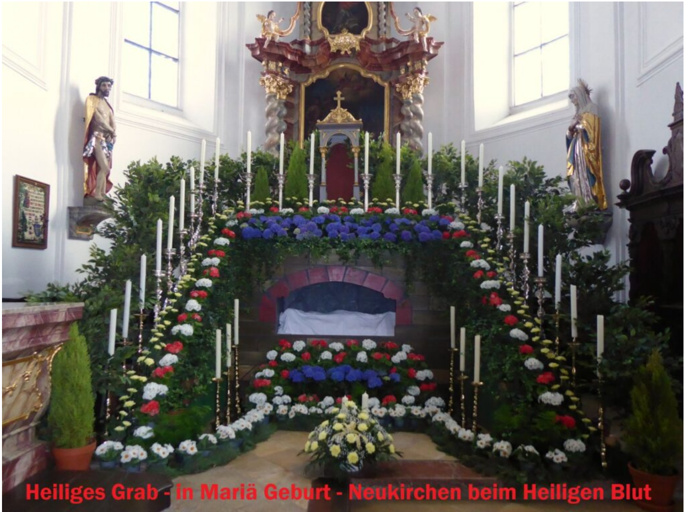
Heiliges Grab - in Mariä Geburt - Neukirchen beim Heiligen Blut

Heiliges Grab – in Maria Geburt – Neukirchen beim Heiligen Blut