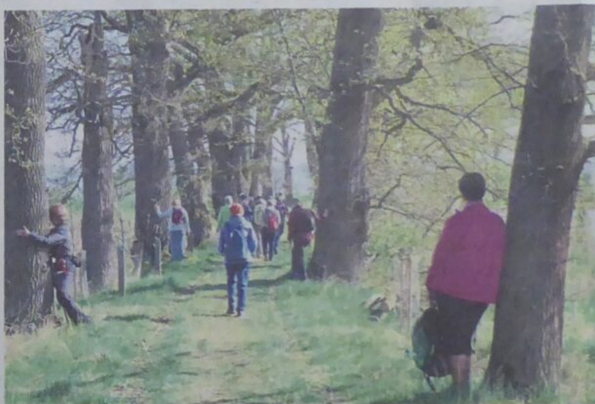
Baumimpuls Eichenallee am Angerweiher.

Die leichte Wanderstrecke von 13 Kilometer führt zuerst durch die über 350-jährige Eichenallee am Anger Röthelsee weiher. Auf dem Weg über Laichstätt und den Großen Angerweiher gibt es auch interessante Informationen über die Regentalauen. Das größte Naturschutzgebiet der Oberpfalz ist ein wertvoller Rastplatz für die Zugvögel. Auf dem ausgewiesenen „Lauschweg“ gibt es weitere geschichtliche Informationen mit historischen Bildern. Ein leichter Aufstieg führt dann über Stadl und Pfahlhäuser zum Rastplatz beim Pfahldrachen. Von dort ist herrlicher Ausblick auf die Bayerwaldberge. Auf einem Teilstück des Pandurensteiges geht es dann vorbei am Schloß