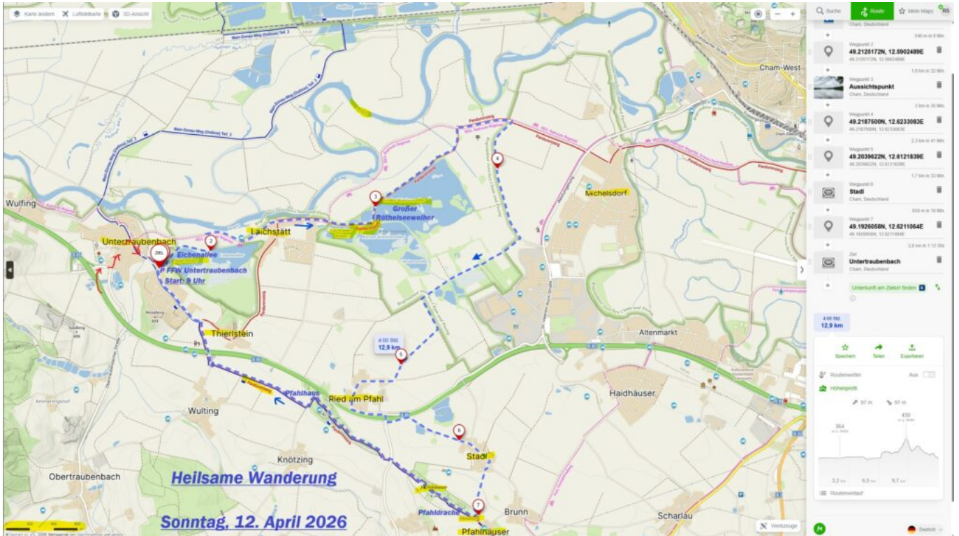
Am 12. April: Angerweiher – Regetalauen – Pfahldrache