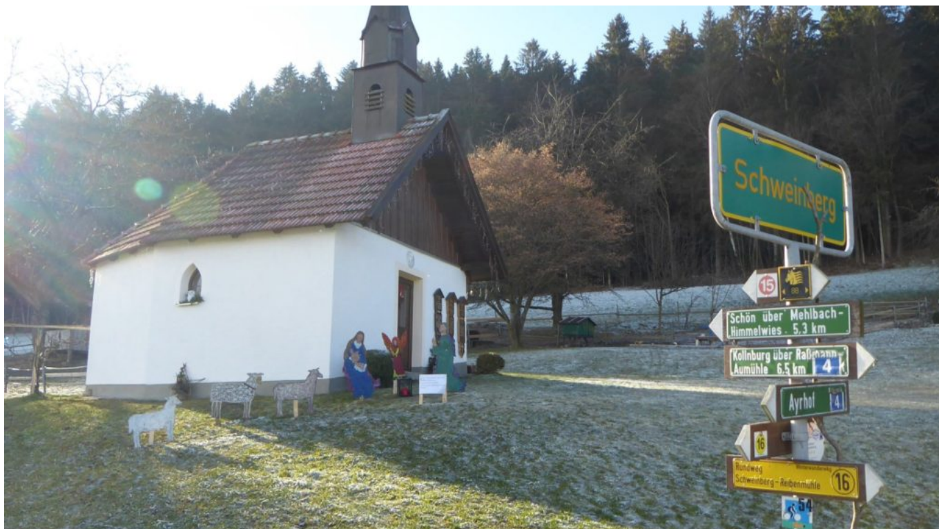
Vor der Hauskapelle der Familie Wilhelm in Schweinberg