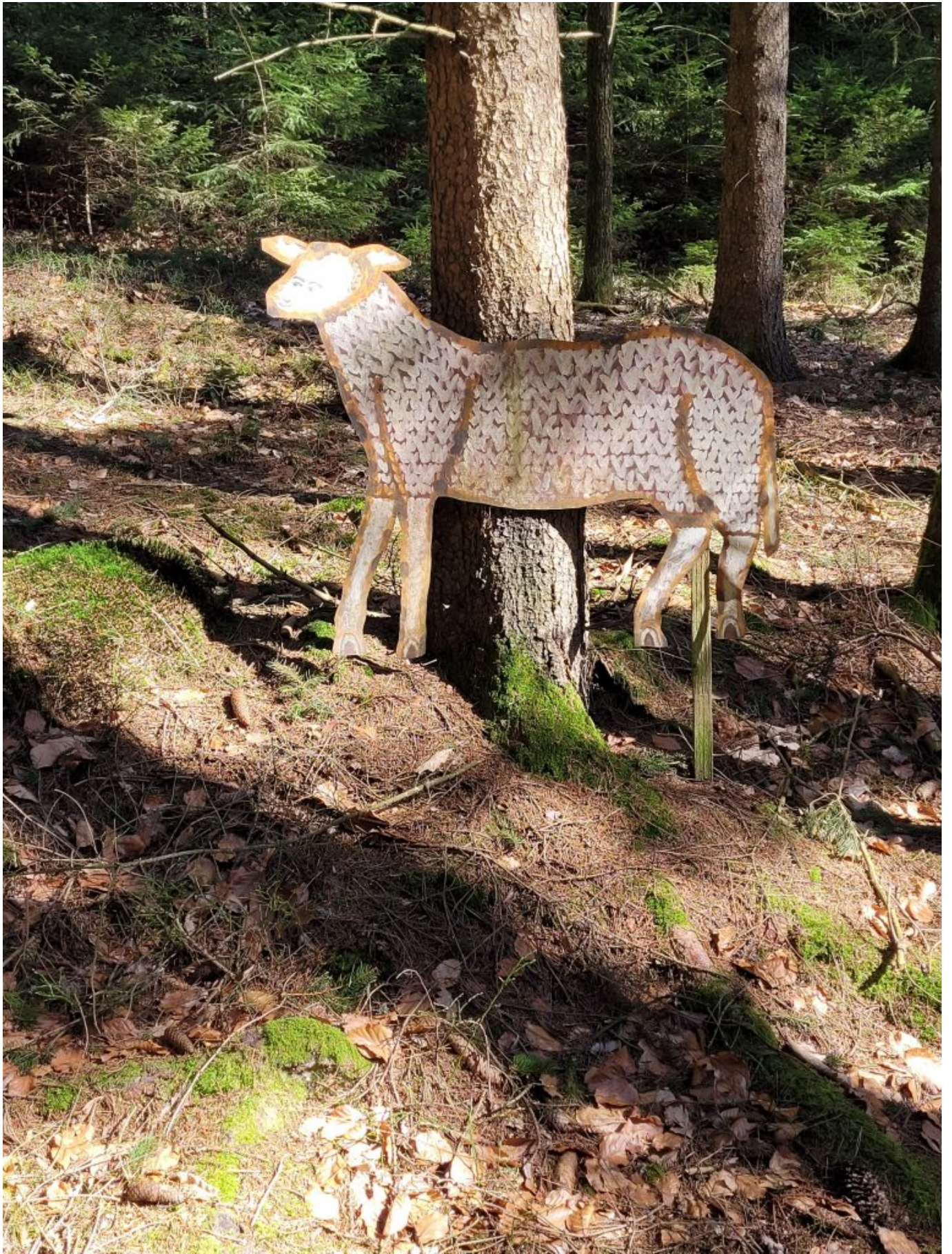
Wolfgang-Blechschaaf im Wald