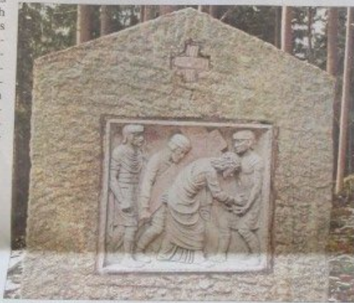
Auf den Reliefs ist der Leidensweg Jesu dargestellt: hier die fünfte Kreuzwegstation: „Simon von Cyrene hilft Jesus das Kreuz tragen“.