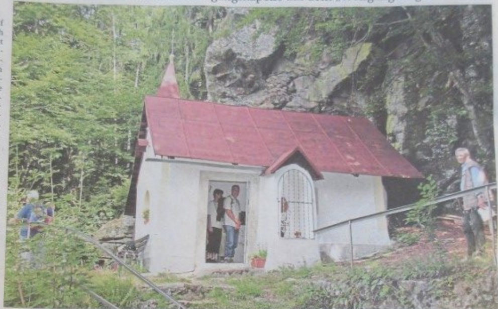
Beliebtes Ziel von Pilgern und Wanderern: die Wolfgangskapelle auf dem Wolgangsriegel hoch über Böbrach.

Die Zahl der Pilger zur Wolfgangskapelle ist heute überschaubar. Es sind vor allem Einzelpilger, die den Kreuzweg hinauf zur Kapelle beten oder die auf dem ausgewiesenen Pilgerlande gewesen sind. Gut 100 Jahre nach der Errichtung des Kreuzwegs, nämlich 1959, ließ Ortspfarrer Josef Knorr (Pfarrer in Böbrach von 1957 bis 1963) einen neuen Kreuzweg errichten. Die etwa 1,20 Meter hohen