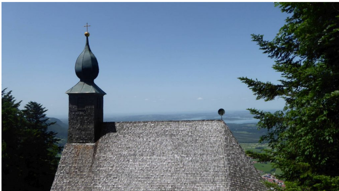
Wunderschön mit Holzschindeln unverkennbar: Die Schnappenkirche im schönen Chiemgau