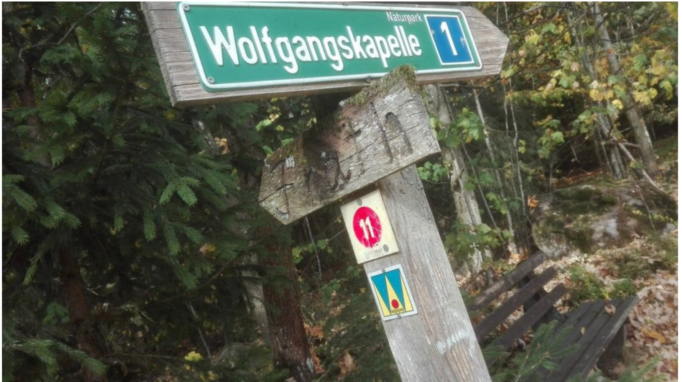
Hinauf zur Wolfgangskapelle