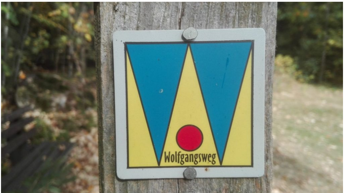
Unser Markierungs-Logo vom Bayerischen Abschnitt des Wolfgangsweges