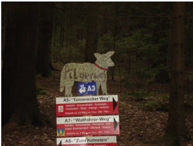
Wolfgangsweg-Blechscharf im Wald am Wolfgangsweg zum Kolmsteiner Kircherl

Der Pilgerweg St. Wolfgang führt heute von Haibühl über den Kolmstein nach Neukirchen/hl.Blut.