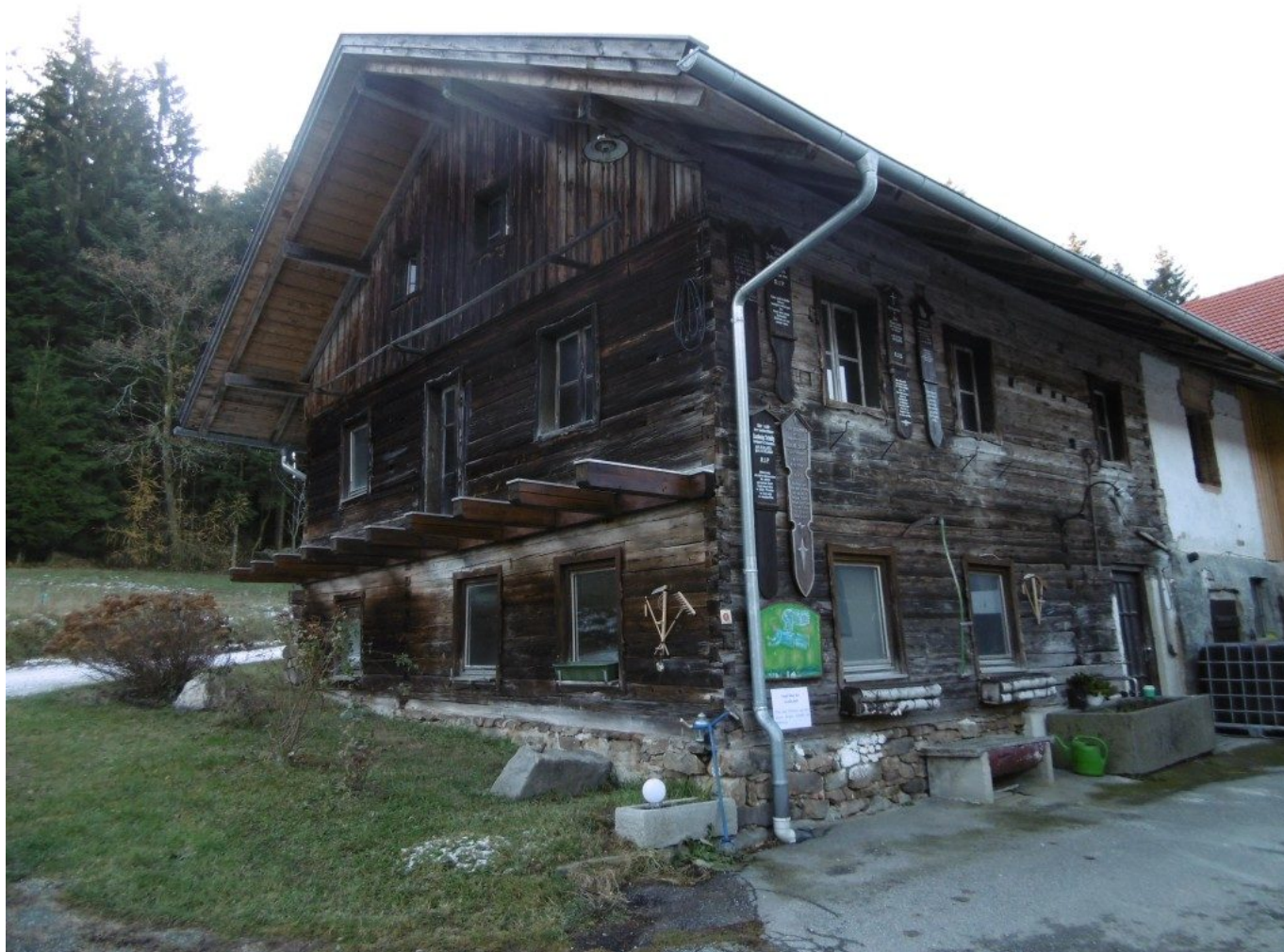
Der Schwabenwirt („Gugatsa“). Am 12er gehts weiter am Wolfgangsweg nach Ramersdorf- Stein – Münchshöfen