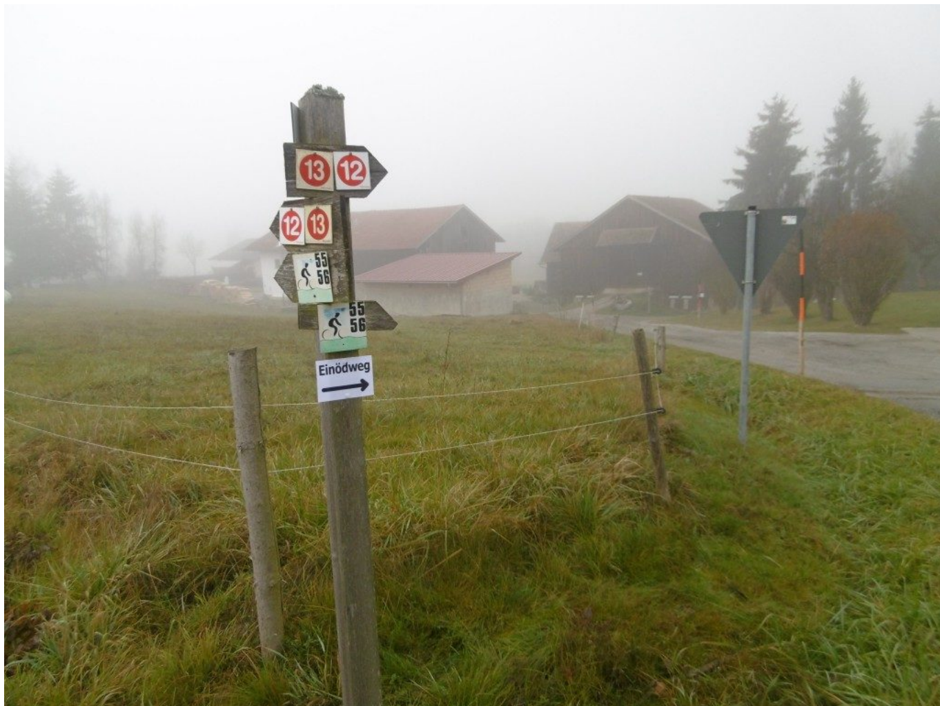
Zu Fuß über Oberhofen am 12er nach Schwaben und Ramersdorf