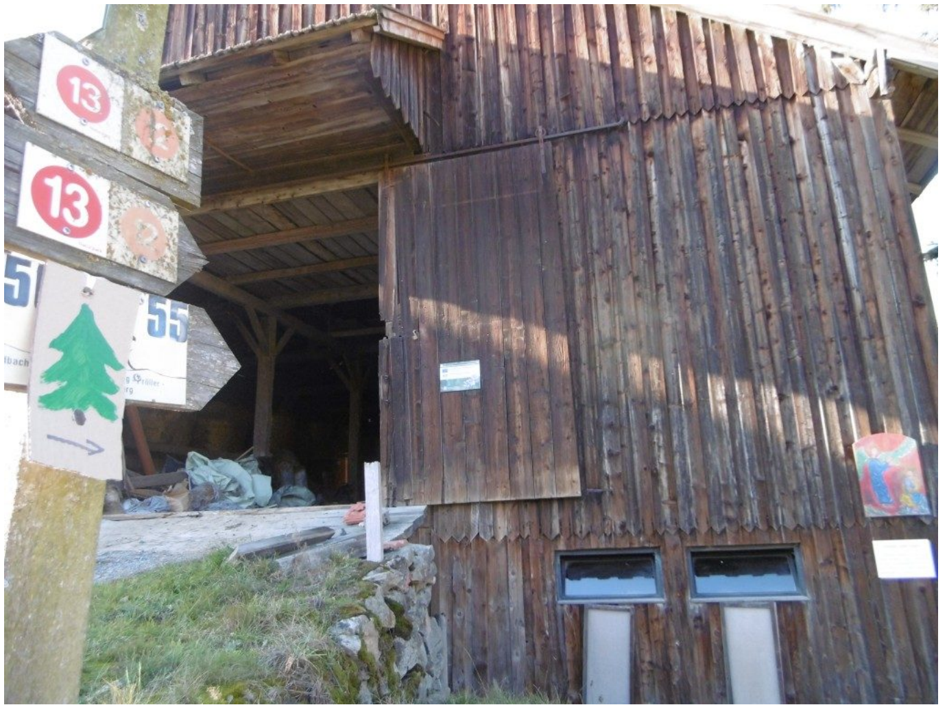
Der Hofbauer liegt am roten 12er-Wanderweg zum Distelberg über Schwaben nach Stein und Münchshöfen, da verläuft auch der Wolfgangsweg.