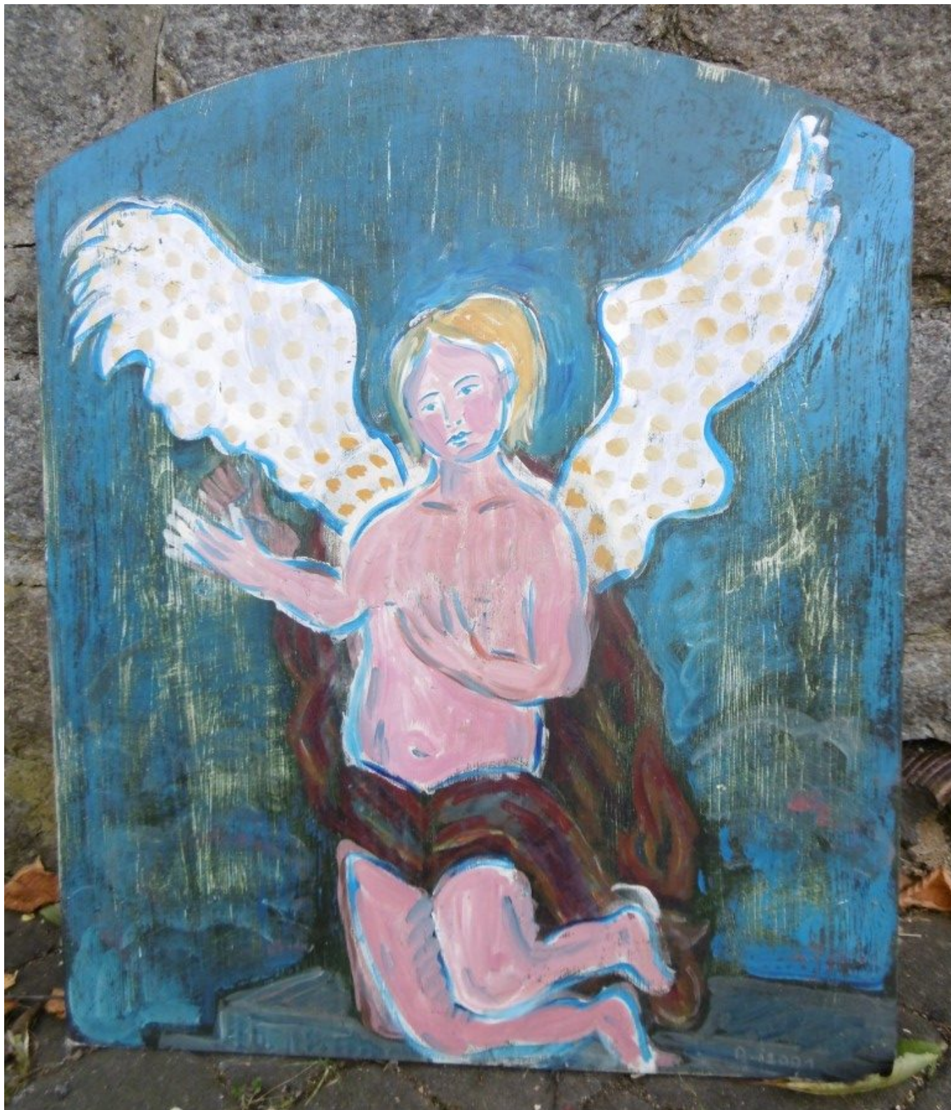
Votivtafel am Schmid-Anwesen (2)