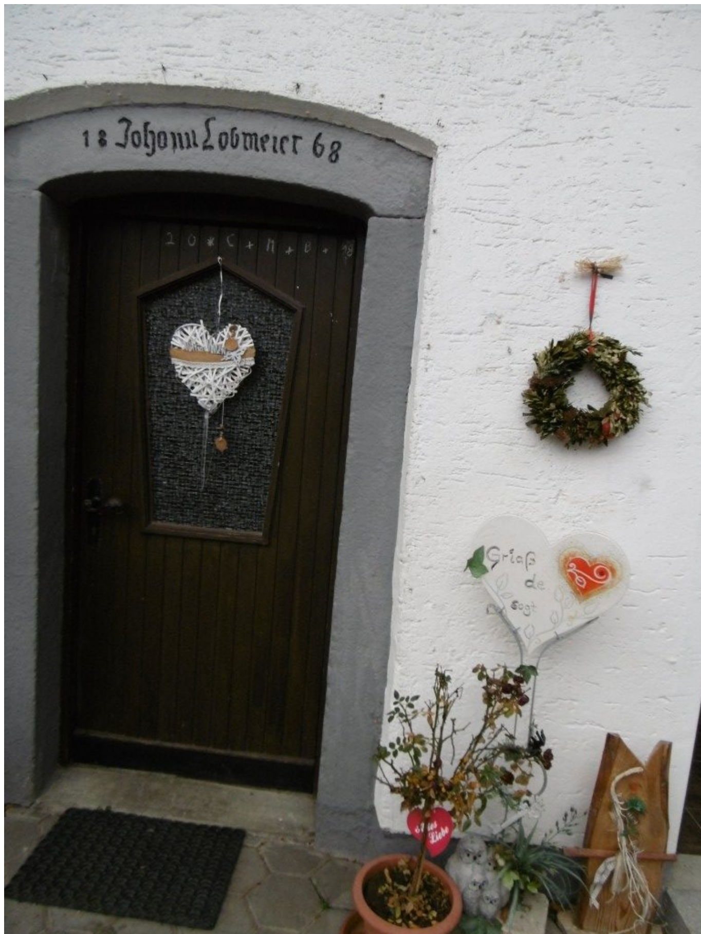
Alter Tür-Stein mit dem Namen Lobmeier