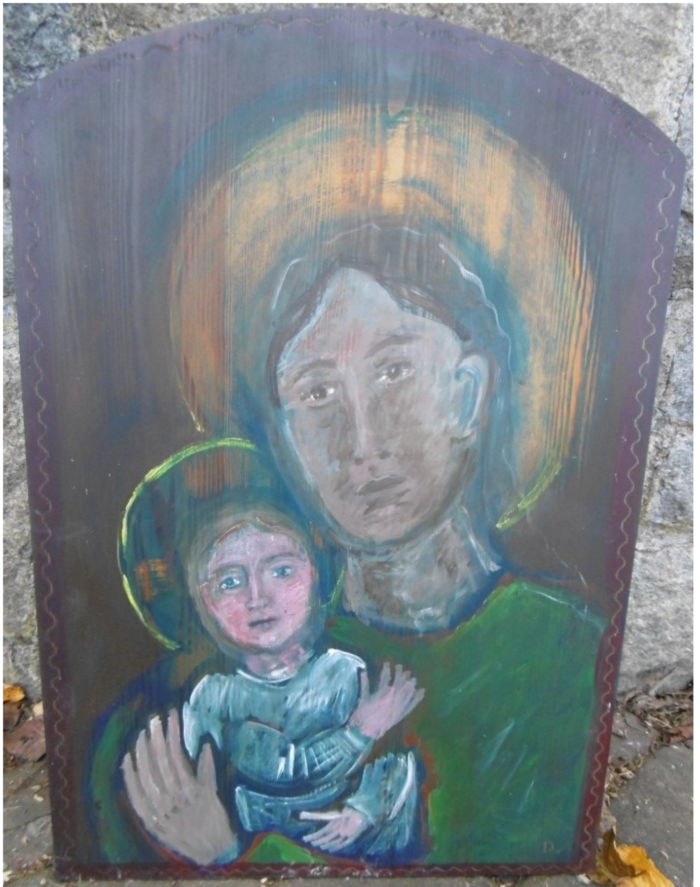
„Josef und Jesus“ heißt diese Holz-Votivtafel von Dorothea Stuffer