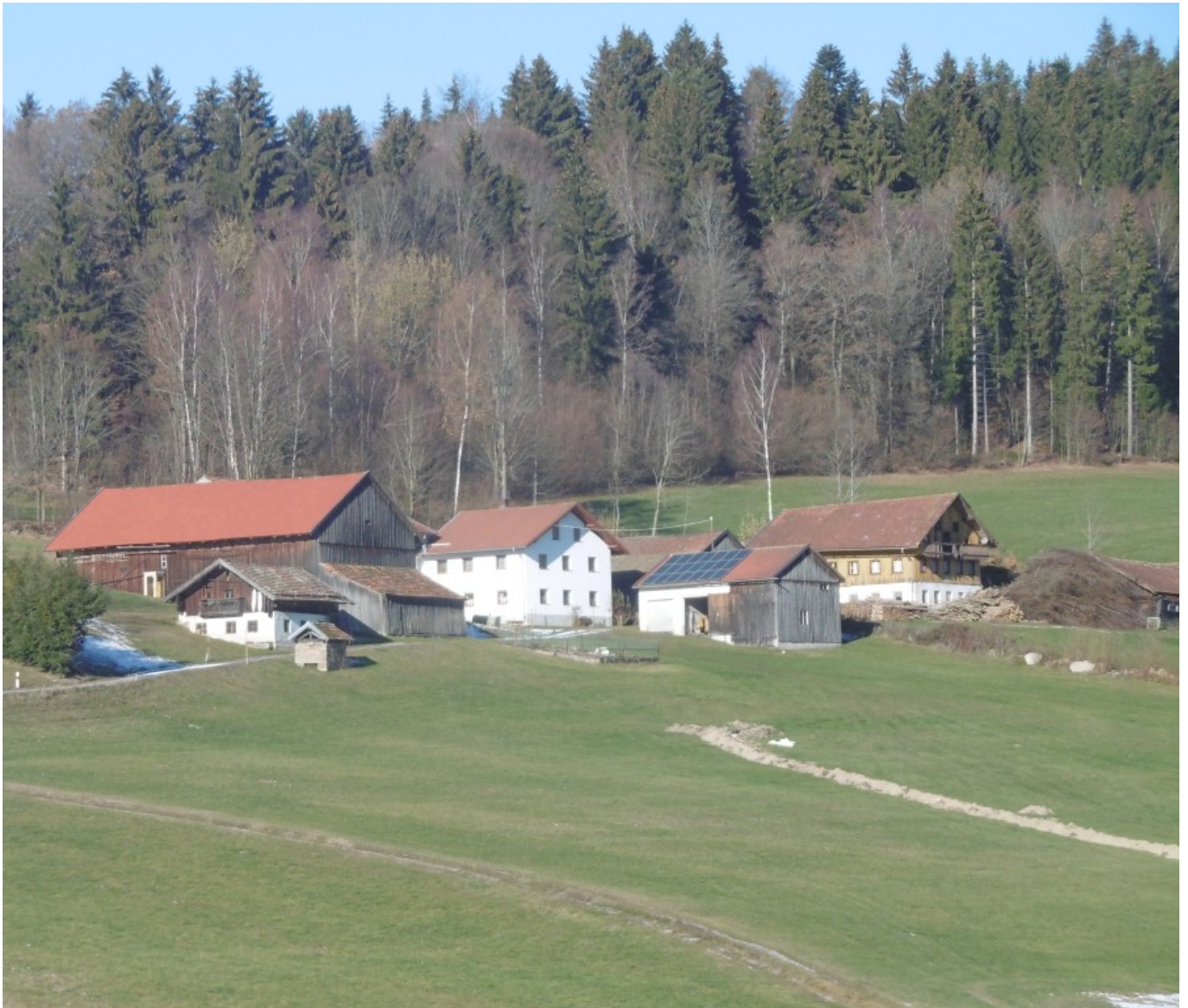
Das Gigler-Anwesen mit Backofen und das Penzkofer-Anwesen (Rechts, ocker) in Ramersdorf am Wolfgangsweg

– weiter auf dem Wolfgangsweg bzw. der roten 12 nach Stein –