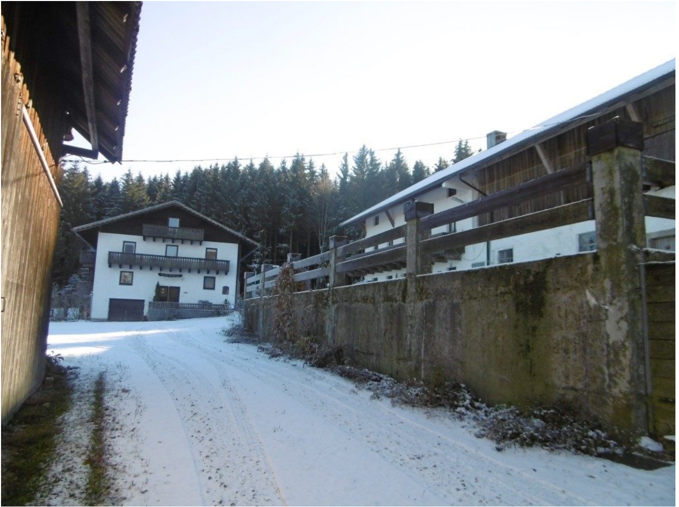
Der Hanslhof, Pension Waldesruh

Hier gibt es Ferienwohnungen in absolut stiller Lage am Waldrand in Stein. Folgt der Einödwanderer dem Wolfgangsweg, wird er durch den Wald weiter in Richtung Münchshöfen auf über 800 Meter Höhe geleitet. Vor der Votivtafel brennt täglich eine Kerze.