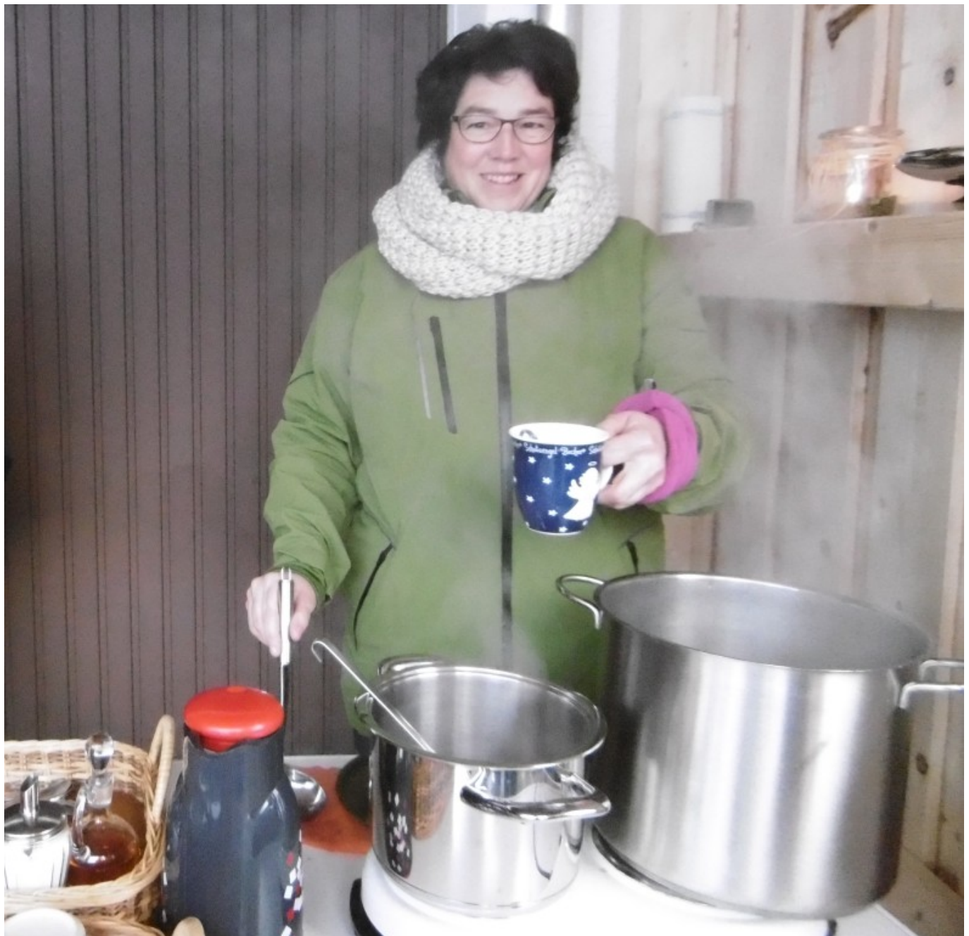
Die Gäste werden von der Hofbäuerin im Unterstand freundlich mit heißem Punsch empfangen.