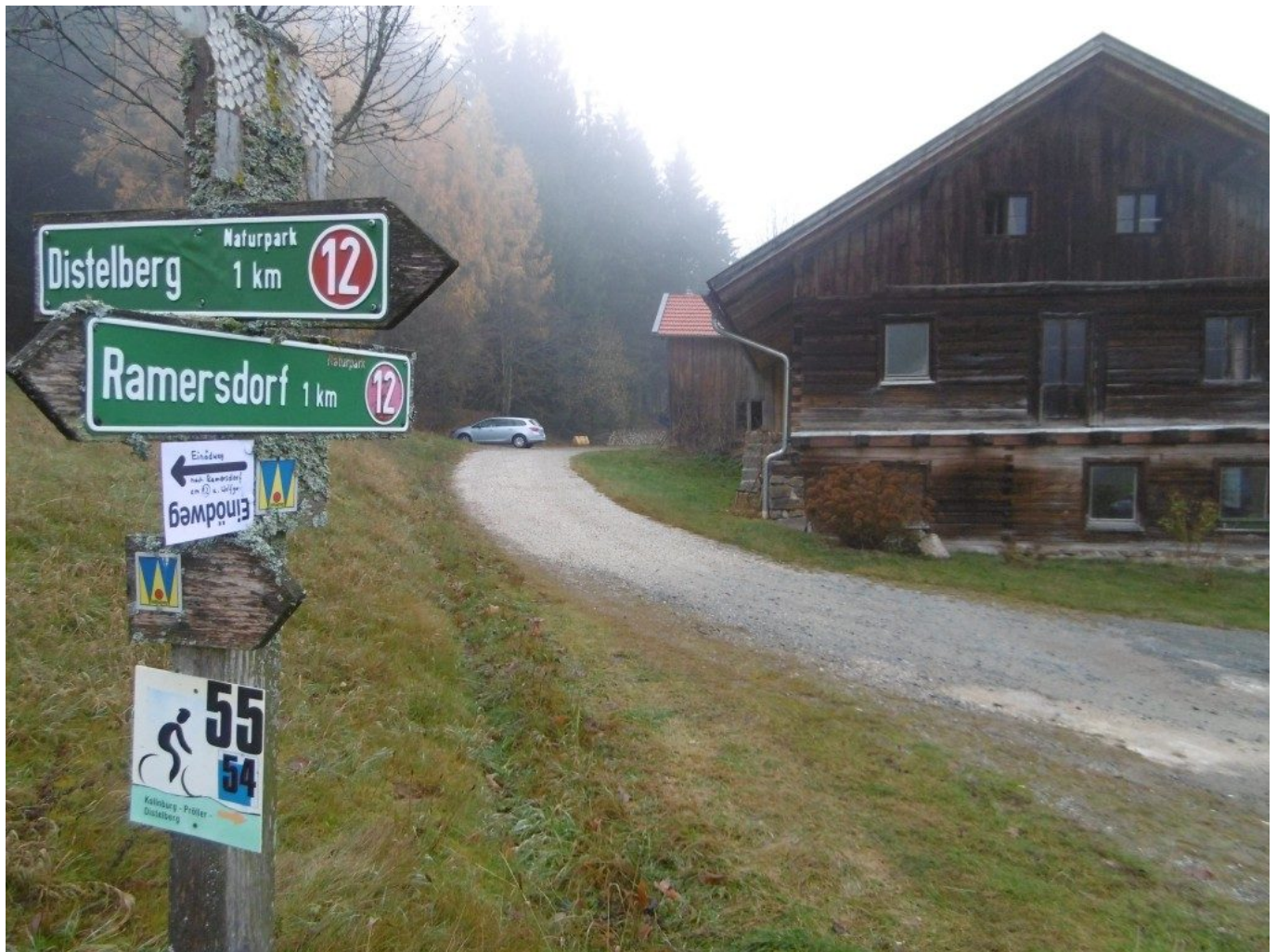
Wegmarkierung beim Schwabenwirt nach Ramersdorf 1km.