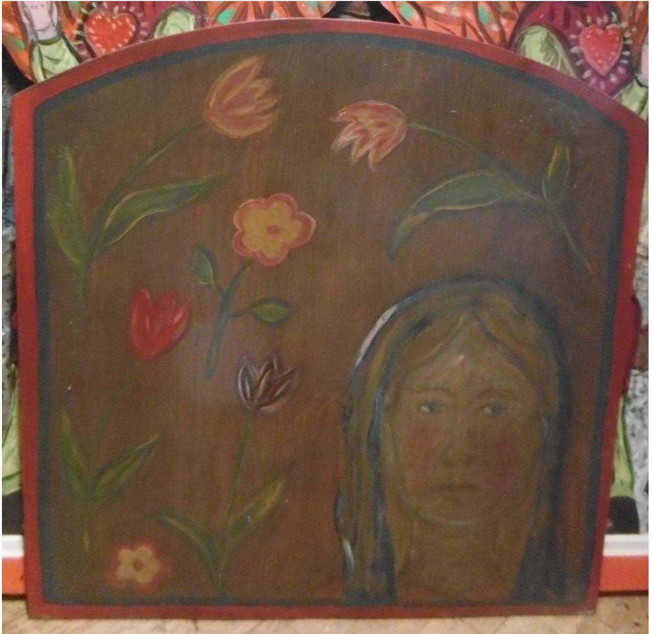
Votivtafel: Mit Maria durch Blumen gehen