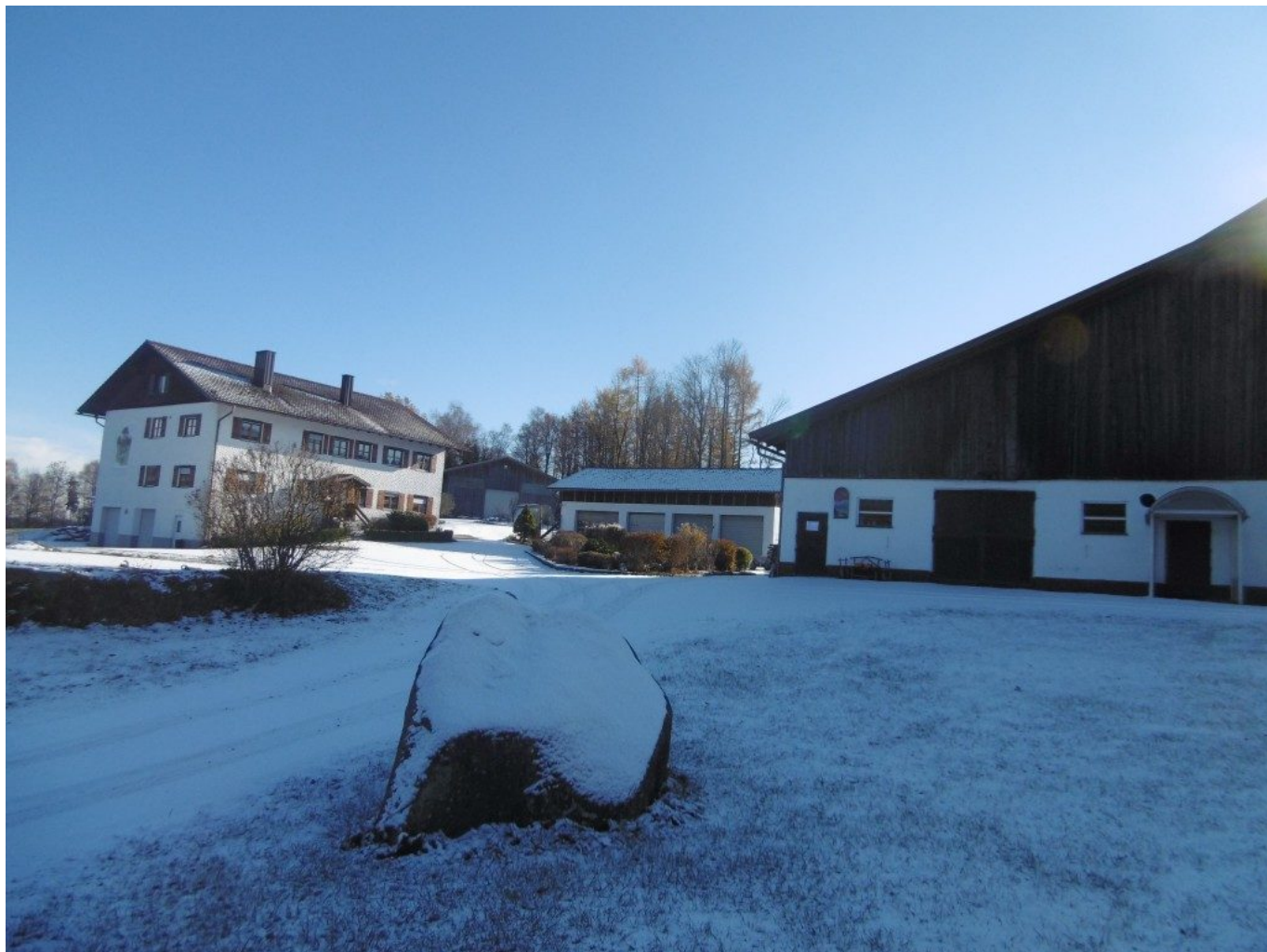
Der Bielmeier Bernhard Hof in Ramersdorf

Dieser Hof im Ramersdorf wird zum ersten mal erwähnt im 11.Jahrhundert.