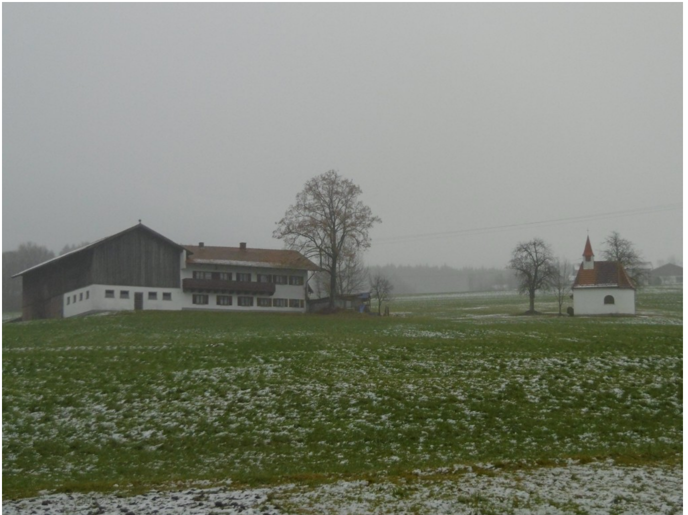
Das Bielmeier Anwesen, früher Lobmeier