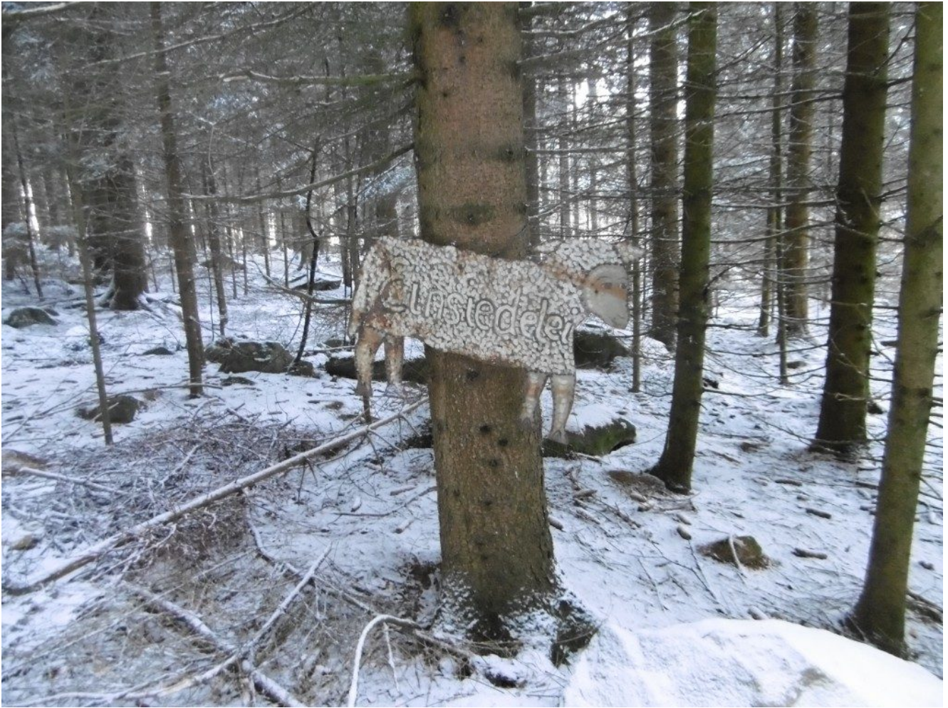
Wolfgangsweg-Blechschat am Weg zwischen der Einsiedelei und Münchshöfen