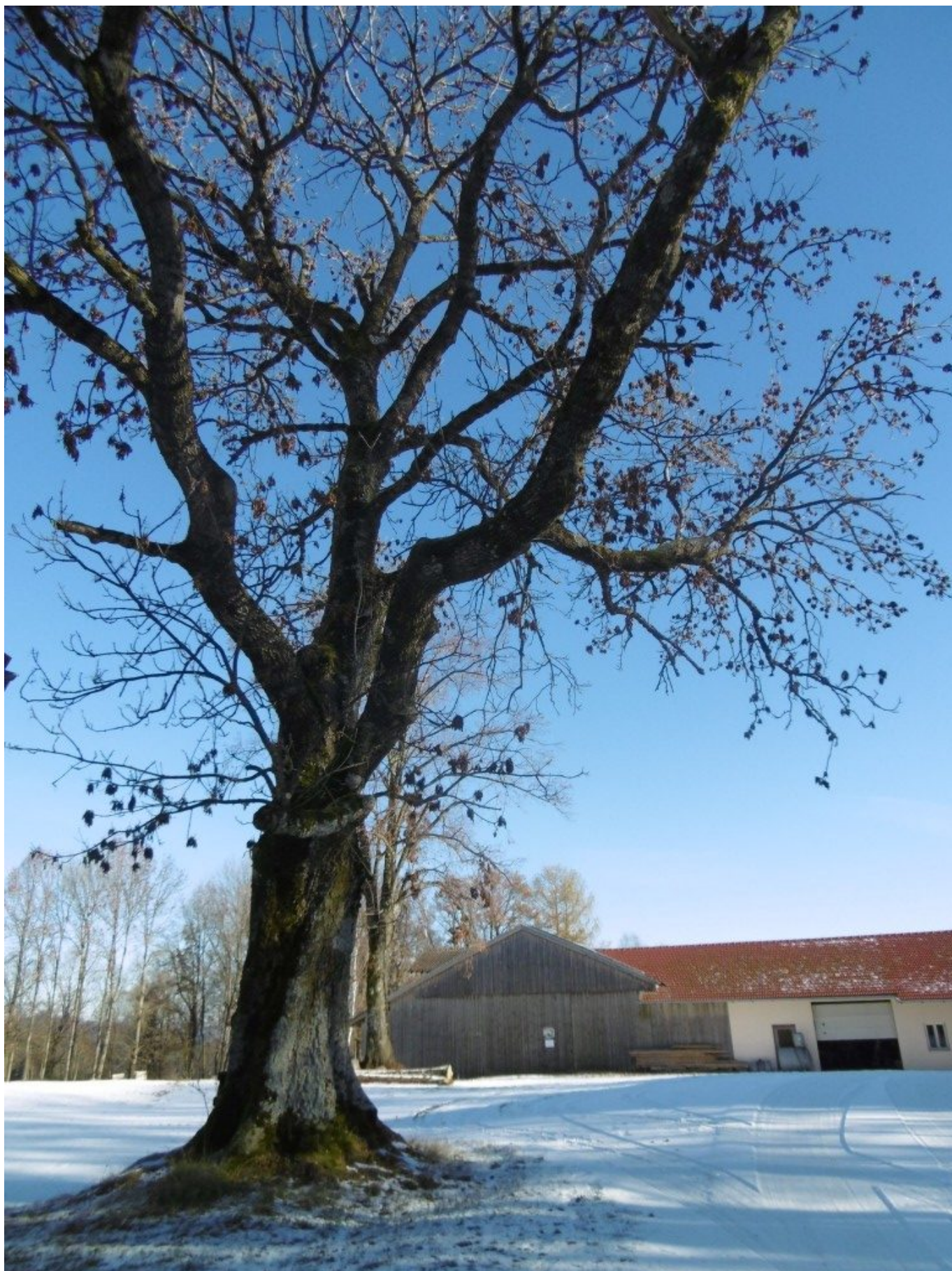
Der Langerbauer in Stein am Wolfgangsweg