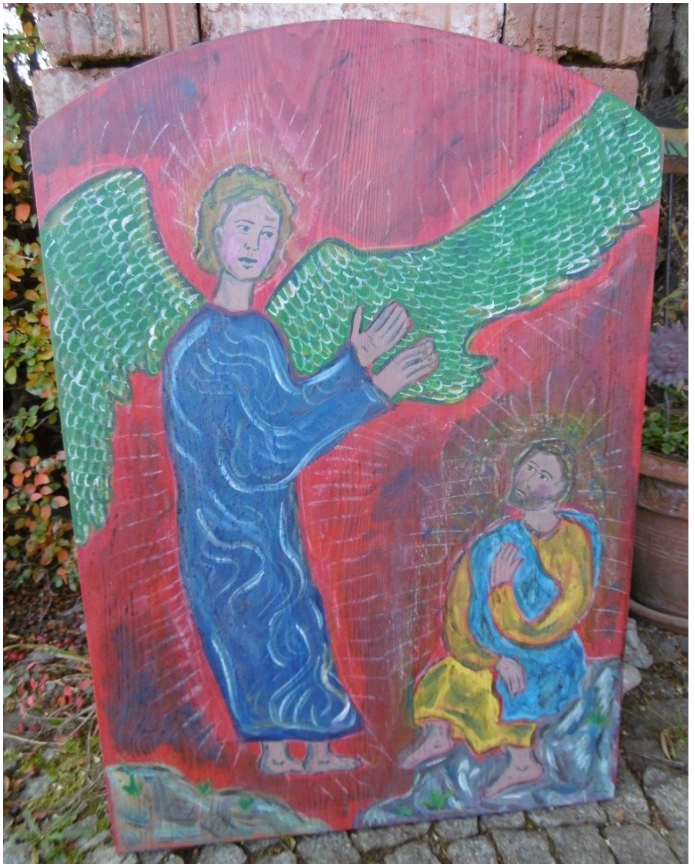
Prophet und Engel