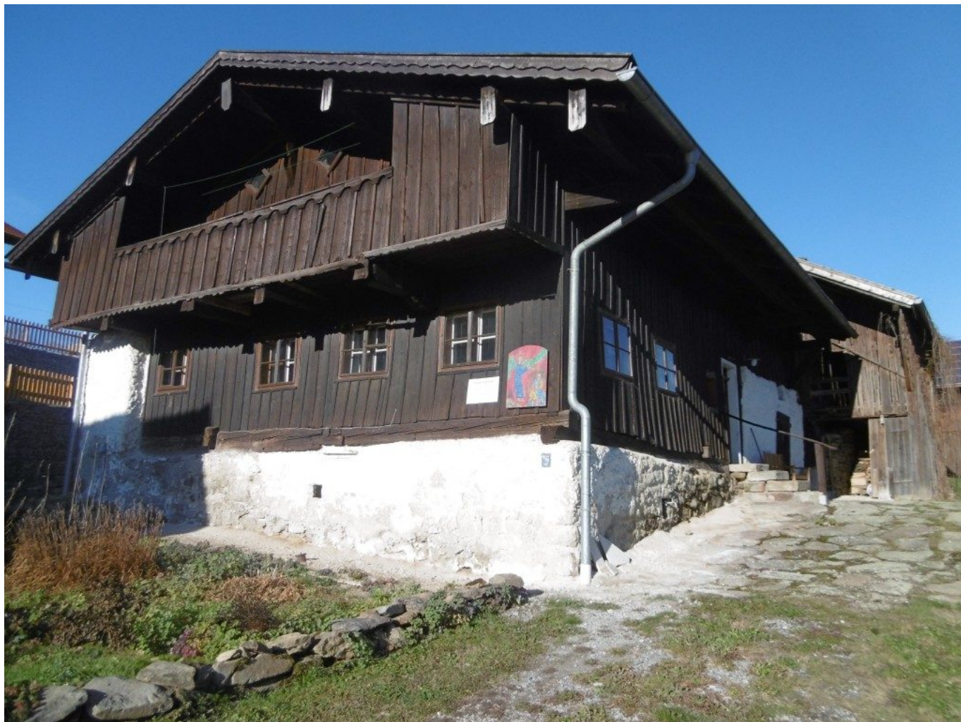
Das Edenhofer-Anwesen in Rechertsried (Die Bildtafel mit Impuls wird allerdings demnächst auf die rote 12 verlegt.)