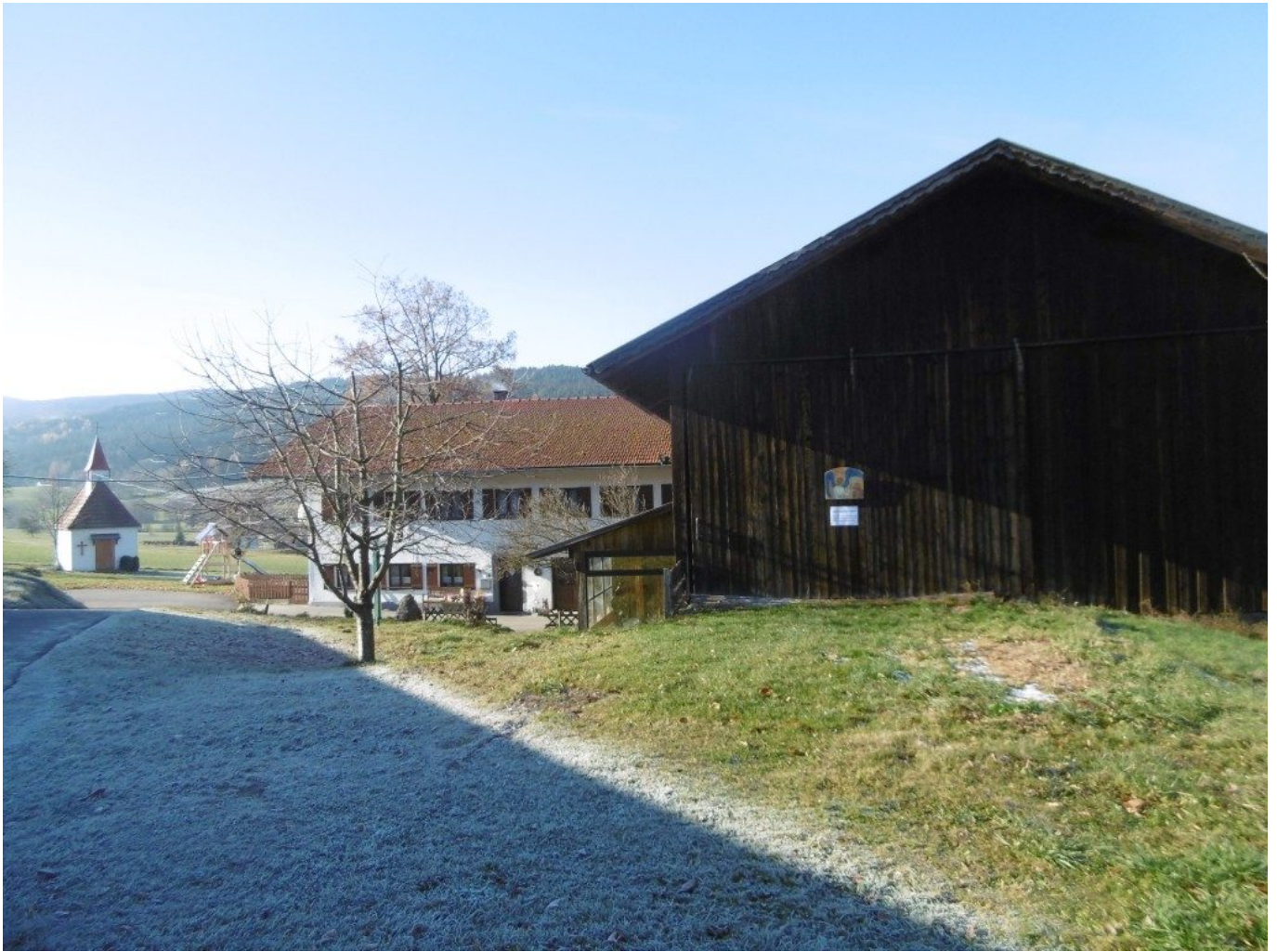
Die hübsche Marienkapelle grüßt nach Rechtersried