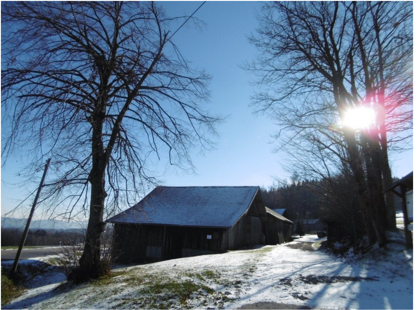
Das 1. Schmid-Anwesen (rote 14)