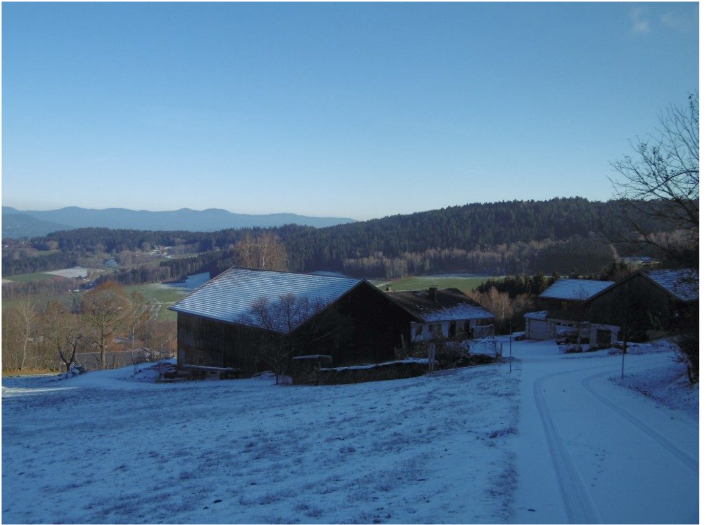
Der Gogl an der Bärwurz-Resl vorbei