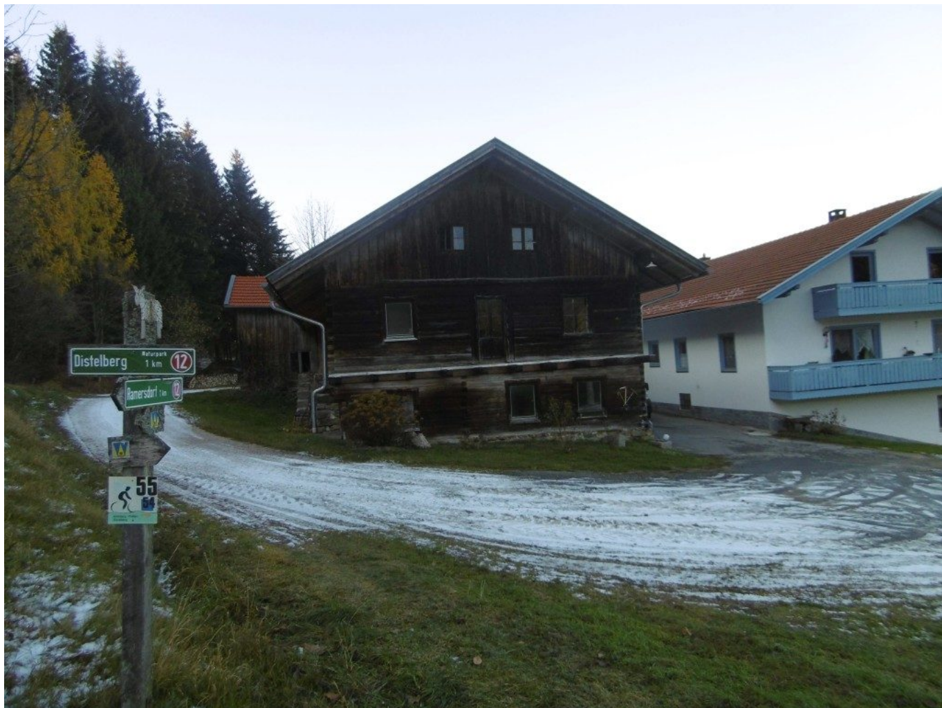
Die rote 12 und das Wolfgangs „W“ beim Schwabenwirt