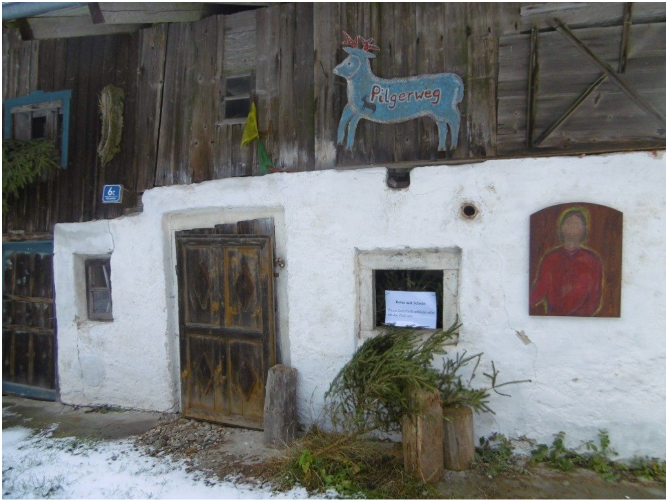
Hausfassade mit Votivtafel und Impuls und mit Blech-Hirsch „Pilgerweg“