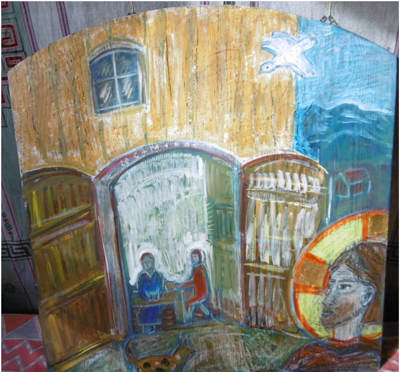
Diese Votivtafel am Probst-Otto-Anwesen heißt: „Offene Tür“