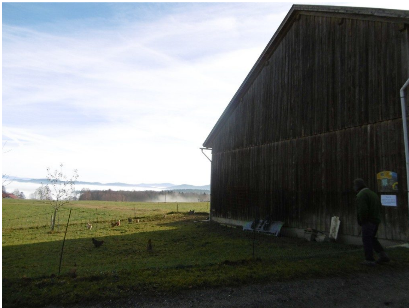
Über den Nebeln: Otto Probst