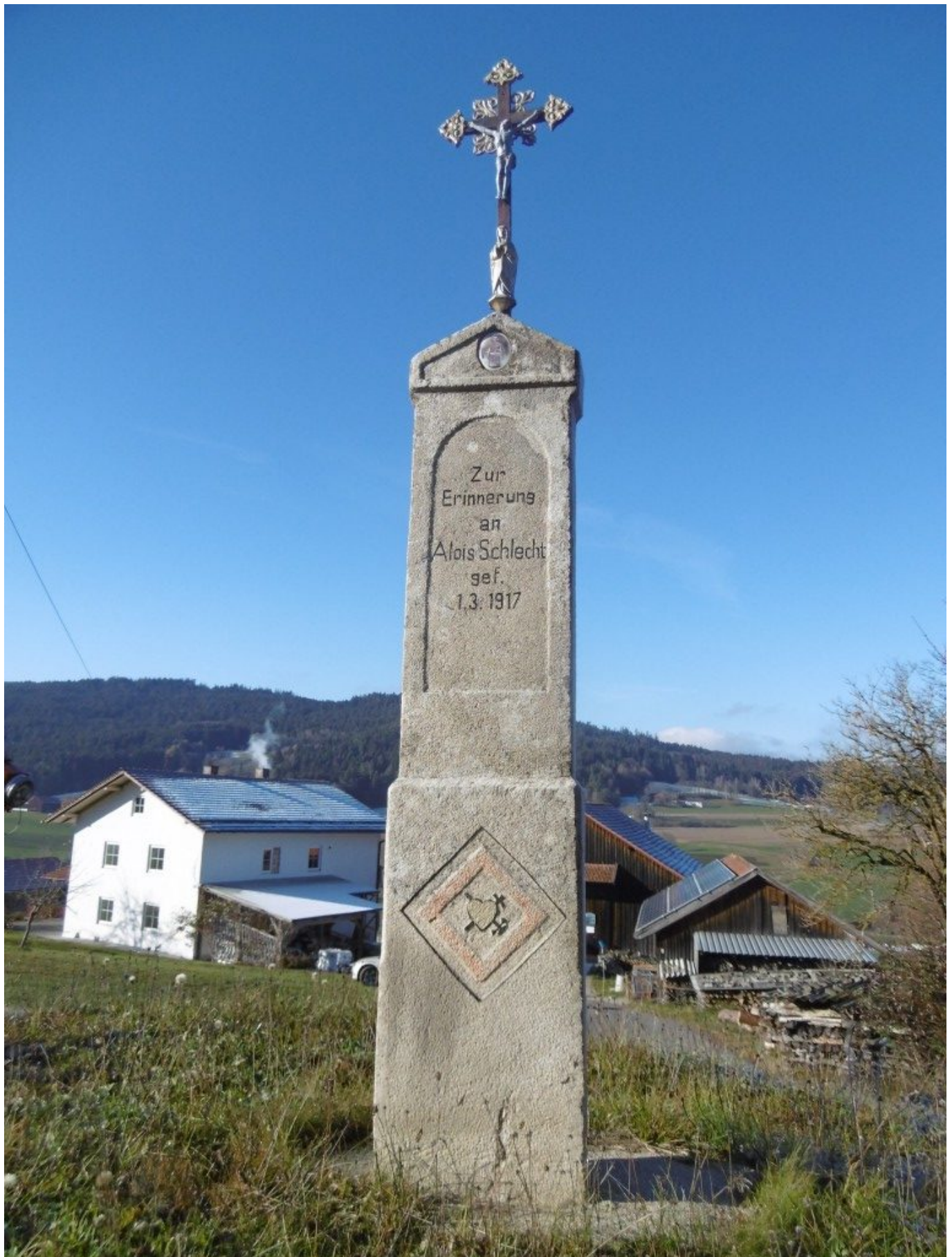
Wegkreuz am Brandlhof

Hier eine Wegbeschreibung vom demnächst eröffneten „Einöd-