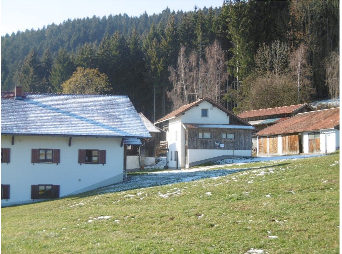
Das Schmid-Anwesen in Berging

Geht der Einöd-Pilger am schönen „4“ mit den großen Findelsteinen von Münchshöfen kontinuierlich am Waldrand bergab, kommt er oberhalb des sonnig gelegenen Schmid-Anwesens (2) an einer Gruppe Totenbrettern und einem alten Wegkreuz „Zur Ehre Gottes“ vorbei. Diese Weg-Stelle war schon immer ein guter Orientierungspunkt. Früher gab es am Schmid-Anwesen 20 Milchkühe und Kälber, heute laufen hier einige glückliche Hühner herum. Es gibt hier eine eigene Quelle mit gutem Pröllerwasser.