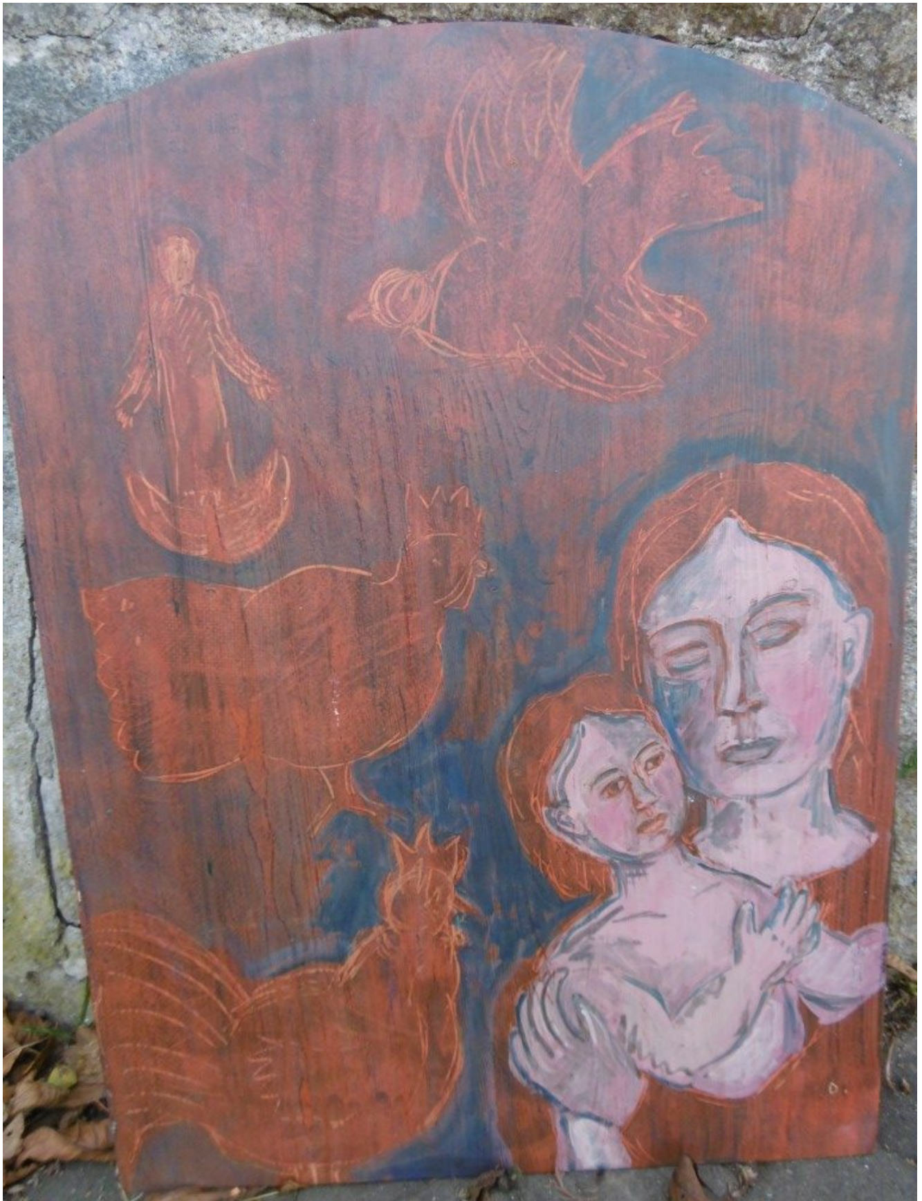
Das JA der Maria