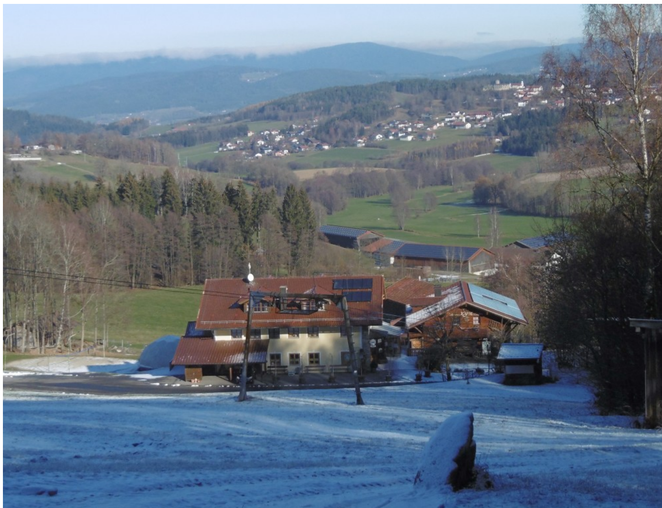
Die Bärwurz Resl liegt am Pröller-Nordhang-Schilift