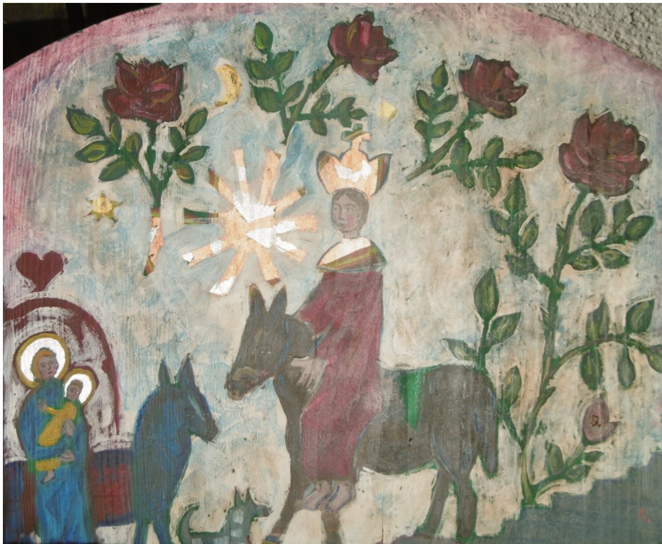
„Der Rosenkönig“ heißt der Titel dieser Holztafel der Künstlerin Dorothea Stuffer