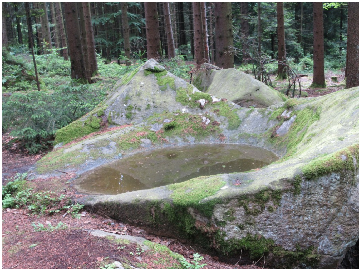
Mitten im Wald: Uralter keltischer Kultplatz am Baumschutz-Engelpfad