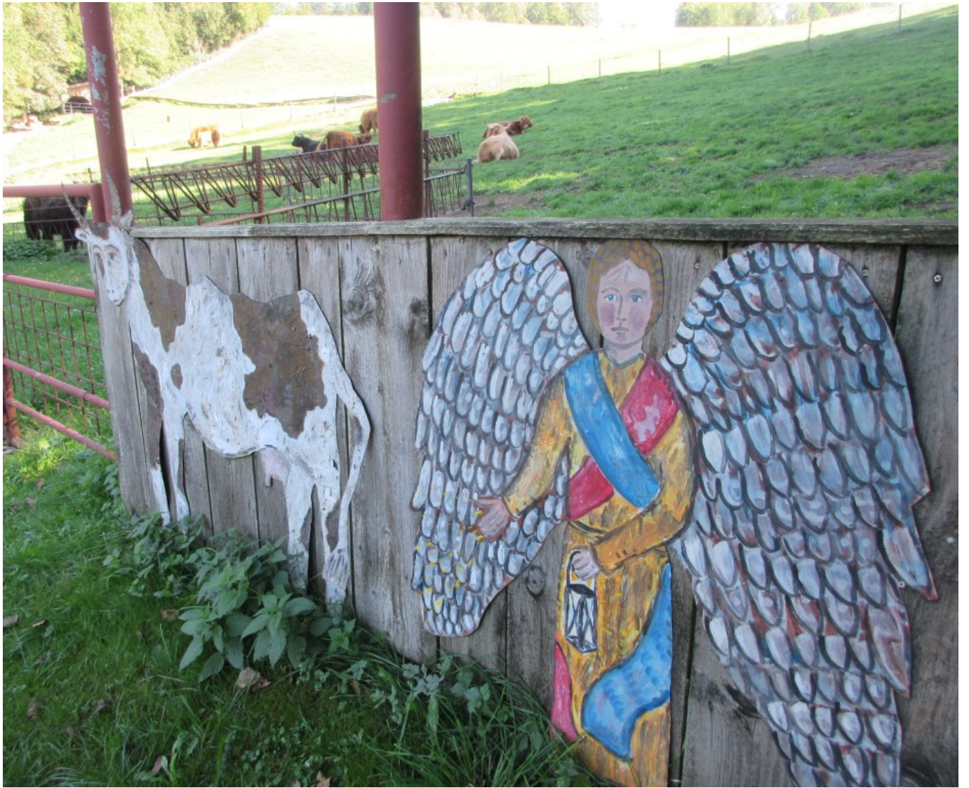
Schutzengel für Kühe bei den Hochlandrindern