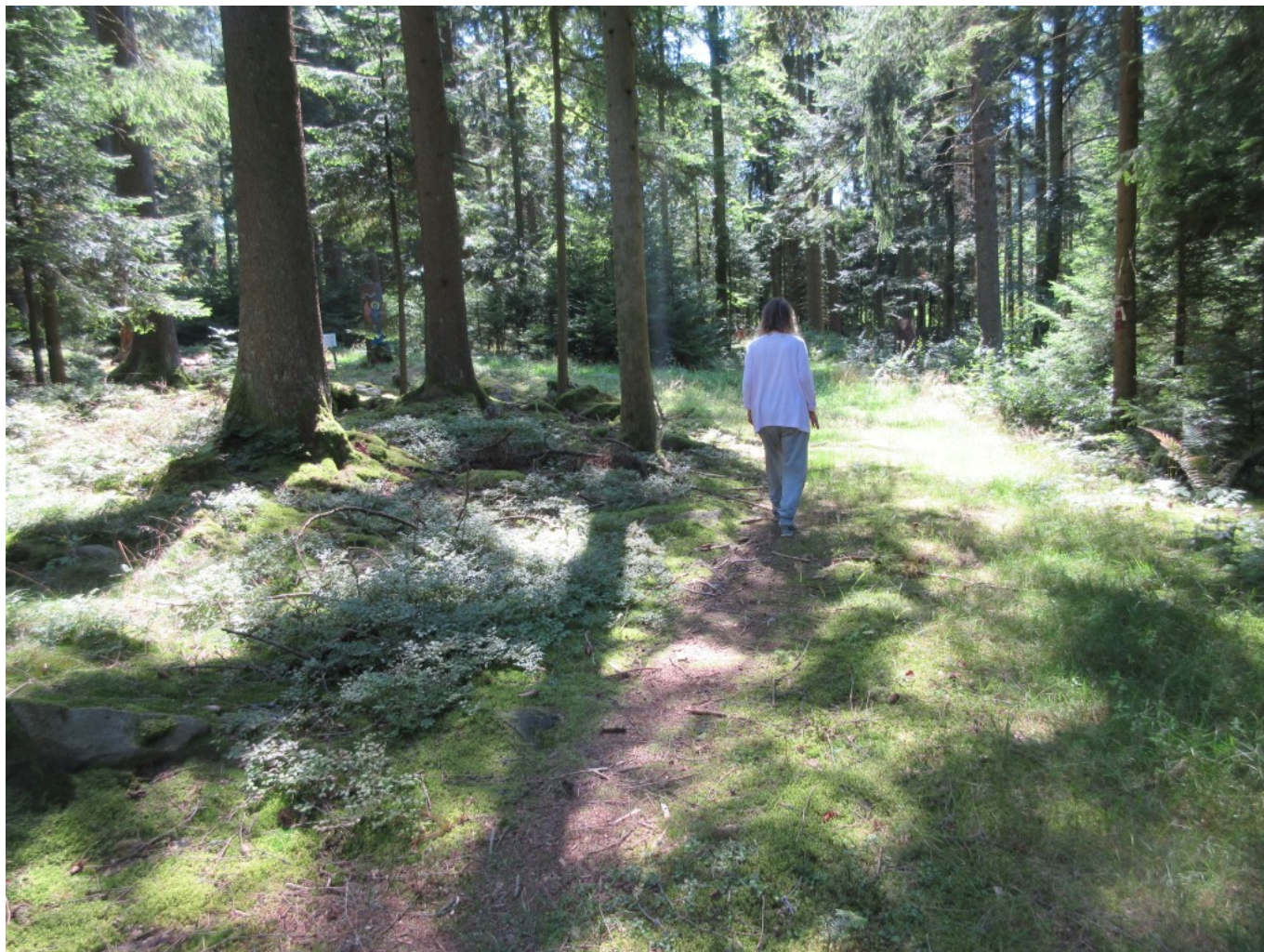
Pilgerhelferin Sylvia Dressler am Waldweg