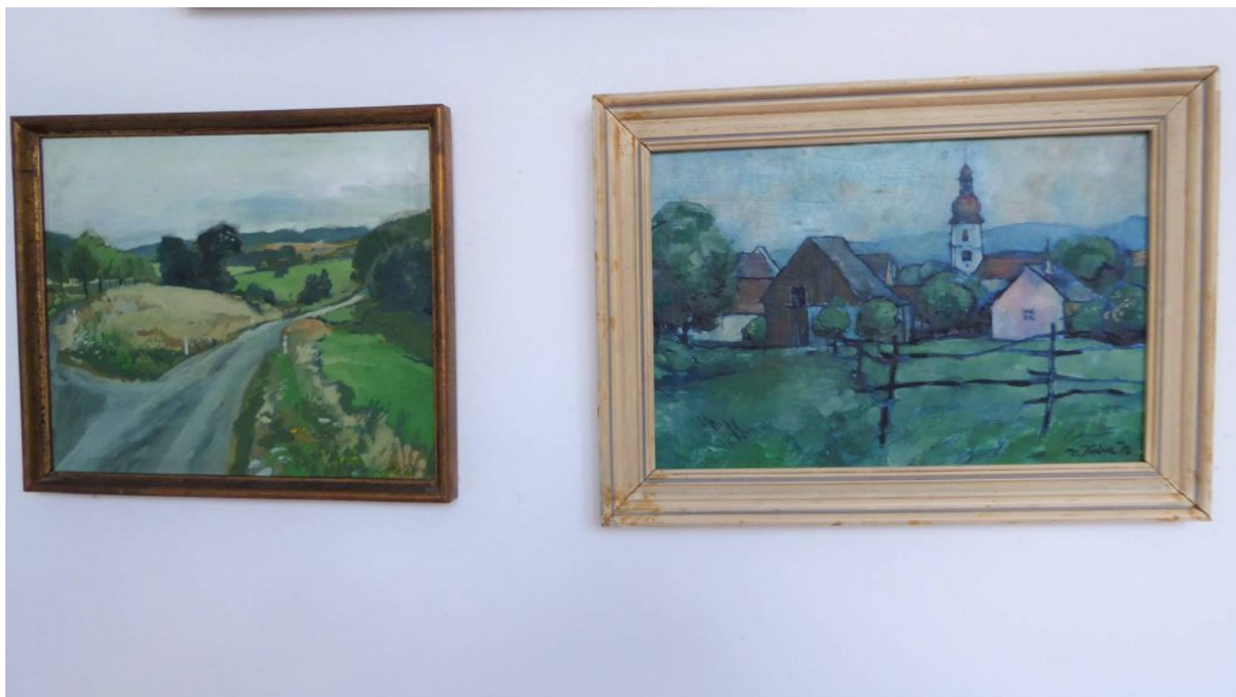
Weitere Bilder von Václav Kubec