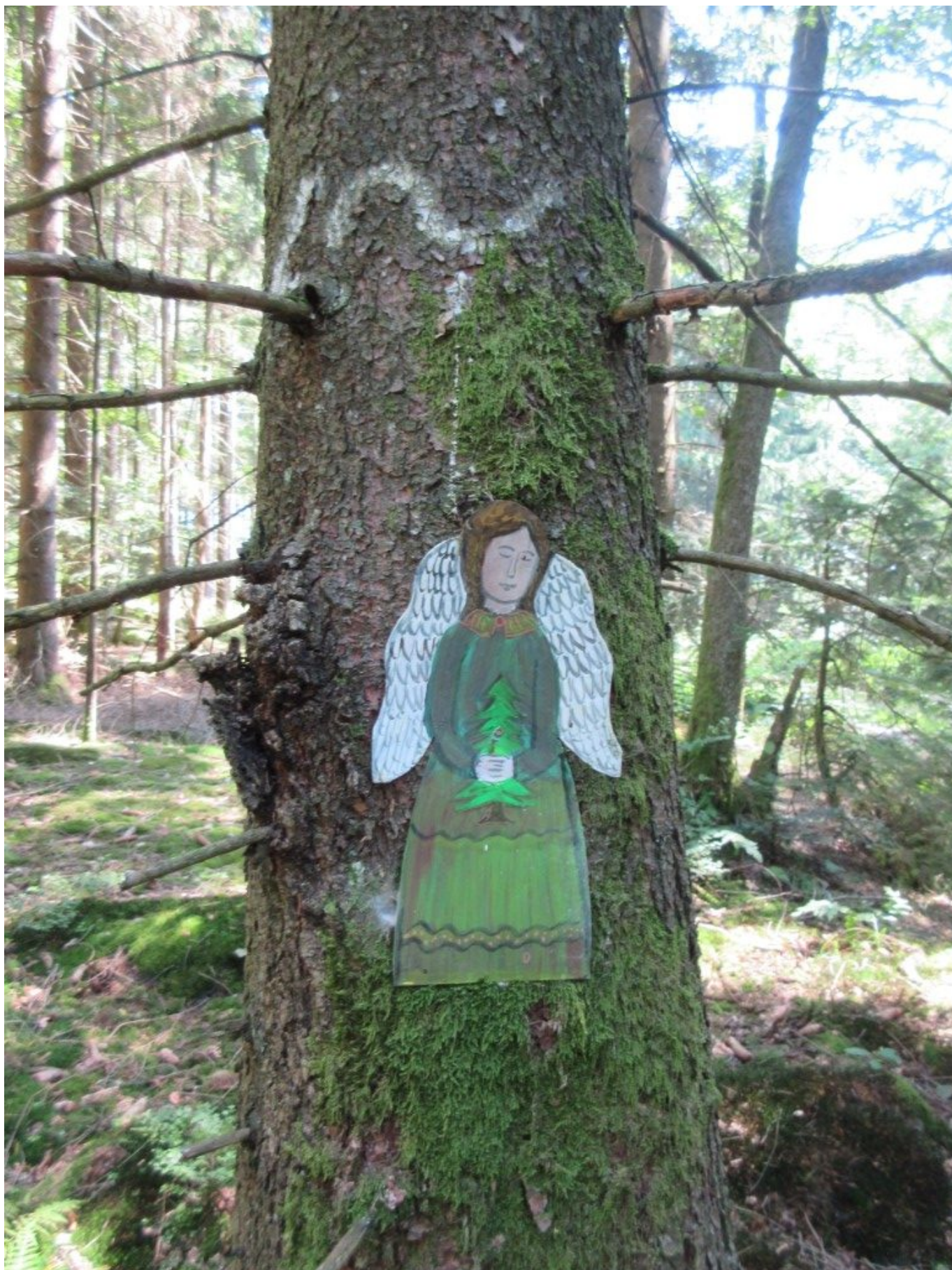
Kleiner Engel und Markierungspfeil