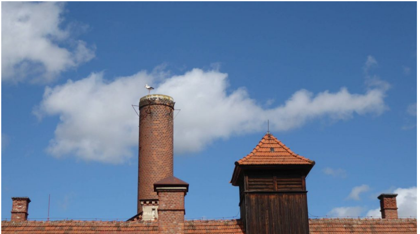
Storch auf dem Kamin der stillgelegten Brauerei in Kout na Šumavě

Von der wunderschönen Tour schicke ich hier jetzt ein paar Bilder mit Beschreibung dazu. So können Wolfgangspilgerfans gerne virtuell mit dabei sein.