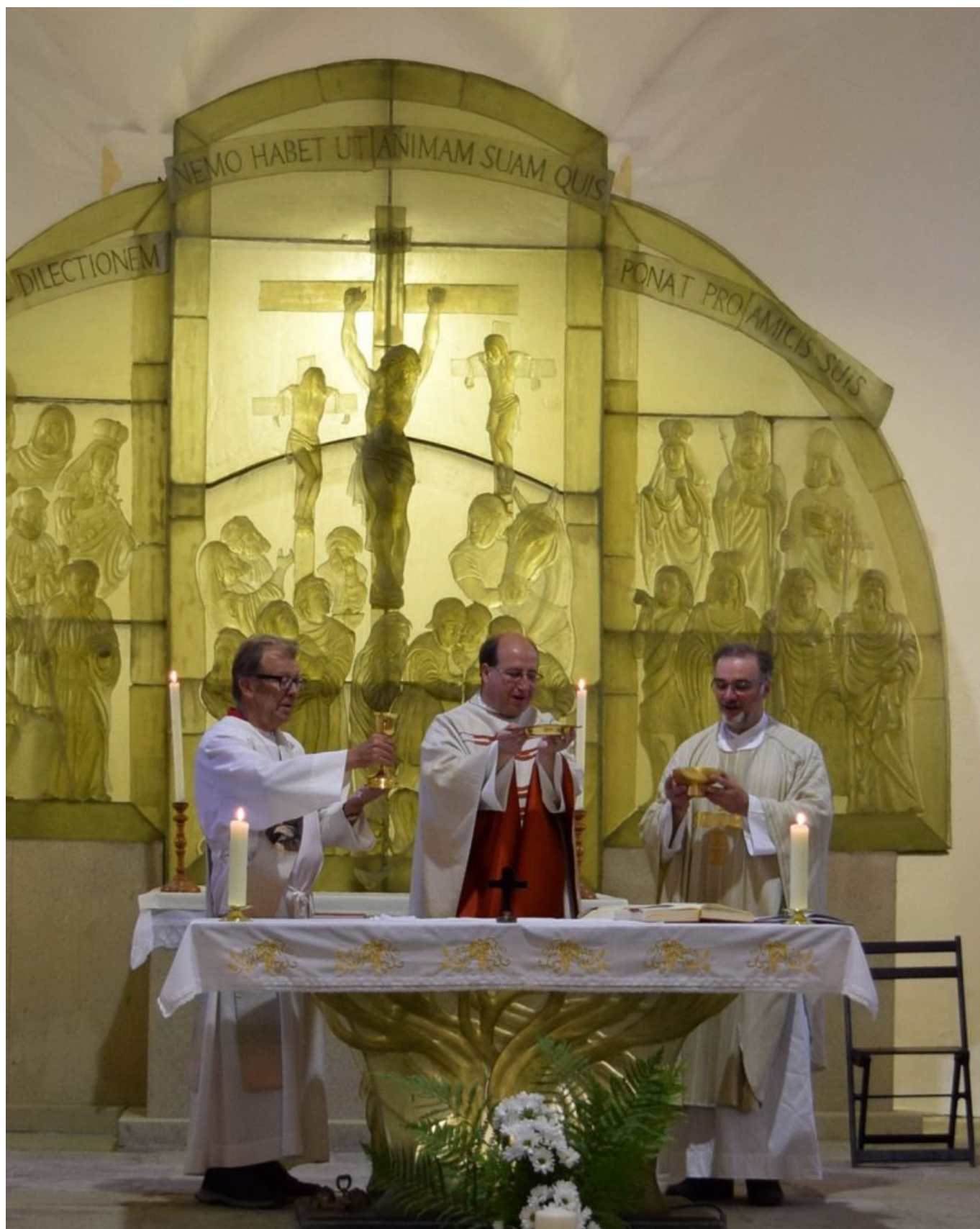
Festmesse zu Ehren des heilige Gunther in Gutwasser, Tschechien, 2022