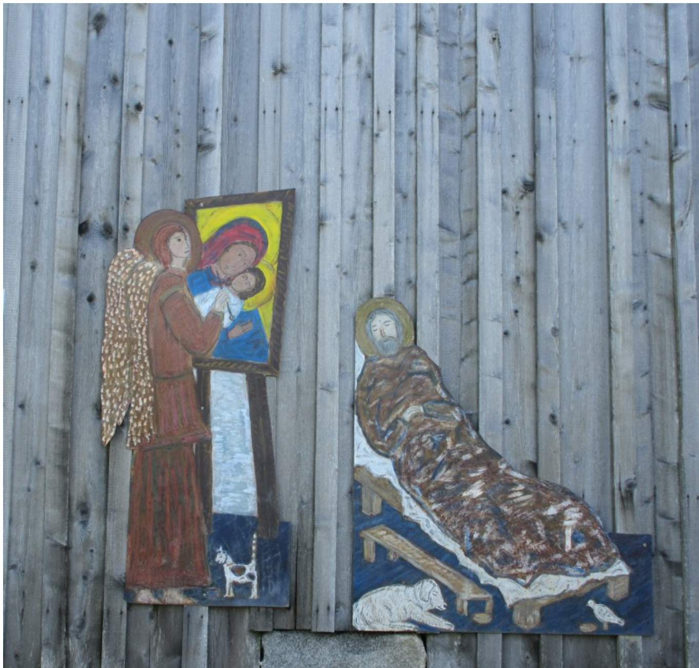
Blechgeschichte am Anwesen Hoferlbauer: „Ein Engel malt die Ikone fertig, während der Ikonenmaler Alimpij krank darnieder liegt.“