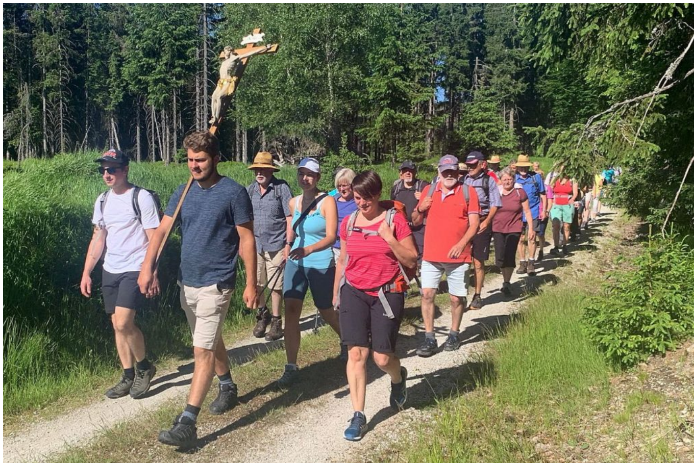
St. Gunther-Fußwallfahrer 2022