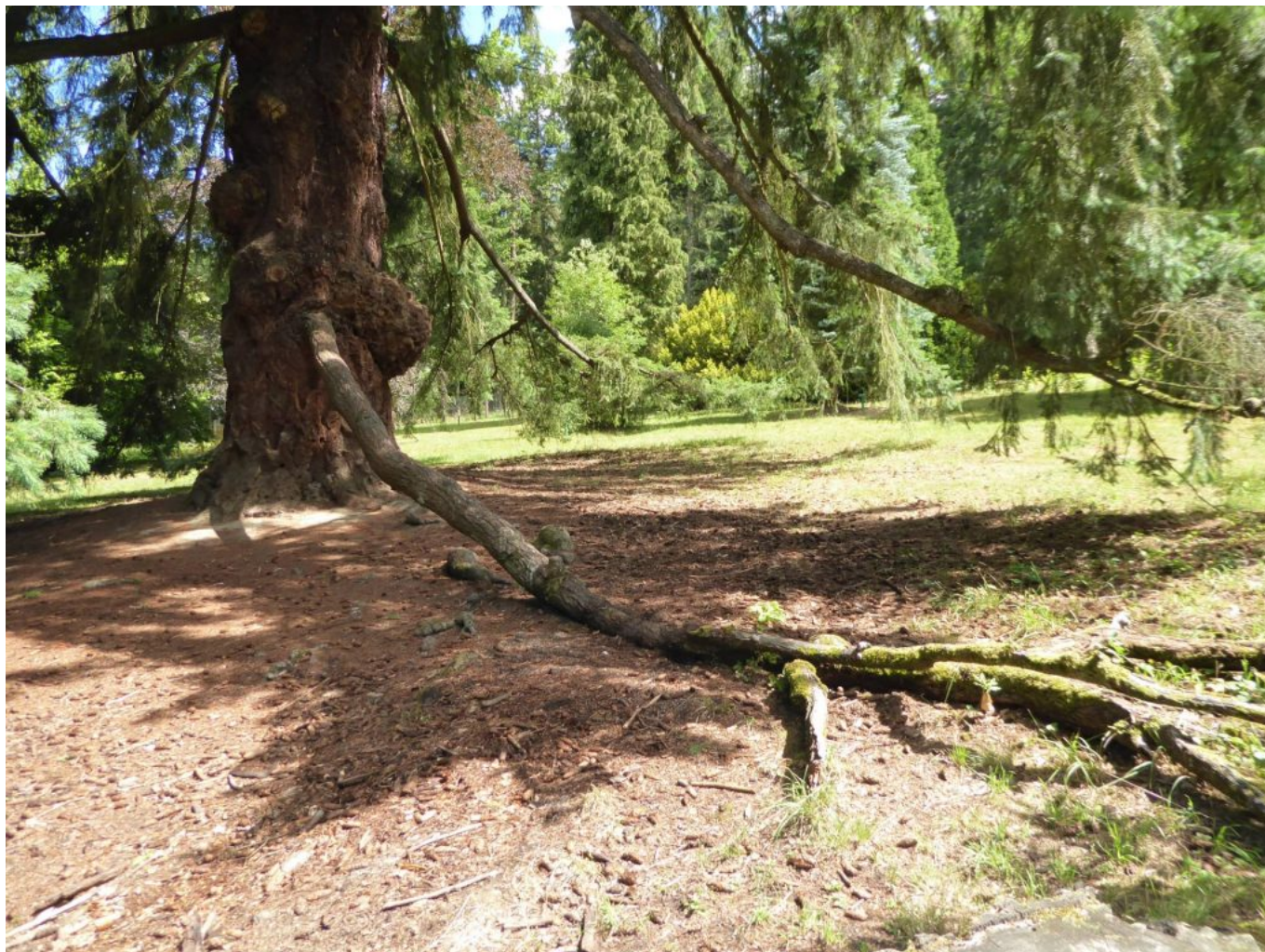
Der älteste Baum darin eine mächtige Douglasie mit ausladenden „Wurzelästen“