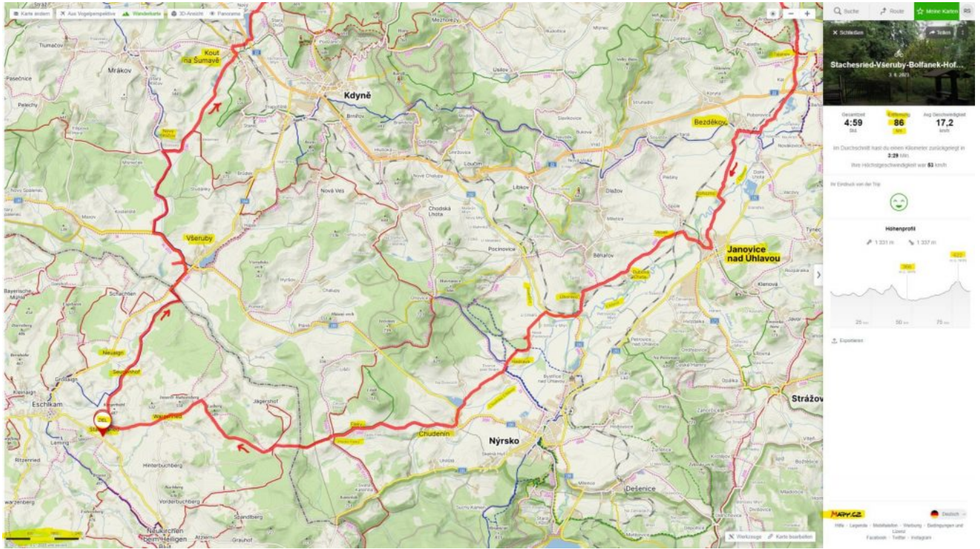
Karte Tschechien Bolfanek Süd