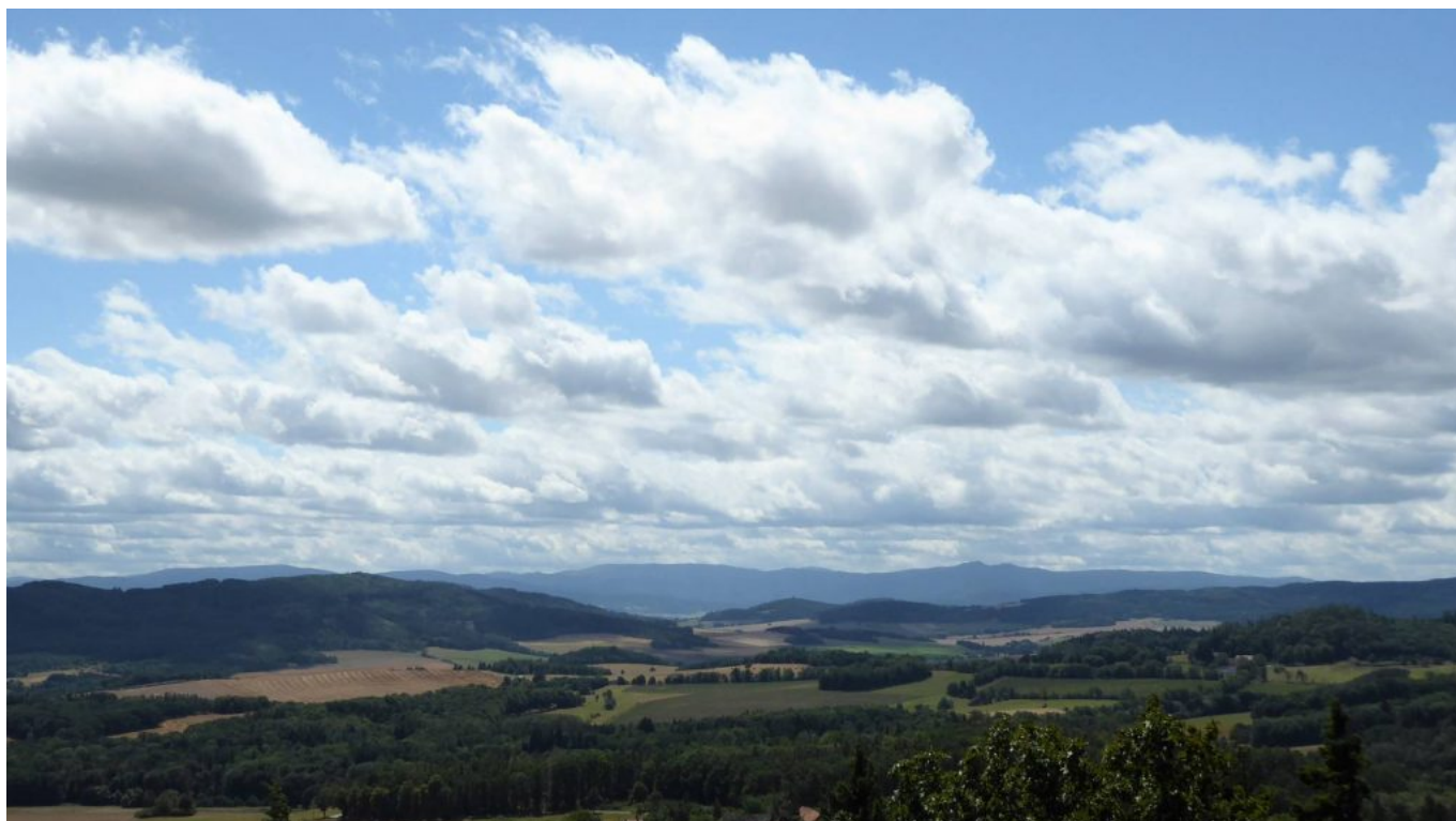
Ausblicke „real“ Richtung Bayern mit den Grenzbergen Oser im Künischen Gebirge