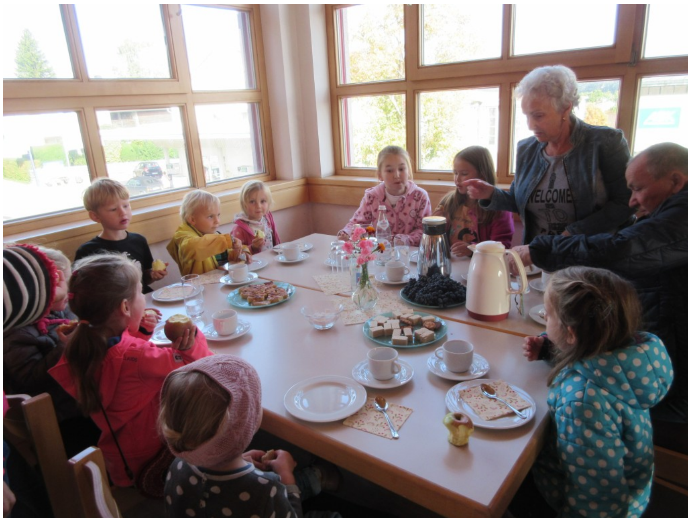
Kaffee, Tee und Kuchen im „Kirchencafé“ für Groß und Klein