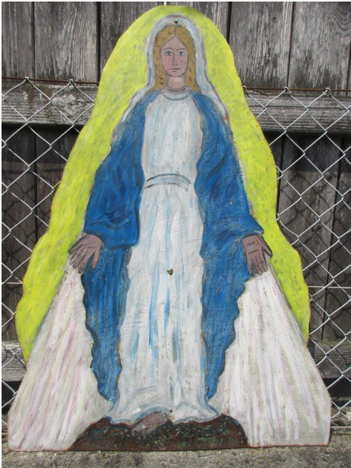
Segnende Marienfigur am Zaun