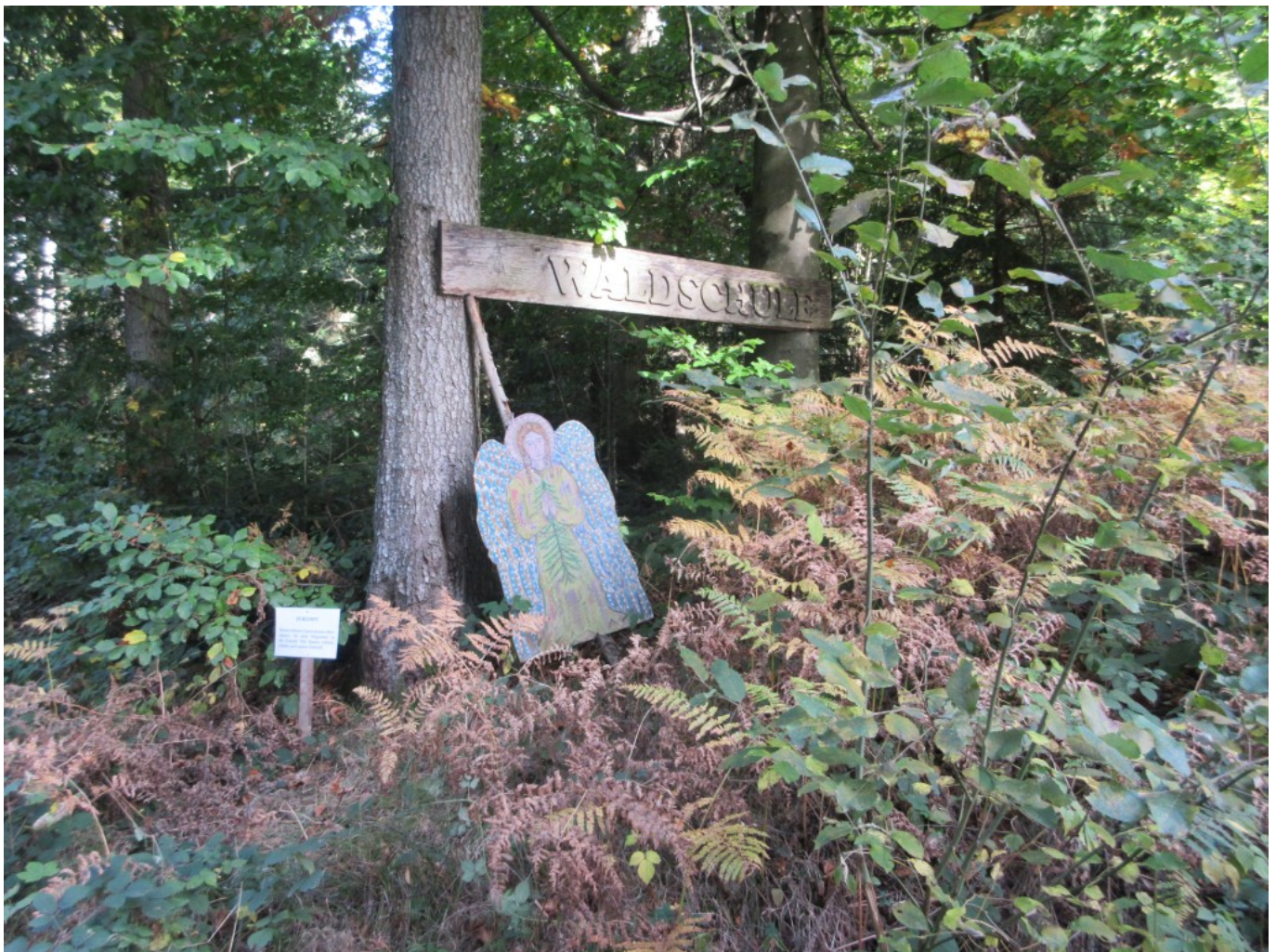
Baumschutzengel im Goldenen Oktober. „Zukunft“

Zum Dank erbauten sie 1859 die Kapelle, in welcher heute eine steinernerne Inschrift-Tafel über diese Vorgänge informiert.