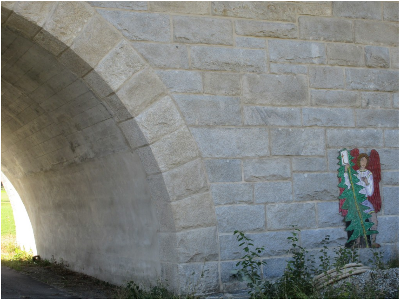
Erzengel Michael mit Tannenbaum beim Durchgang der Steinbrücke