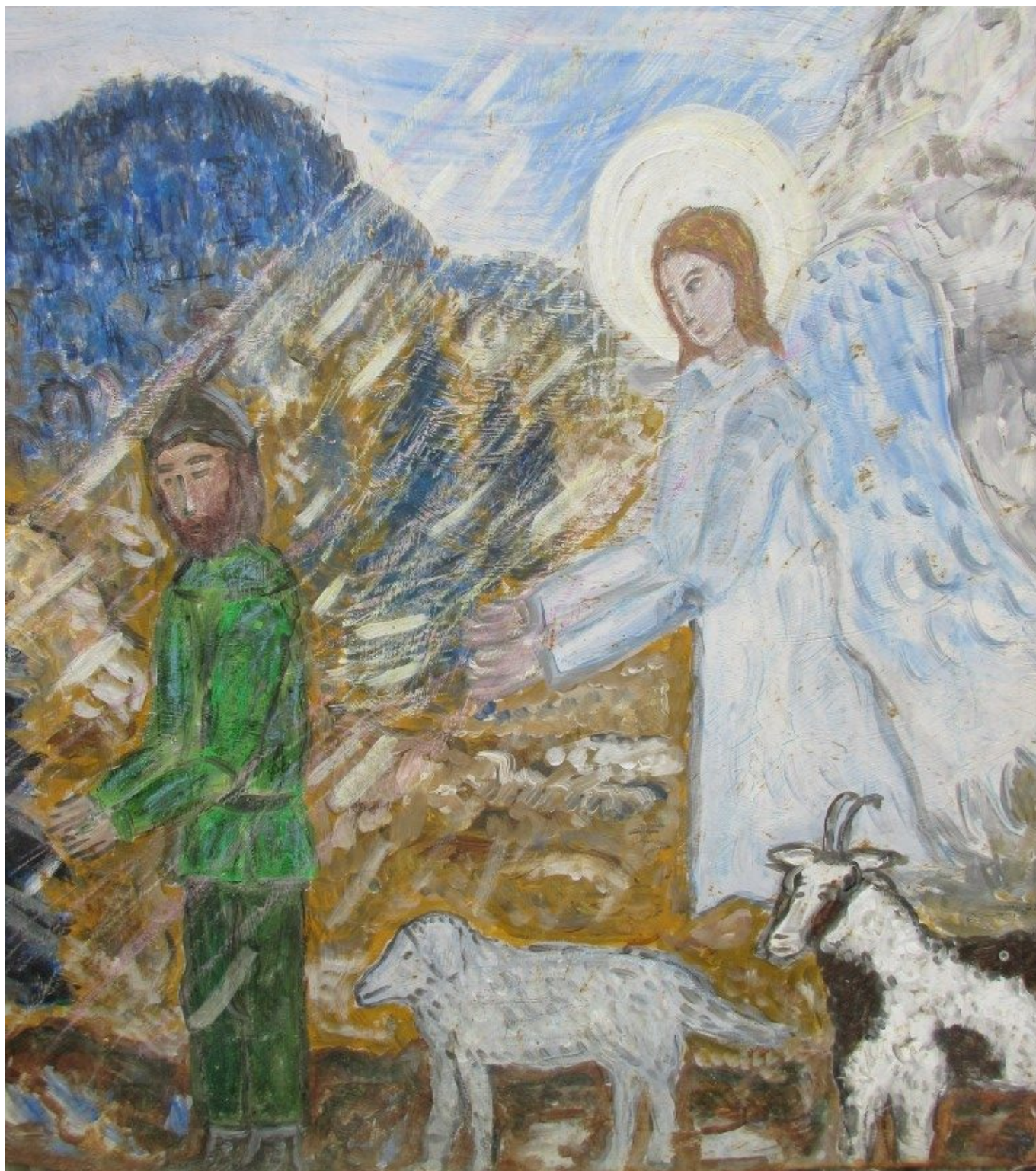
Großes Blechbild am Anwesen vom Hoferlbauern

Impuls zum großen Blechbild: „Auch wer Gott in seinem Leben nicht erkennen kann, ist vom Licht der Gnade Gottes umgeben.“ (Altpfarrer Ernst-Martin Kittelmann)