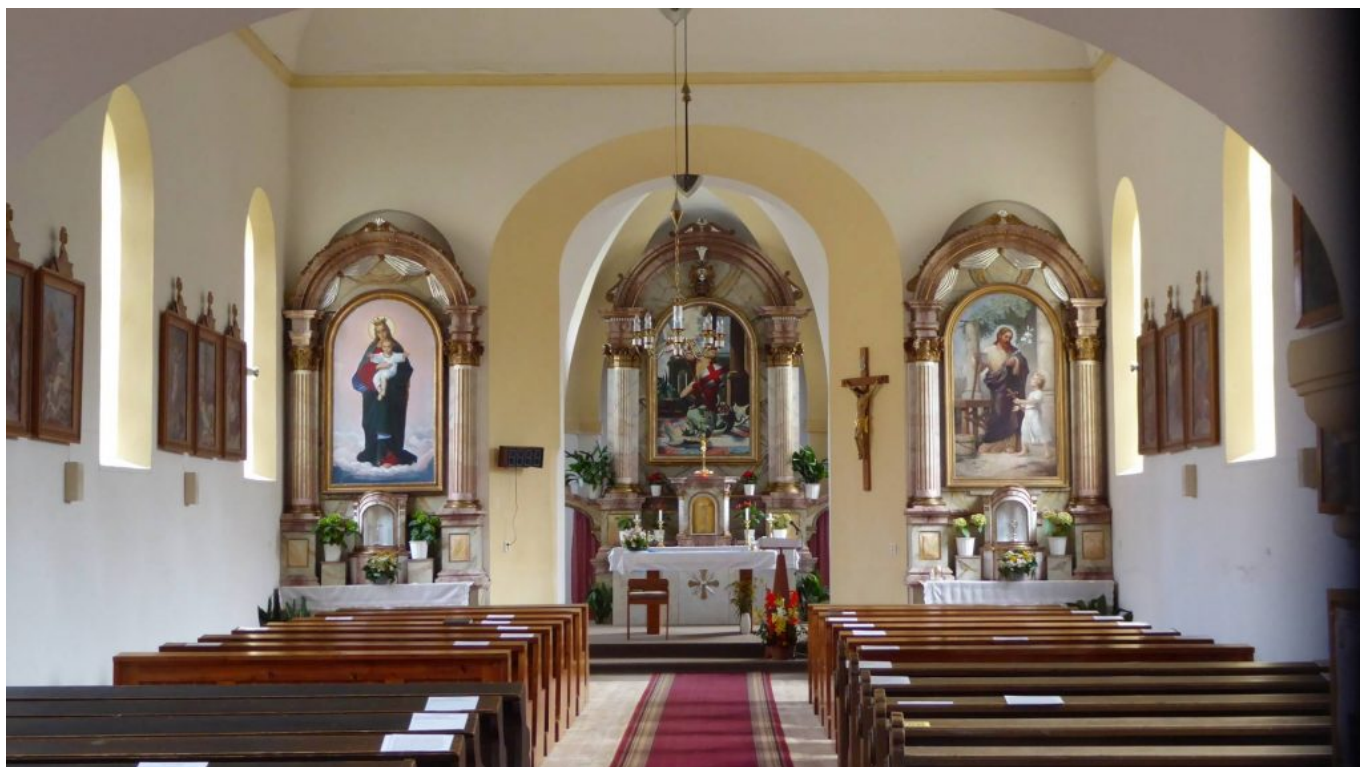
Prachtvoll renovierte Kirche Sv. Jiří mit Drachentöter St. Georg im Hauptaltar, sowie jeweils Maria und Josef mit dem Jesuskind