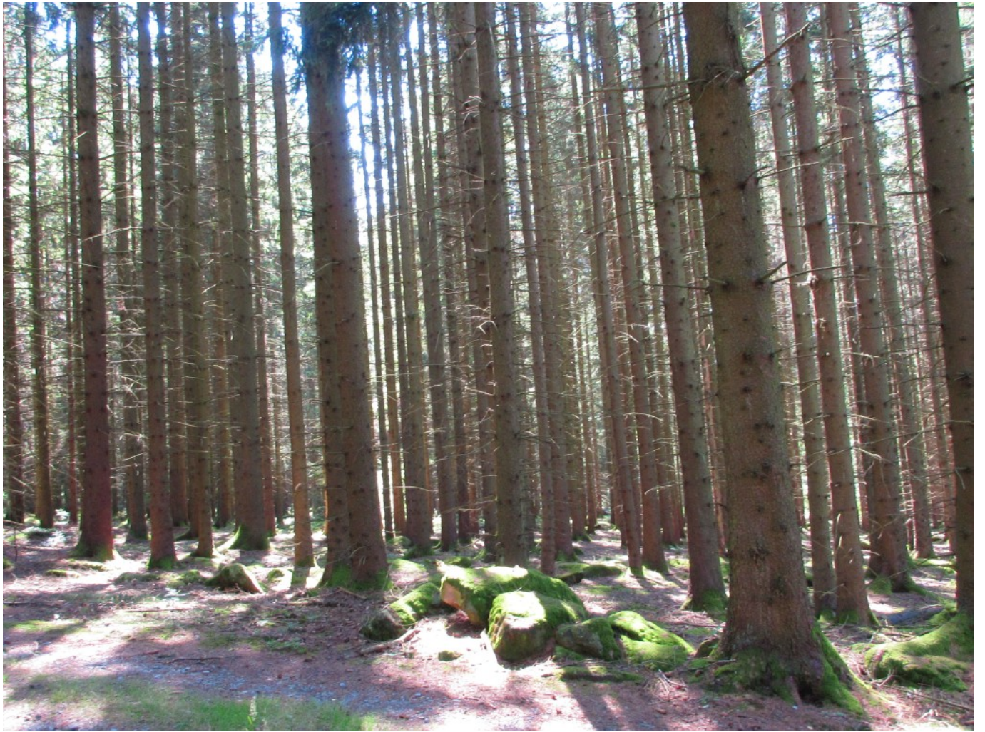
Ungesunde Fichten-Monokultur im Wald neben dem Baumschutzengel-Wald