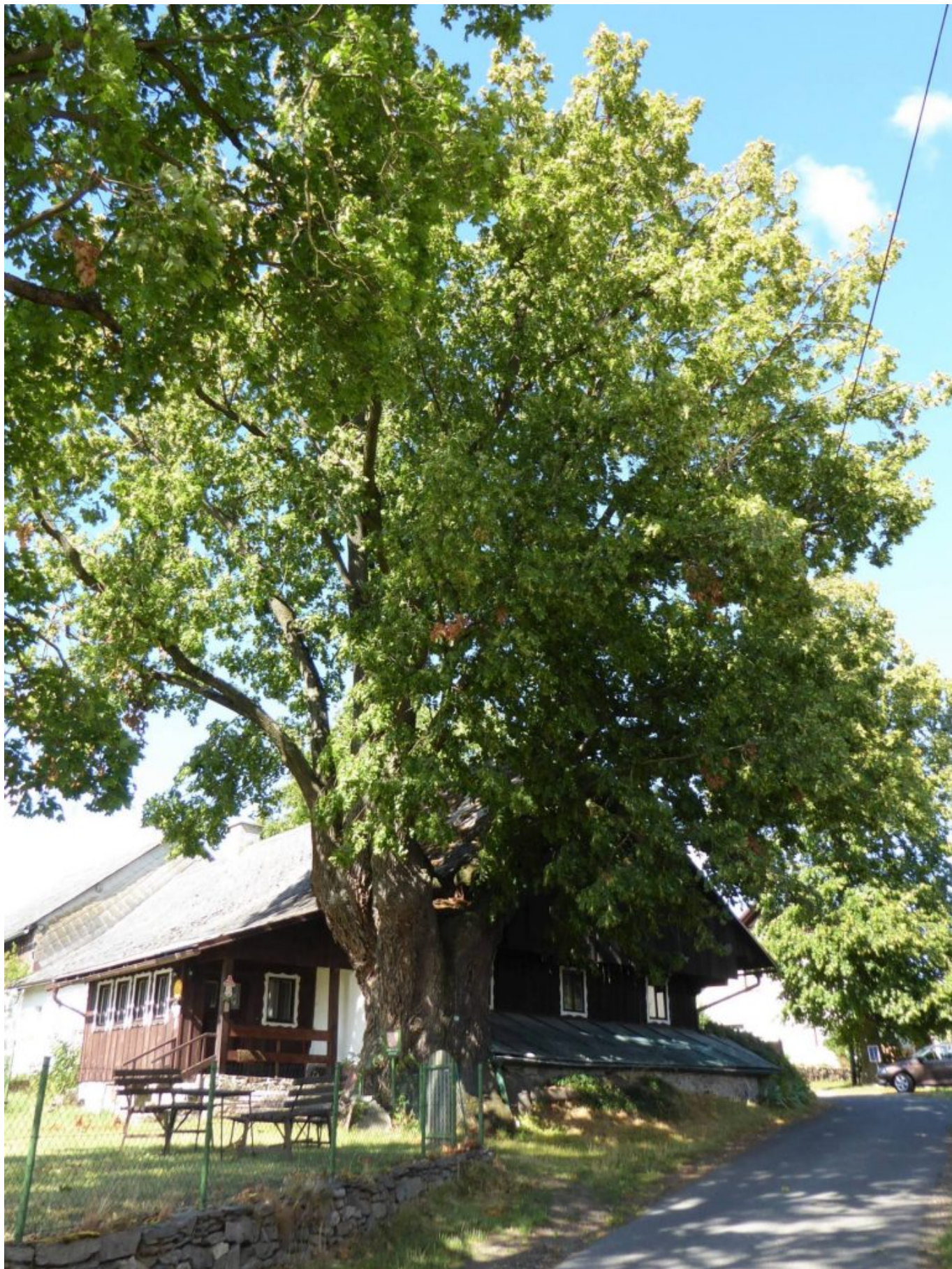
Mächtiges Baumdenkmal Linde direkt an Böhmerwaldhaus in Hadrawa – eine baumdicke Wurzel wächst entlang der Kellermauer