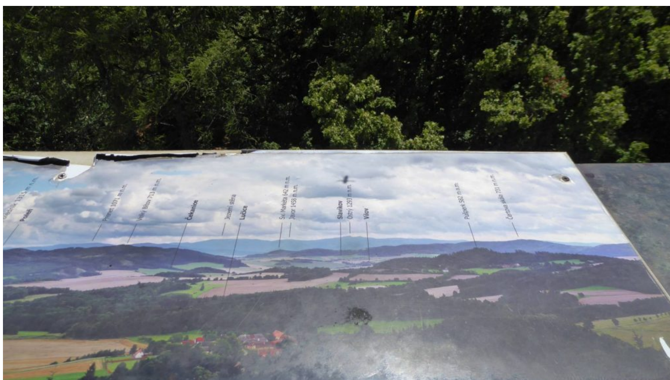
Ausblicke auf Sichtkarte Richtung Bayern mit den Grenzbergen Osser im Künischen Gebirge