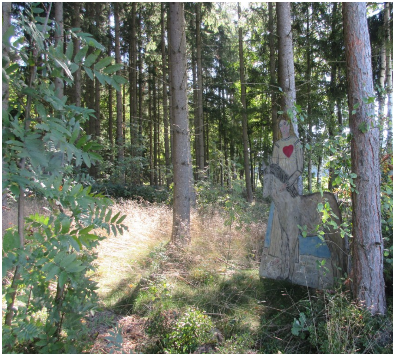
Mitten im Waldeslicht finden wir den Herzens-Engel mit Esel.