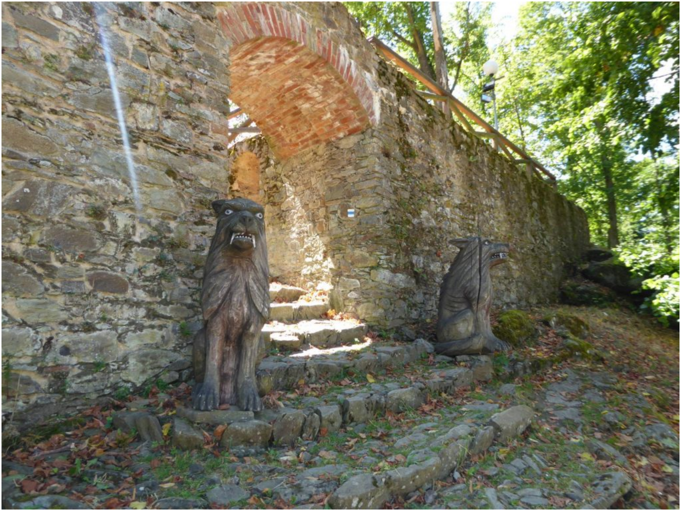
Aufgang „selbstverständlich“ von Wölfen bewacht