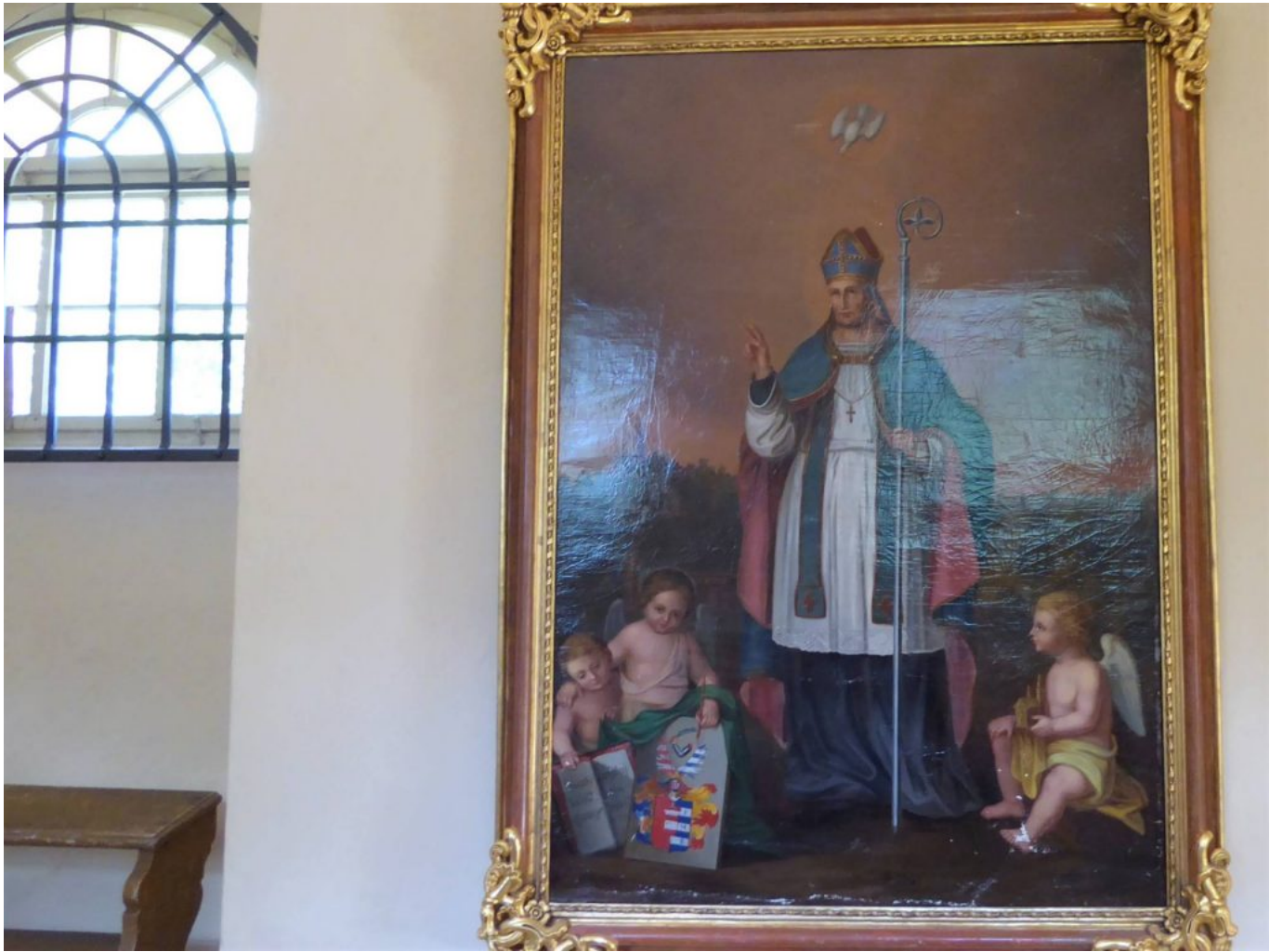
St. Wolfgang mit Heiliger Geist Taube und Engeln, die Wappen und „Wolfgangskirche“ halten