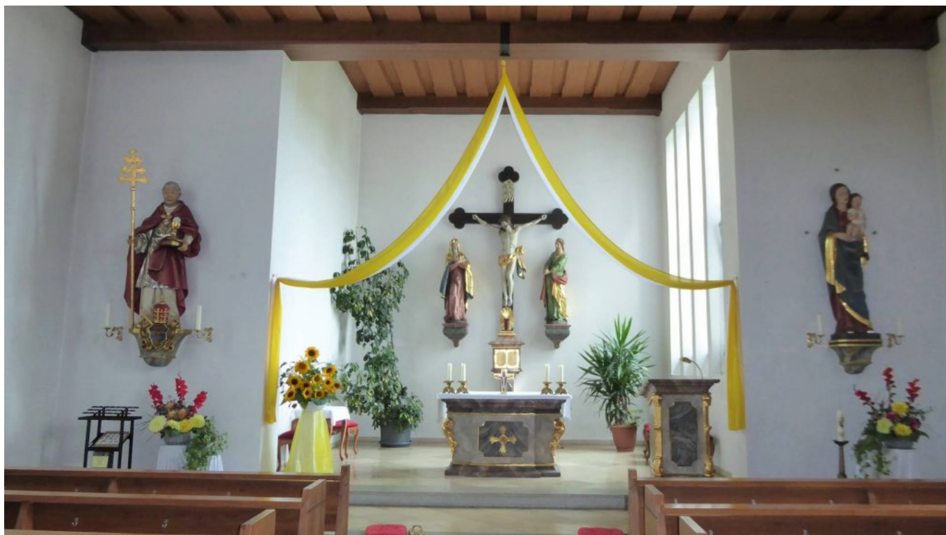
Das Innere der Kirche zeigt unter anderem St.Pius X.