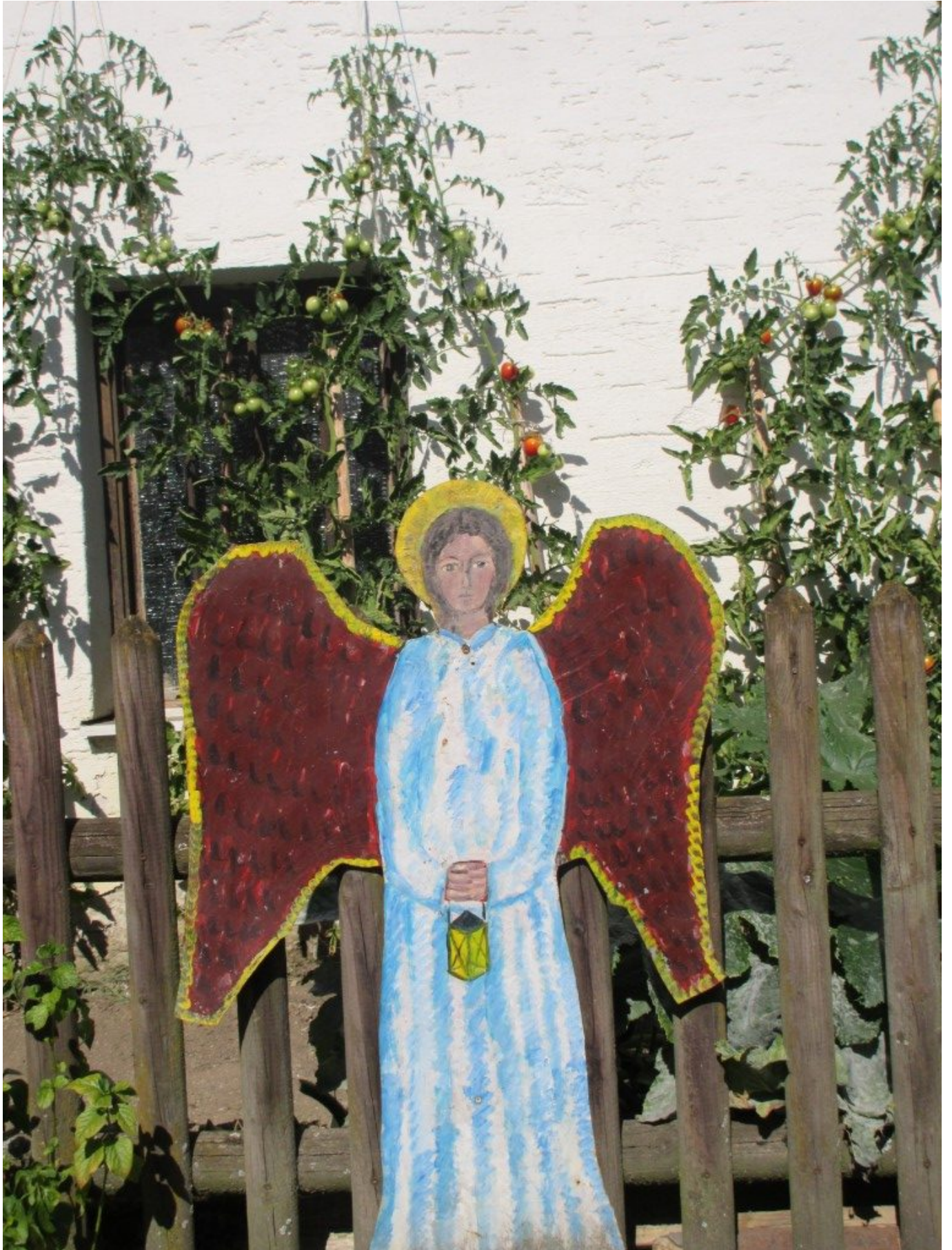
Engel am Zaun vor Tomatenstauden