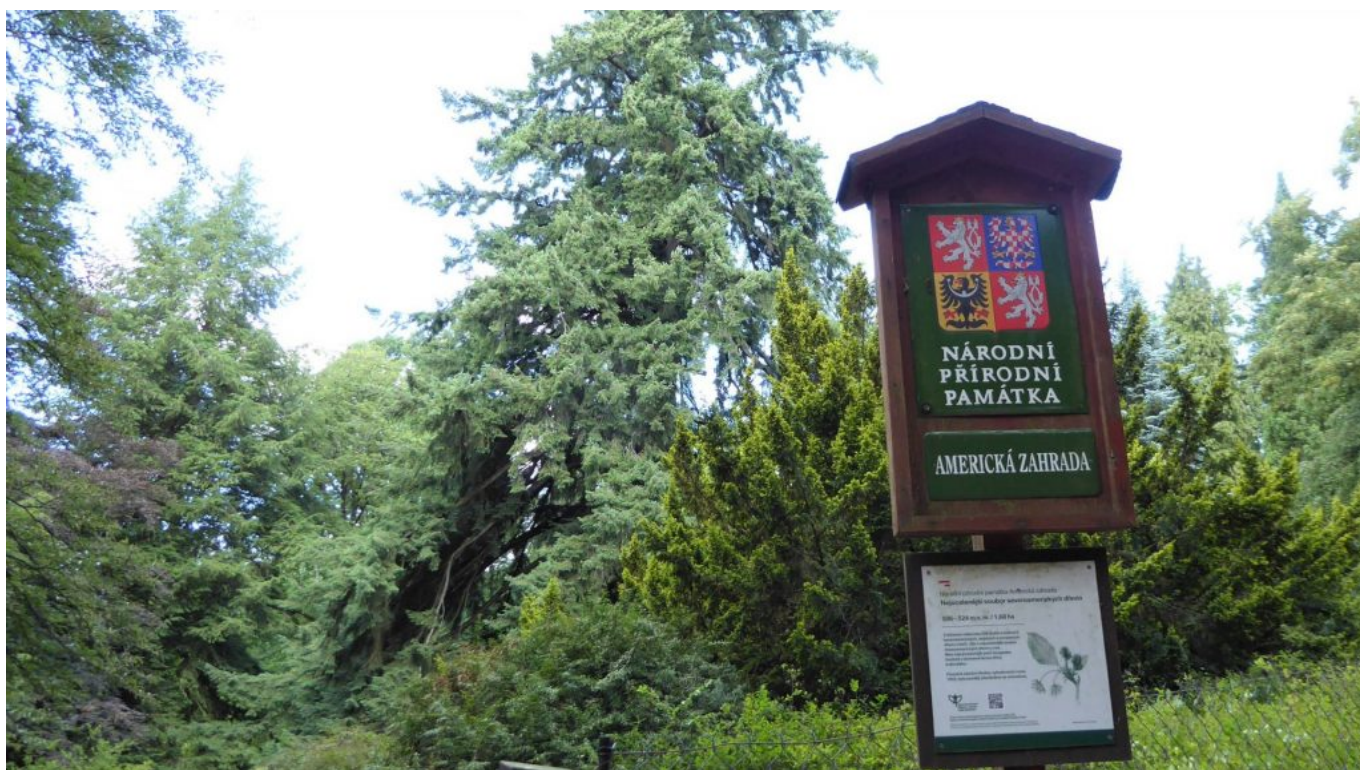
Nationales Naturdenkmal „Amerikanischer Garten“ Nähe Bolfánek bei Chudenice