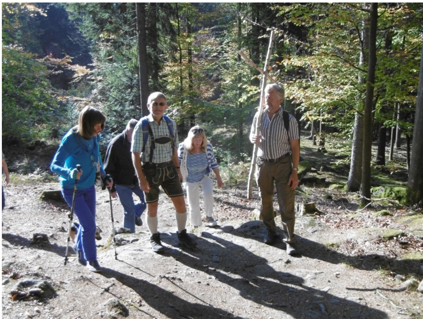
Aufstieg zur Wolfgangskapelle

Zu einer geführten Wanderung auf dem Wolfgangsweg lädt die Urlauber-Region Viechtacher Land am kommenden Mittwoch, 13. September 2023, ein.