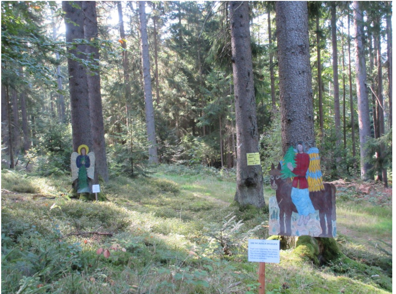
Lebensgroße Engel und spirituelle Impulse führen durch den gesunden Mischwald mit verschiedenen Baumgenerationen