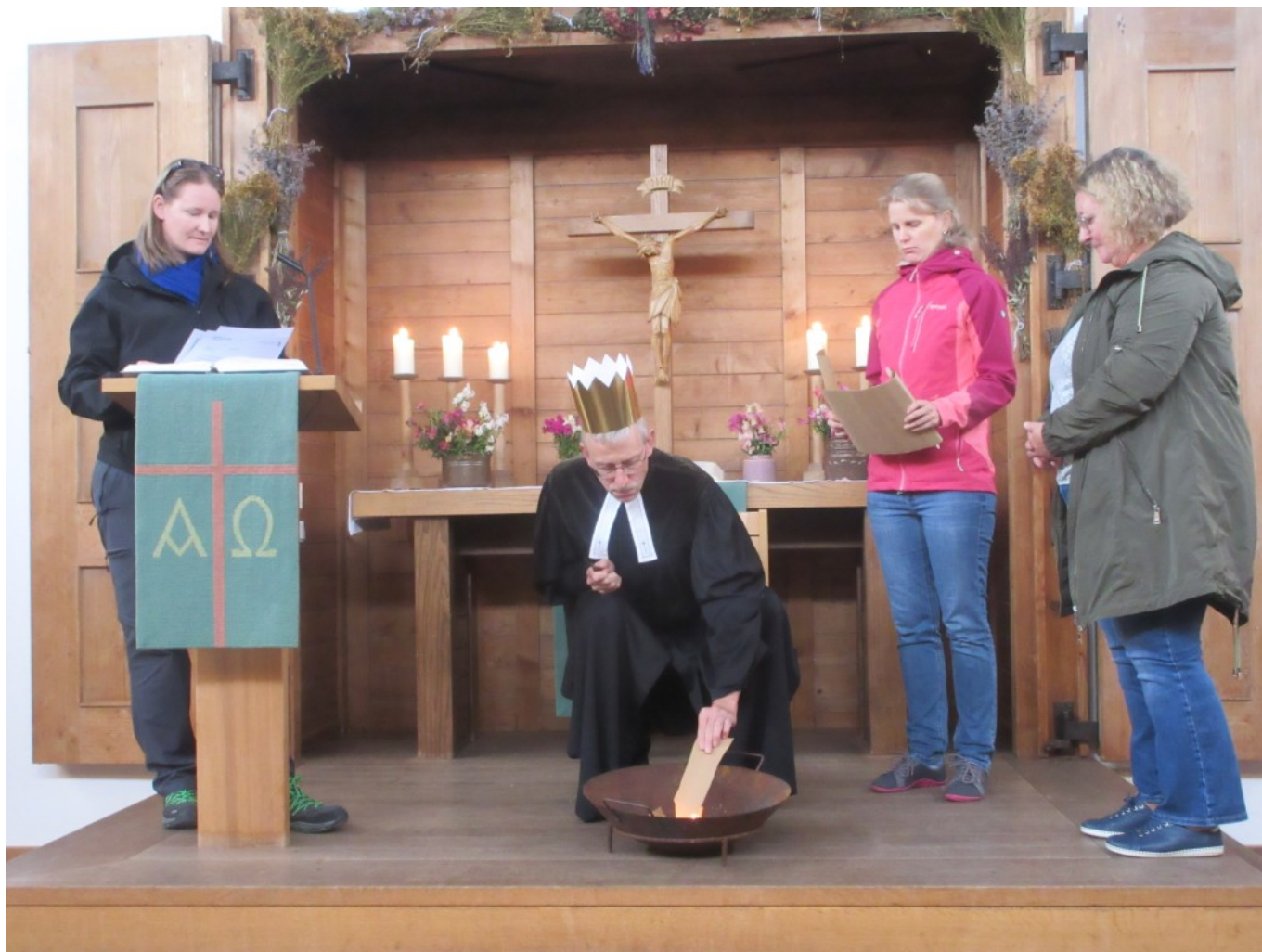
Ins Feuer damit!