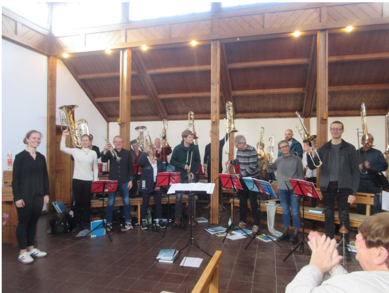
Begeisterter Beifall am Ende der Matinee

Eine wichtige Botschaft – Familiengottesdienst in der Christuskirche Viechtach