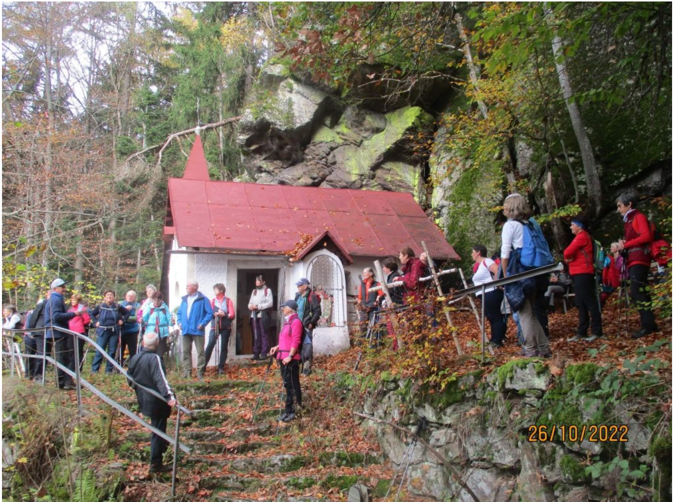
Pilgergruppe bei der sagenumwobenen Wolfgangskapelle