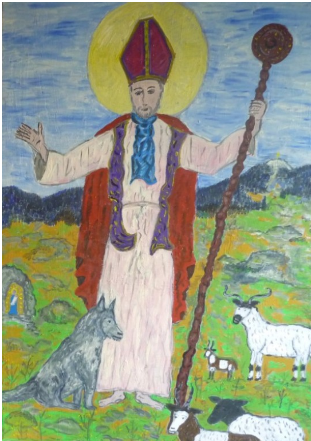
Der Heilige Wolfgang mit den Tieren, Gemälde in Acryl auf Blech, lebensgroß