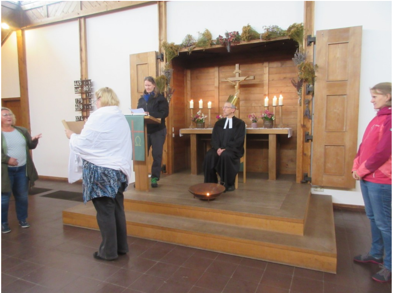
Die Übermittlung der Gottesbotschaft (Anspiel)