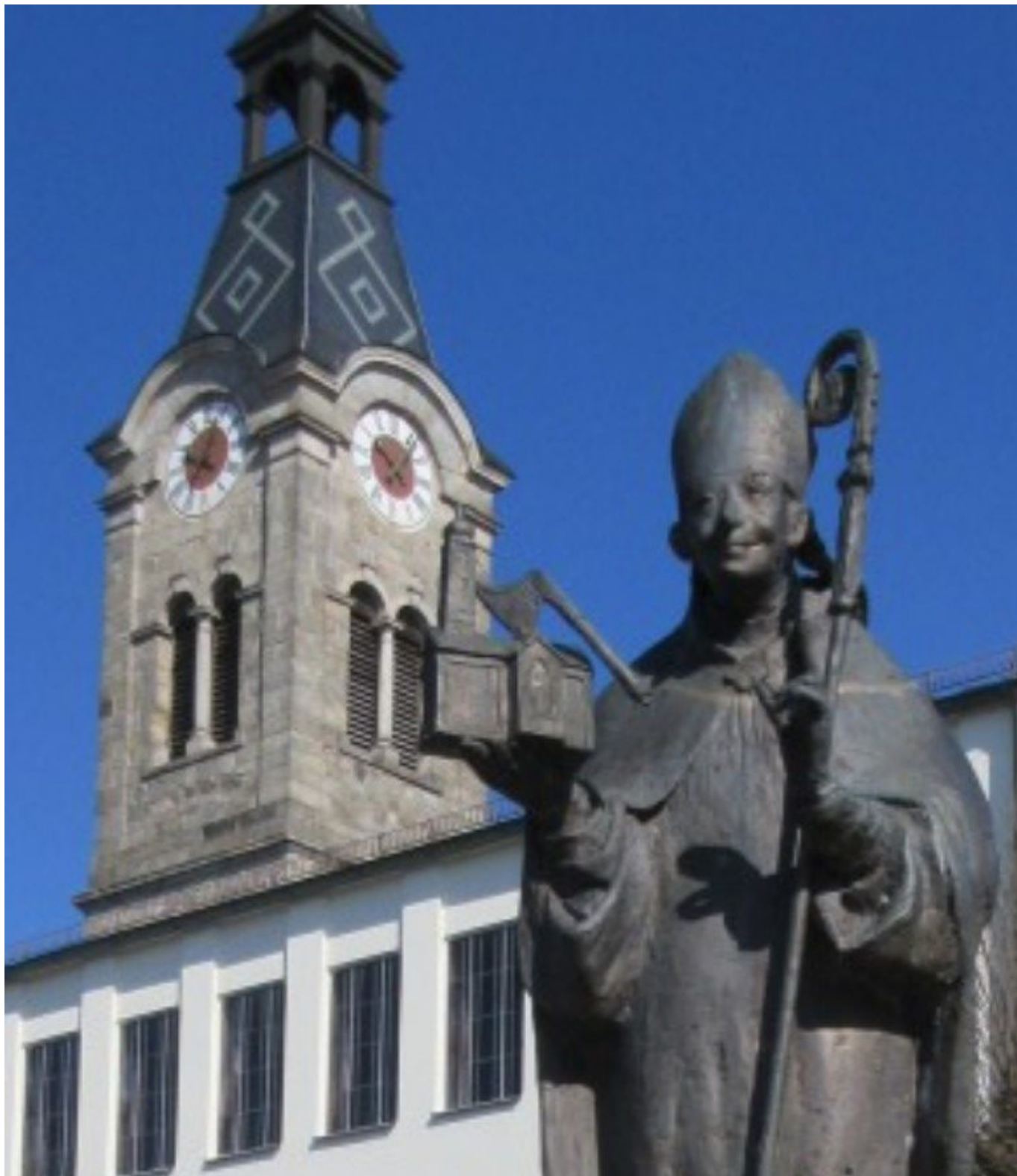
Wolgangsfigur am Wolgangsbrunnen bei der Ortskirche St. Nikolaus in Böbrach