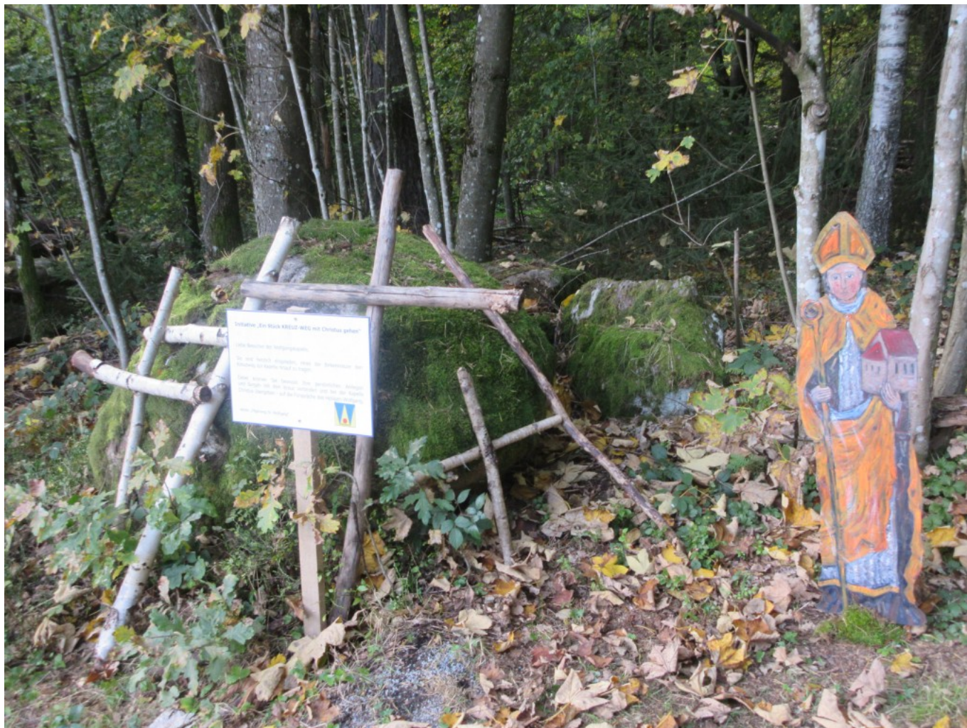
Kreuze aus Holz laden die Pilger ein, sie mit einem Anliegen hinauf zur Wolfgagkapekle zu tragen. „Den Weg mit Christus gehen.“