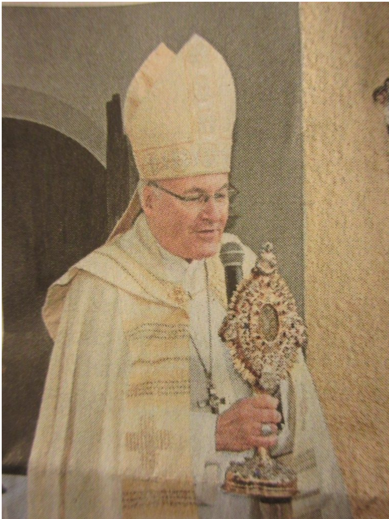
Vor der Kapelle auf der Frath spendete der Bischof den Segen mit der Wolfgangsreliquie.