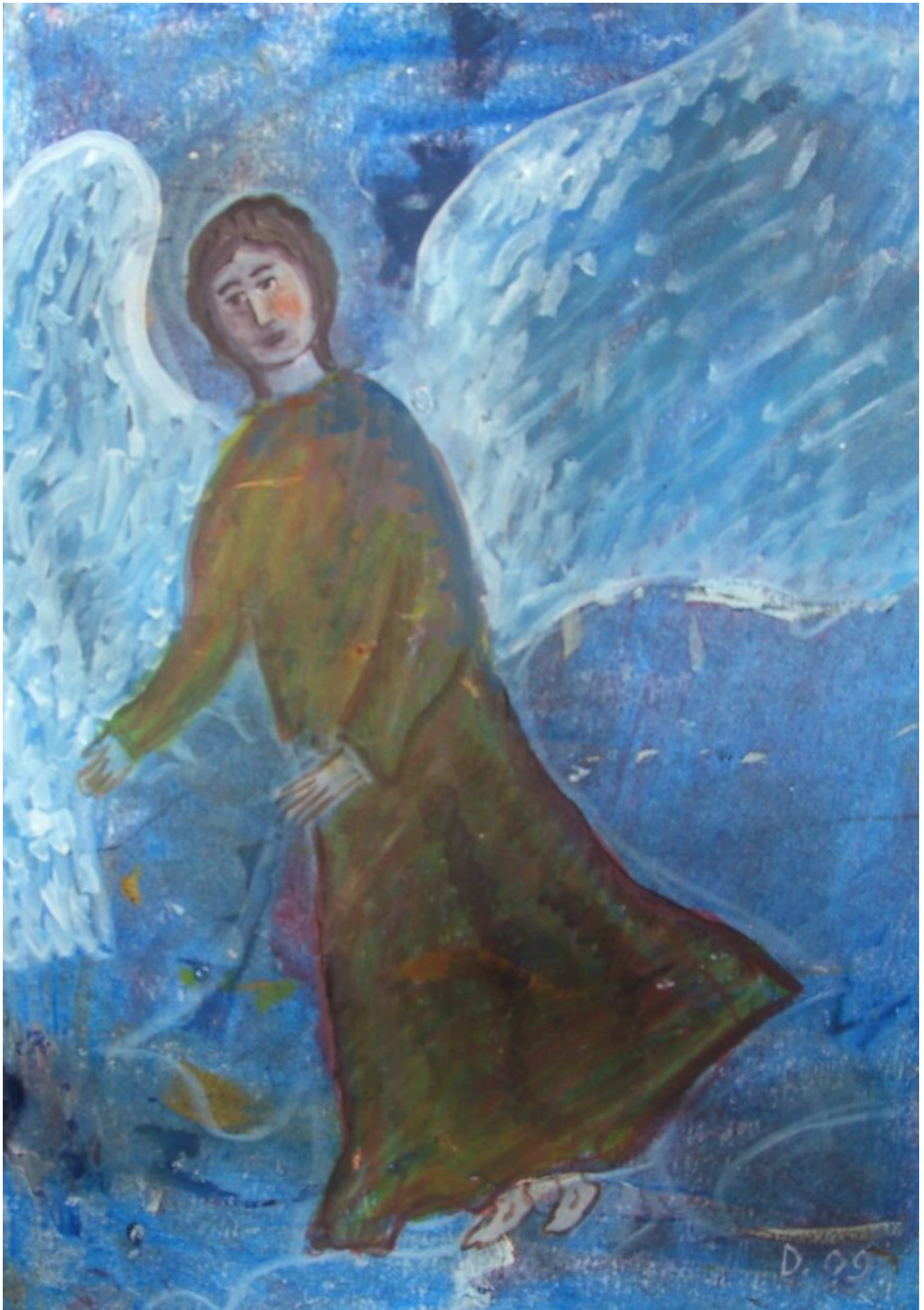
Engel in der Nacht. 30/40 cm, Acryl, Öl (Gemälde von Dorothea)