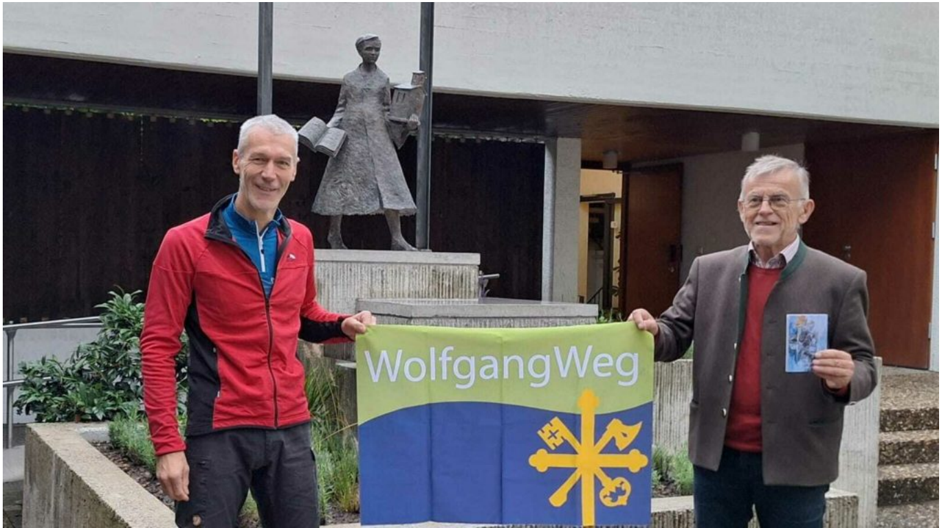
St. Wolfgang und Pfullingen verbinden sich