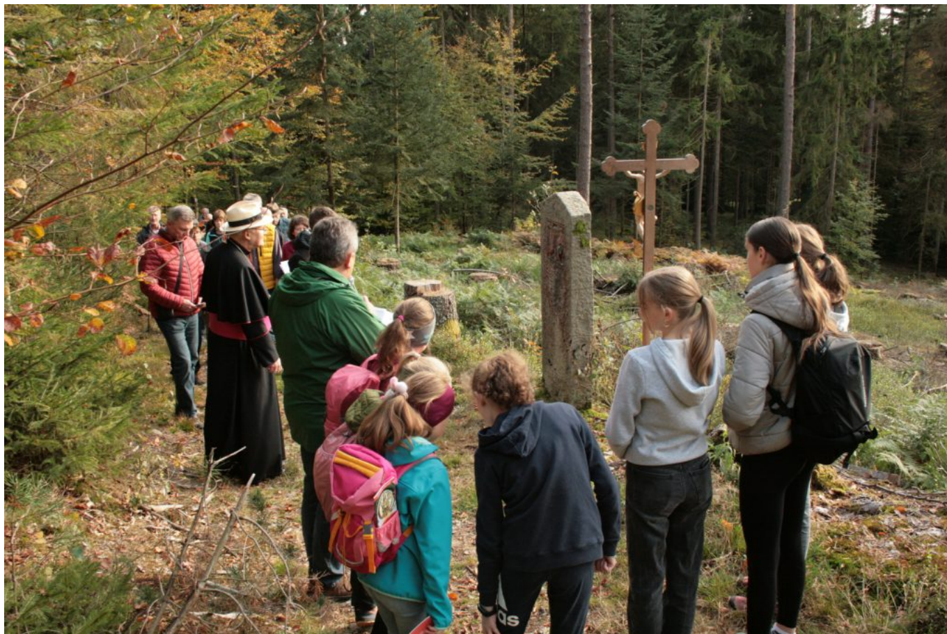
Unterwegs auf dem Kreuzweg zur Wolfgangskapelle – Foto: Josef Arweck

Jesu gedacht. In der Wolfgangskapelle selbst verweilte der Bischof kurz zu Gebet und Betrachtung.