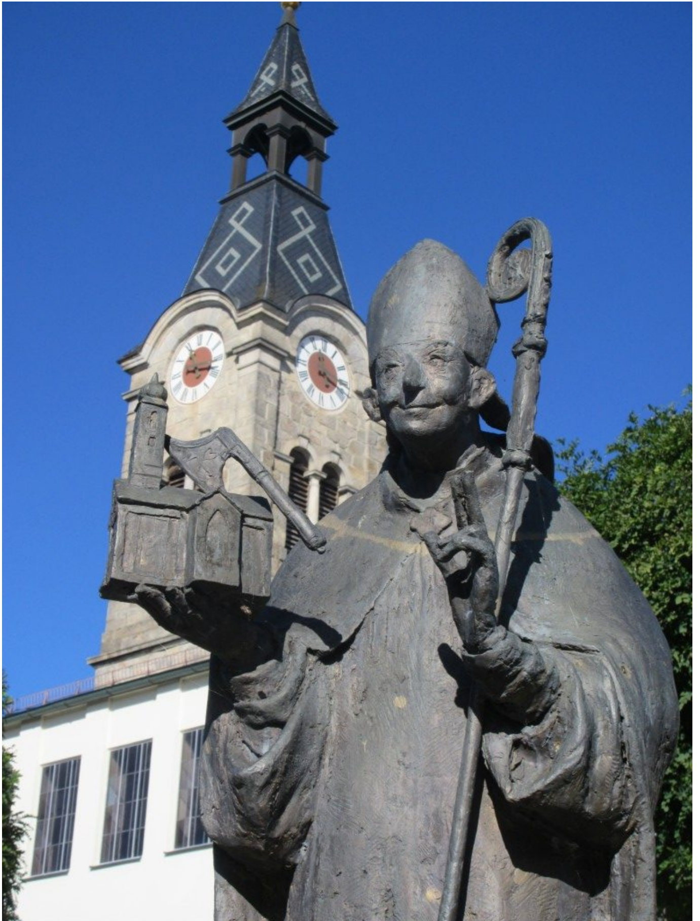
Bronzefigur des Heiligen Wolfgang bei der Pfarrkirche St. Nikolaus in Böbrach