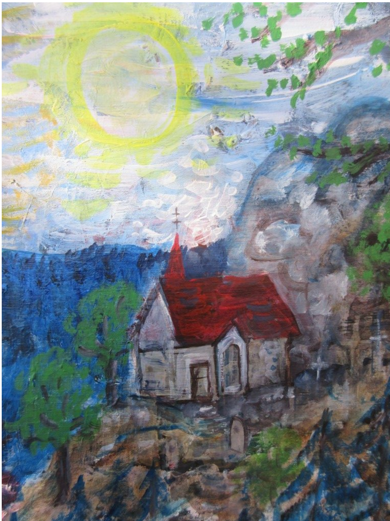
Gemälde der Wolfgangskapelle von Dorothea Stuffer (Detail )