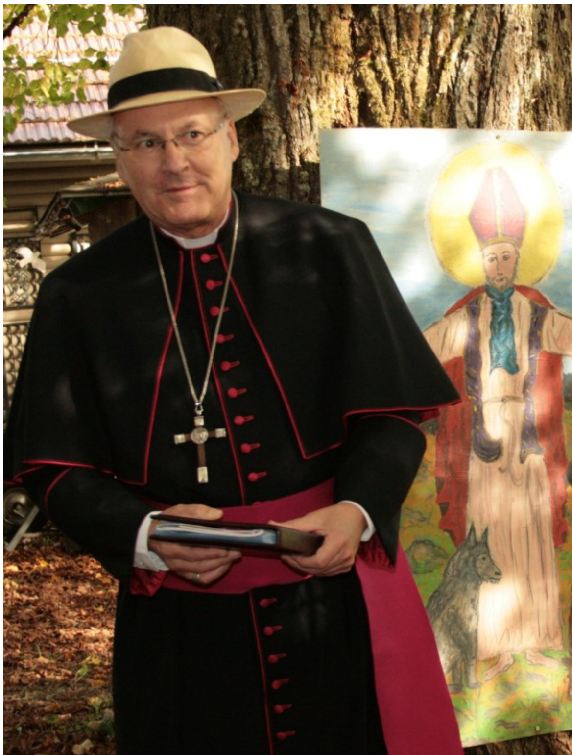
Bischof Voderholzer und Gemälde Bischof Wolfgang

Nach einem kurzen Gebet zog die Pilgerschar betend, singend, zeitweise auch schweigend hinauf zur Wolfgangskapelle. An mehreren Stellen wurden neben Gebeten und Fürbitten die einzelnen Lebensabschnitte des Heiligen Wolfgang betrachtet, so sein Leben als Lehrer, als Mönch und Priester, als Bischof, Hirte und Heiliger. An den Kreuzwegstationen, die den steilen Weg hinauf zur Kapelle säumen, wurde des Leidens und Sterbens