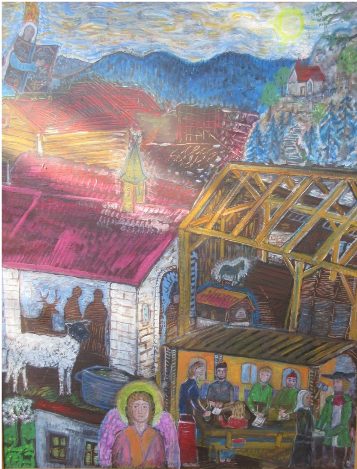
Die Entstehung des Wolfgangsweges, großes Gemälde von Dorothea Stuffer auf Holzplatte