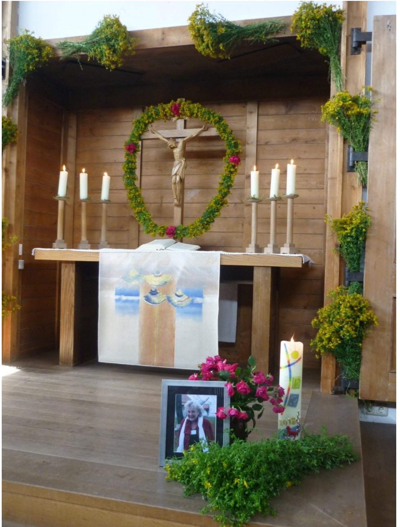
Vor und unter dem „Tor zum himmlischen Kranz“ aus dem als Heilpflanze bekannten Johanniskraut mit roten Rosen fand am