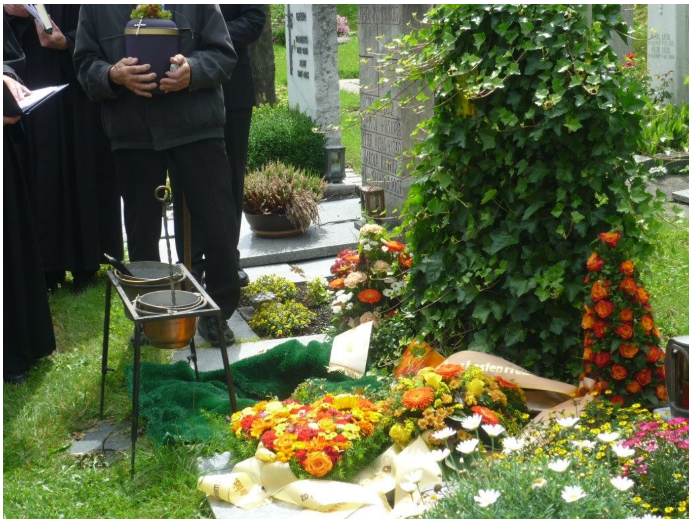
Am Grab – Urne und goldenes, feuriges Herz