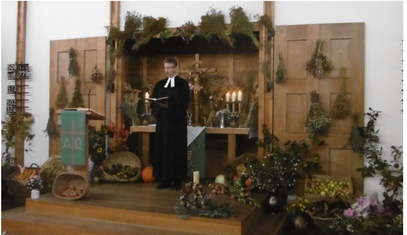
Der Altar ist auch dieses Jahr wieder reichlich geschmückt.