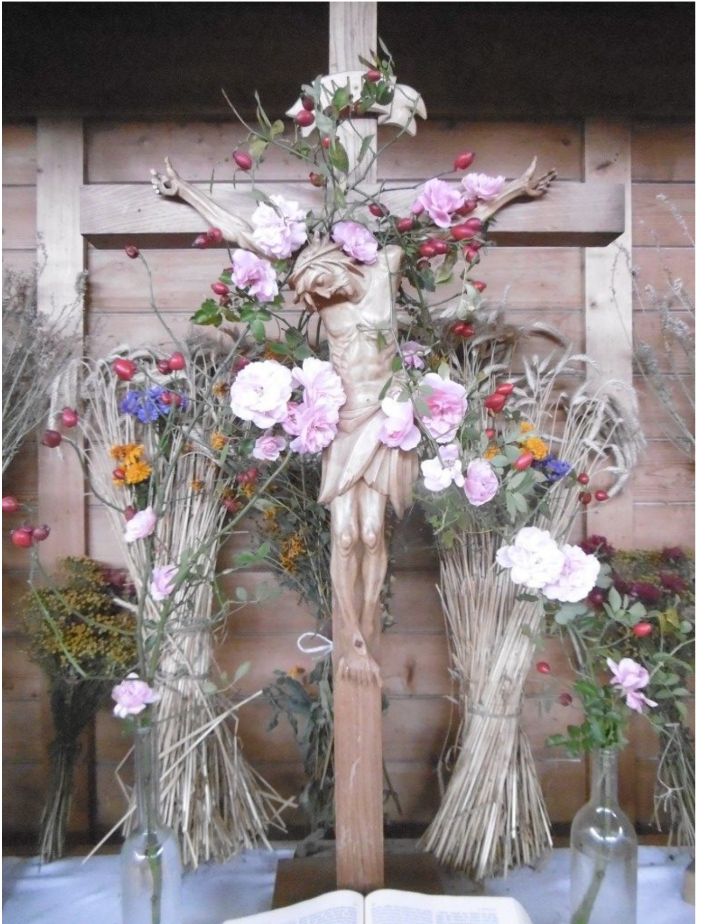
Christusfigur in einem Rosen-Hagebuttengewölbe mit Weizenähren