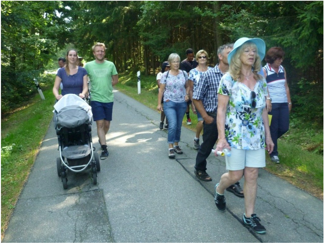
Angenehm durchs kühle Waldstück wandern