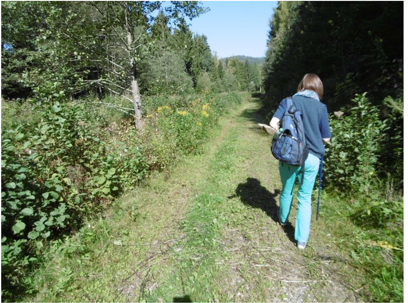
Der Weg verläuft eben dahin