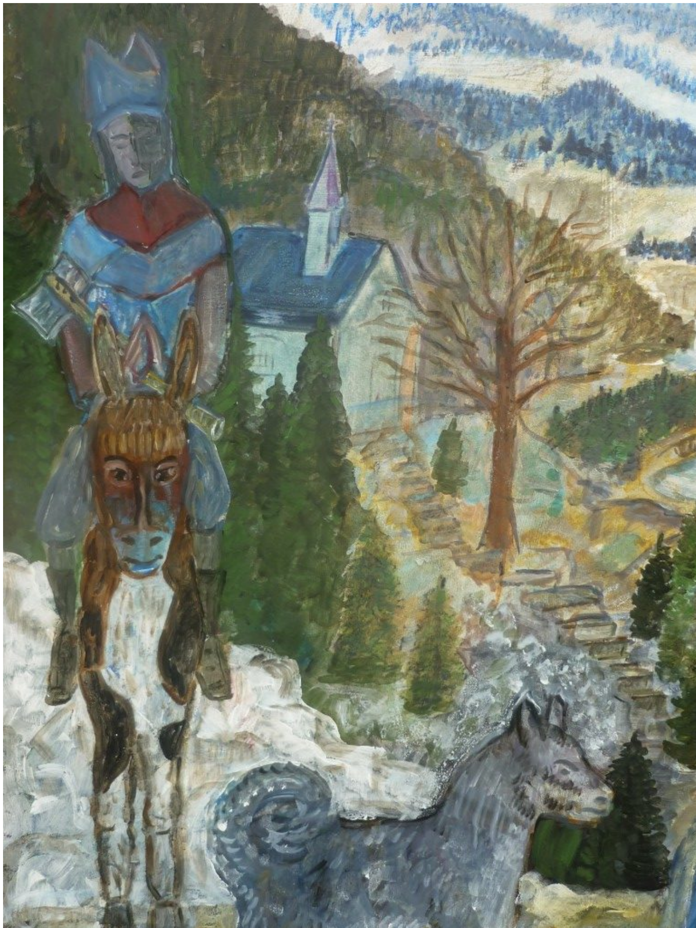
Unterwegs nach Böhmen – als Begleiter ein Wolf oder Wolfspitz – im Hintergrund die Wolfgangskapelle bei Böbrach