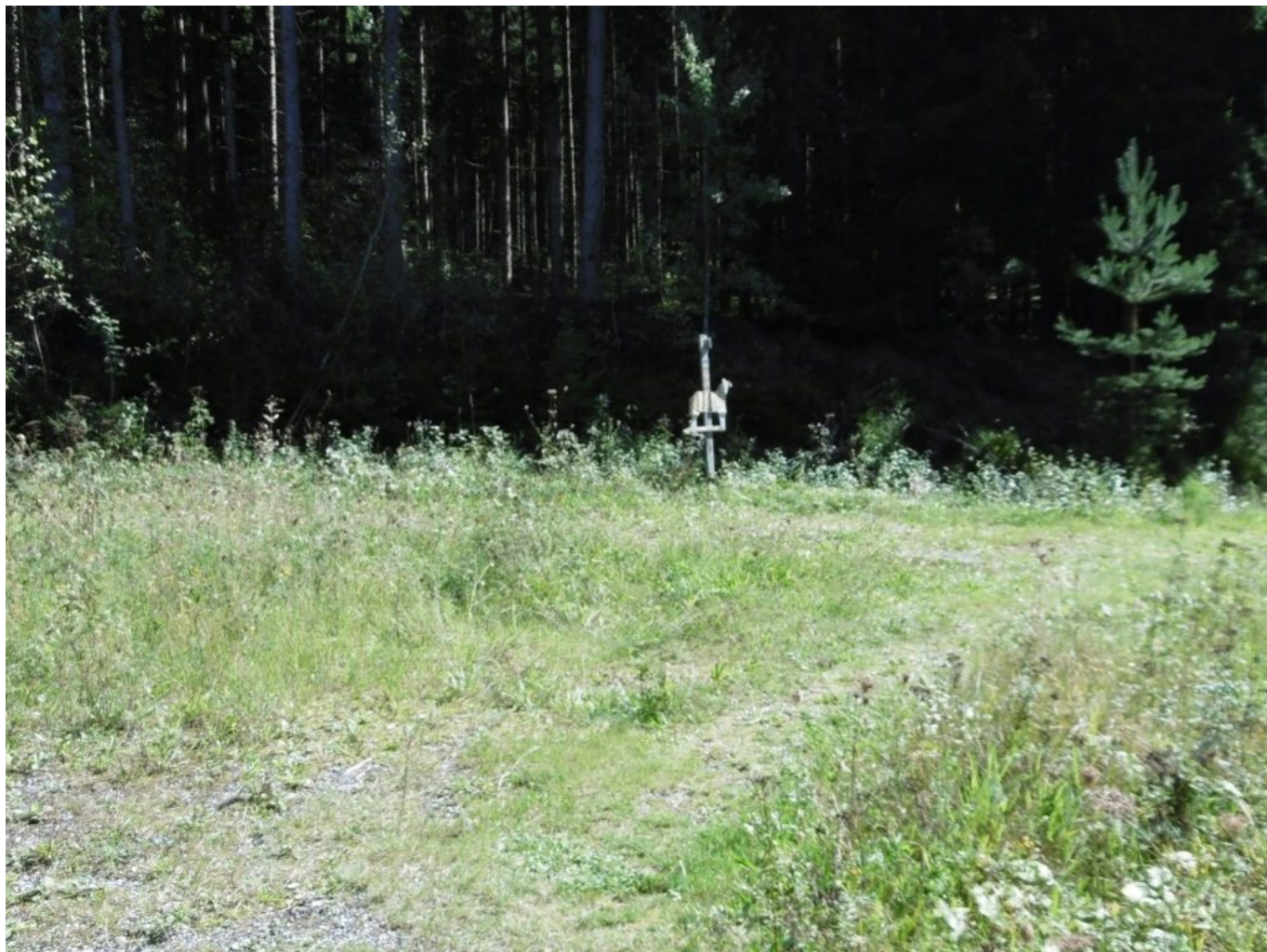
Der süße Schafbock grüßt in der Stille