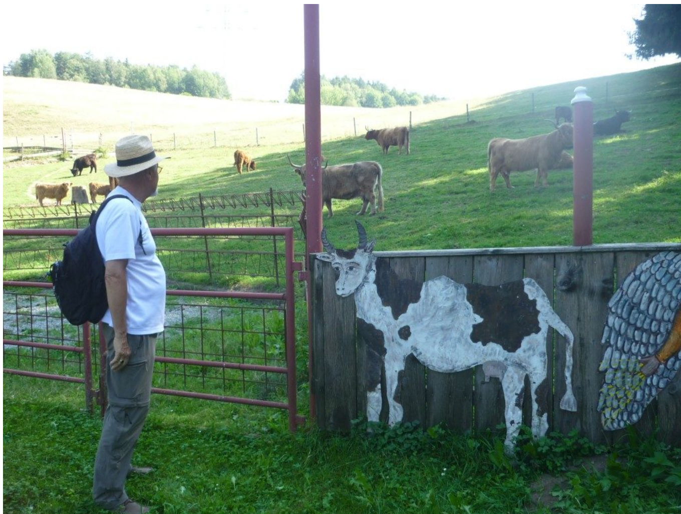
Die Station „Erst die Rinder, dann die Kinder!“