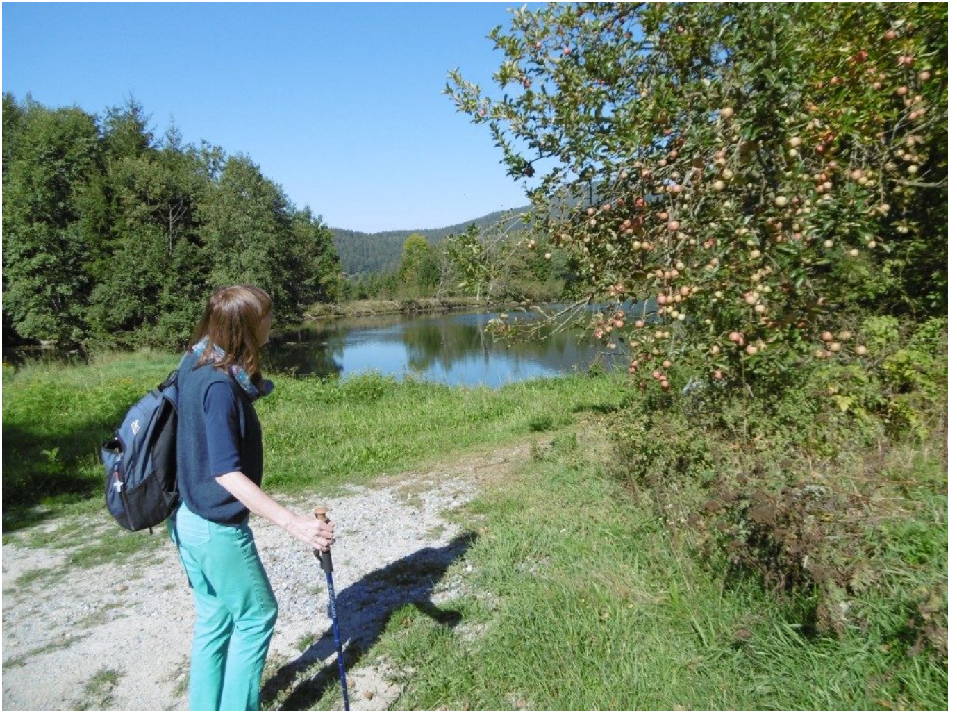
Reich beladener Apfelbaum zur Begrüßung und Wegzehrung