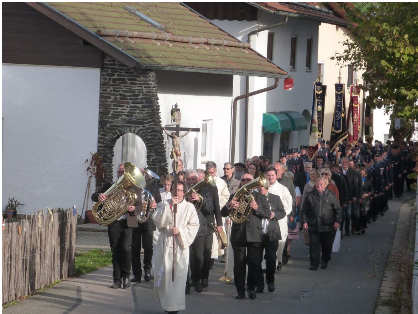
Unter den Marschklängen der Blasmusik formierte sich der Zug ab der Dorfmitte Haibühl.