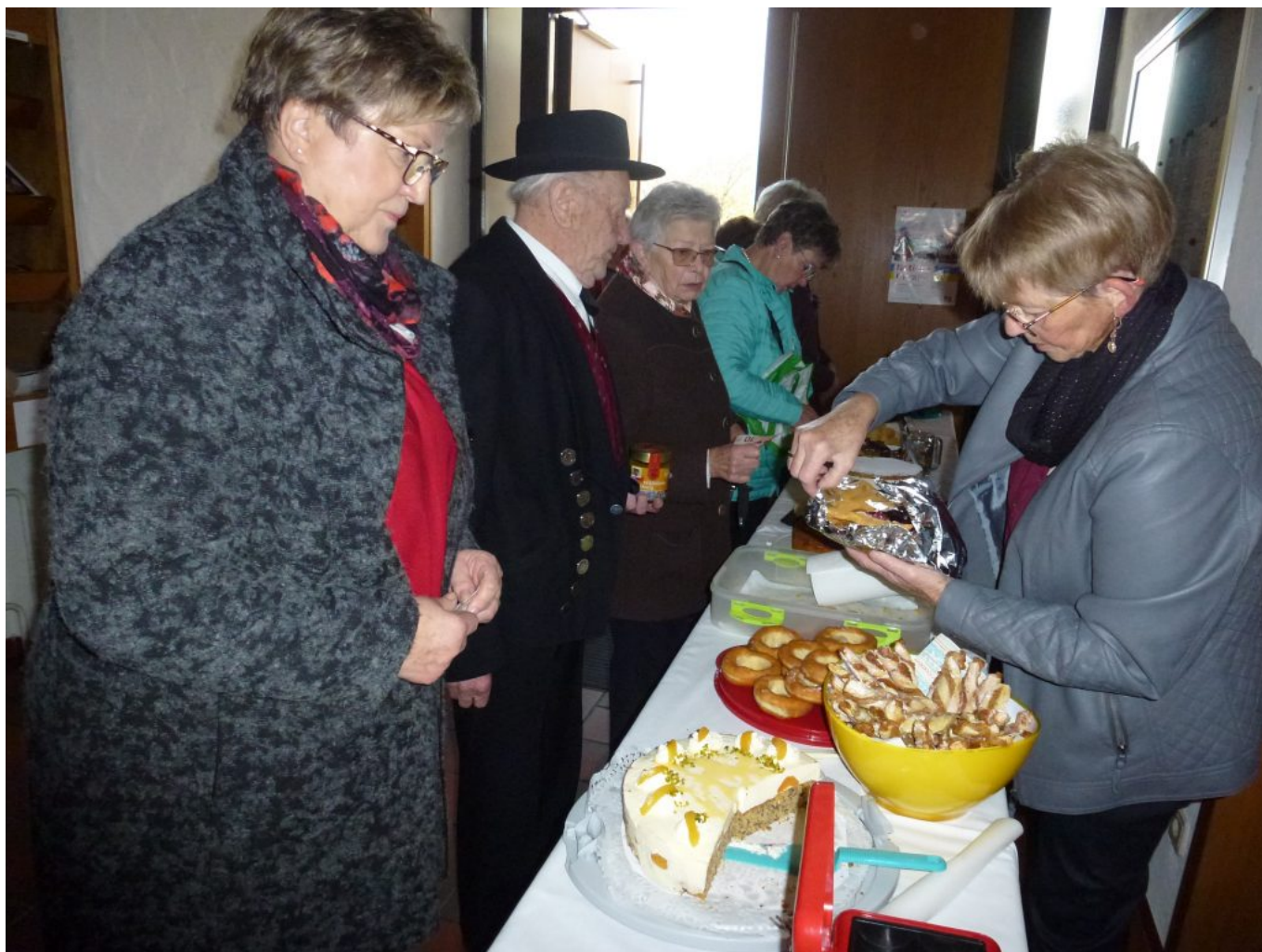
Kuchen und Torten runden die Feier kulinarisch ab