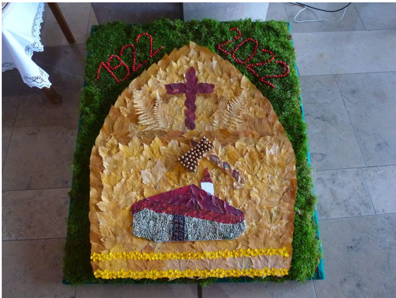
Wunderschöne Bodenteppich aus herbstlichem Naturmaterial (Moos, Blätter, Erika usw.)