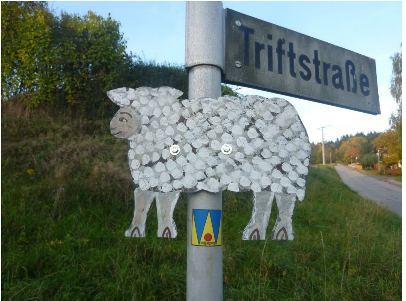
Im neuen Glanz erstrahlt das Schäfchen an der Gabelung Triftstraße-Schwarzhölzweg.