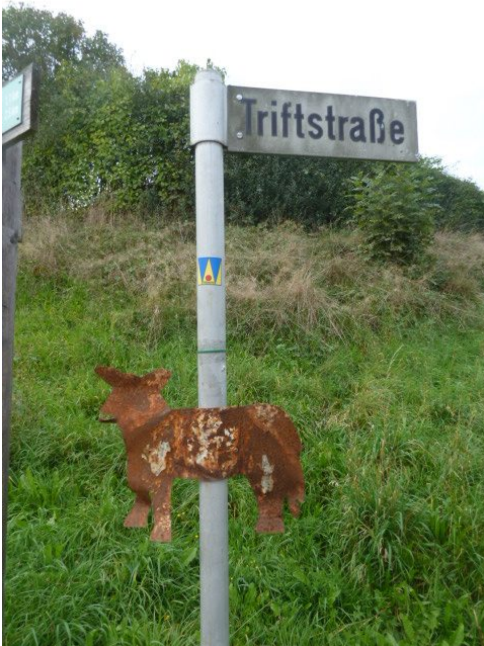
Rostiges Pilgerschäfchen am Wolfgangsweg bei Arrach-Haibühl

Regina Pfeffer ist unter anderem für den Tourismus im Raum Arrach-Haibühl zuständig. Sie ist auch Pilgerführerin und hat schon einige Pilgerwanderungen am Wolfgangsweg in der Region organisiert. Auf ihren Wegen auf den Spuren des heiligen Wolfgang ist ihr ein durch Wind und Wetter sehr verrostetes Schäfchen aufgefallen, welches außer dem „W“ den Wolfgangsweg