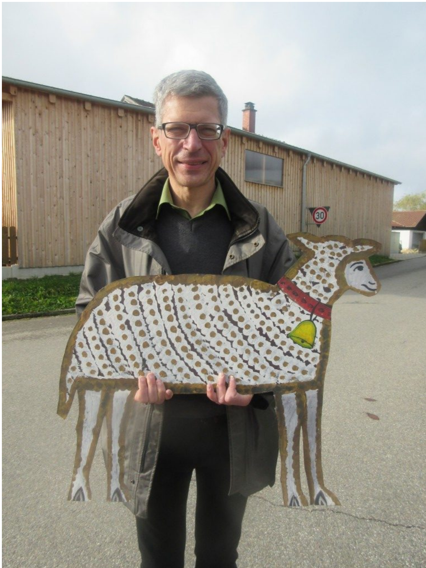
Ein wahrhaft guter Hirte der Gemeinde Haibühl! – Hier mit einem Original-Wolfgangsweg-Blechscaf