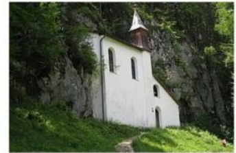
Das Wolfgangskirchlein auf dem Falkenstein