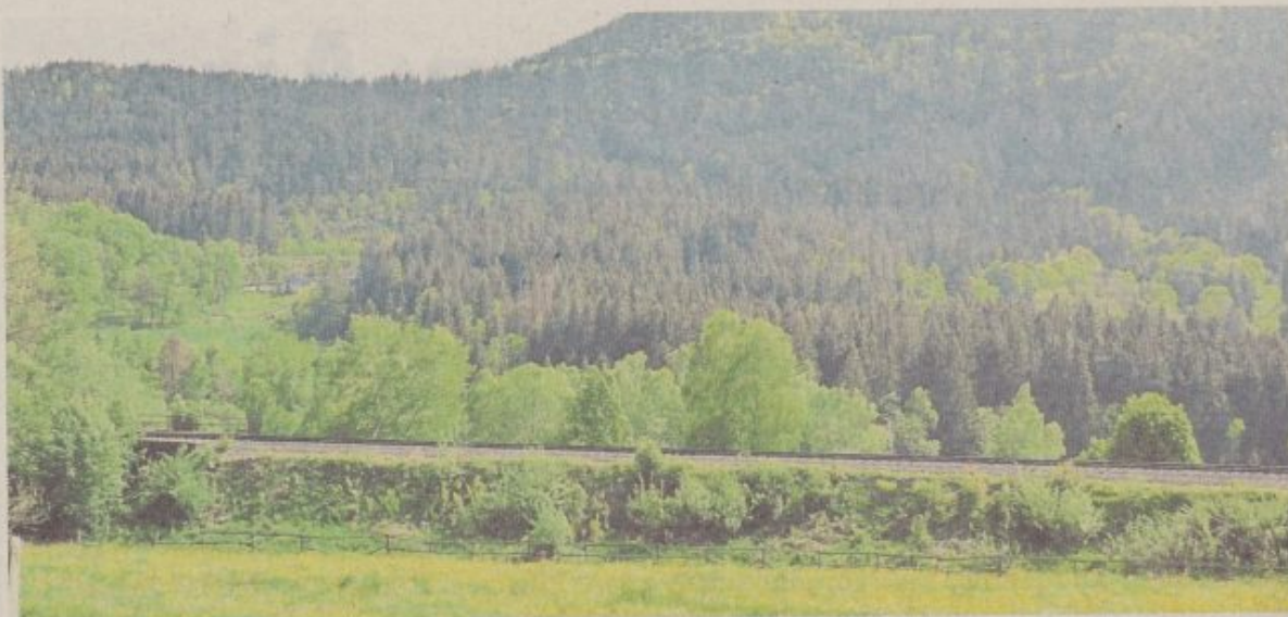
Bahnstrecke im Künischen Gebirge Richtung Spitzbergtunnel.