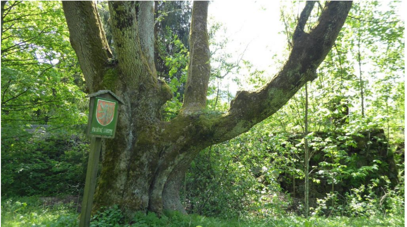
Alte Esche in Böhmen