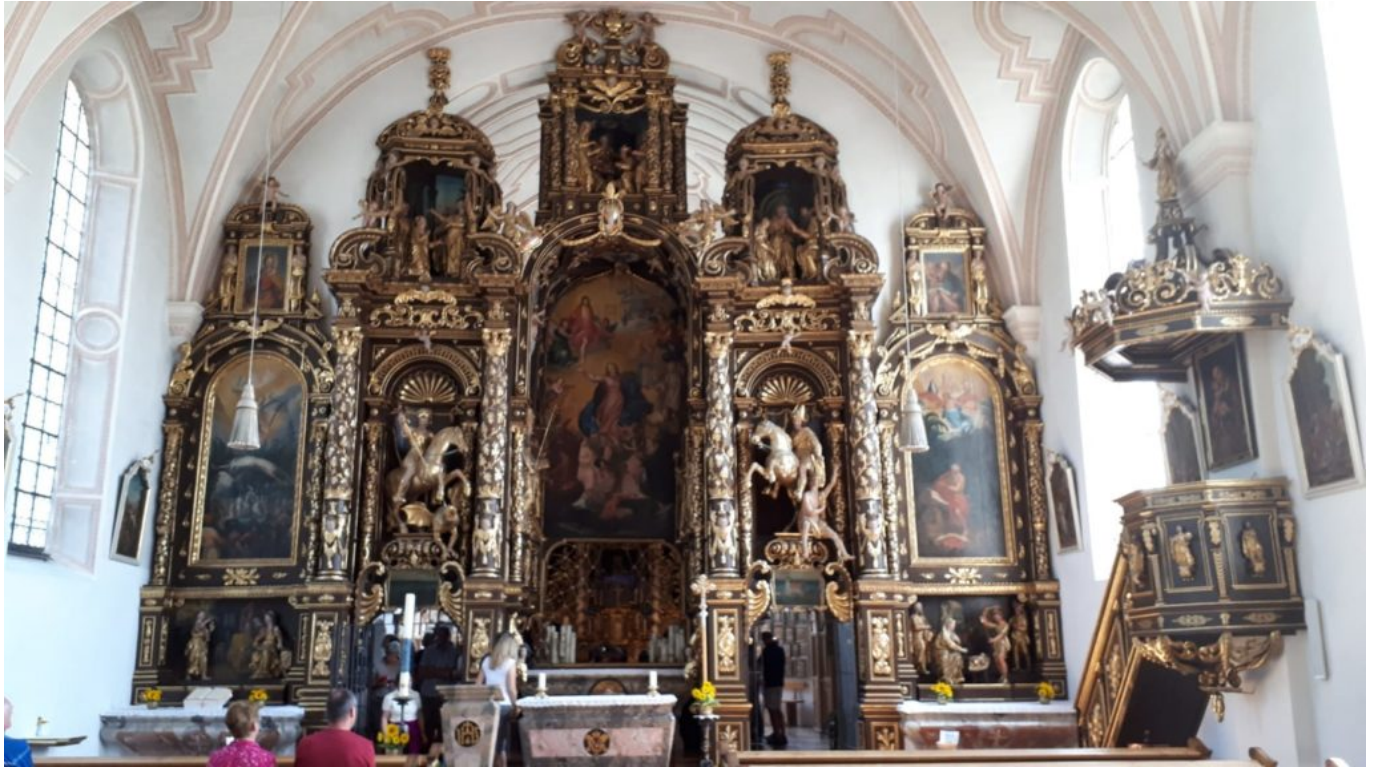
Altar in Samarai

der mir erzählt hat, da ist mir mehrmals die Gänsehaut gelaufen. Nach schwerem Schicksal ein tiefgläubiger Mensch. Schlüssel dazu ist Vergebung aller Mitmenschen und vor allem sich selbst auch.