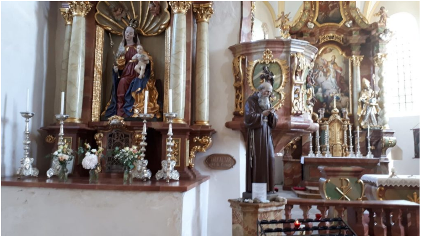
Bildmitte: Bruder Konrad – Altar der Kirche in St.Wolfgang bei Weng

Bruder Konrad. Hier. Der heilige Wolfgang mit Kirchenmodell und Bischofstab.