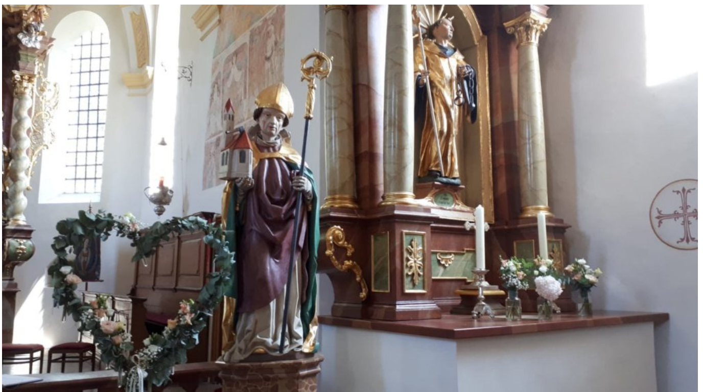
Altar der Kirche in St.Wolfgang bei Weng , der Taufkirche von