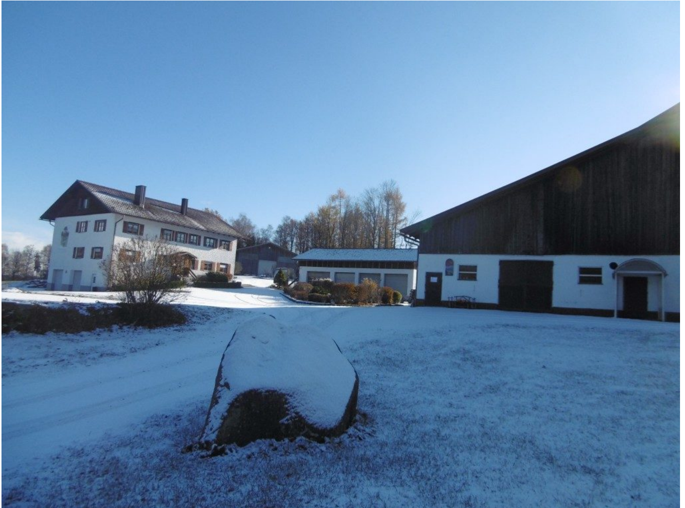
Der Bielmeier Bernhard Hof in Ramersdorf

Dieser Hof im Ramersdorf wird zum ersten mal erwähnt im 11.Jahrhundert.