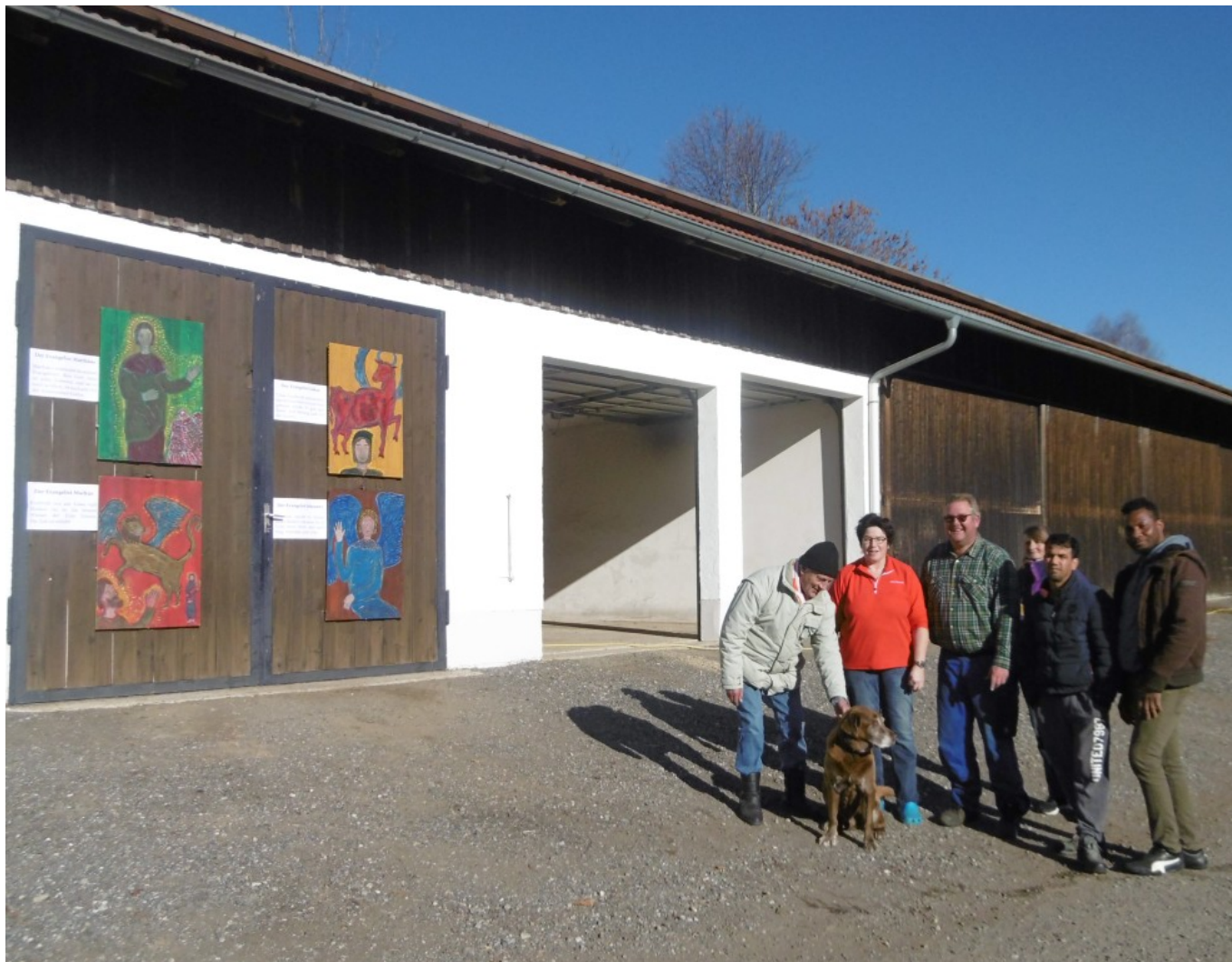
Die vier Evangelisten bei der Berging-Kapelle wurden von Familie Bielmeier selbst angebracht.