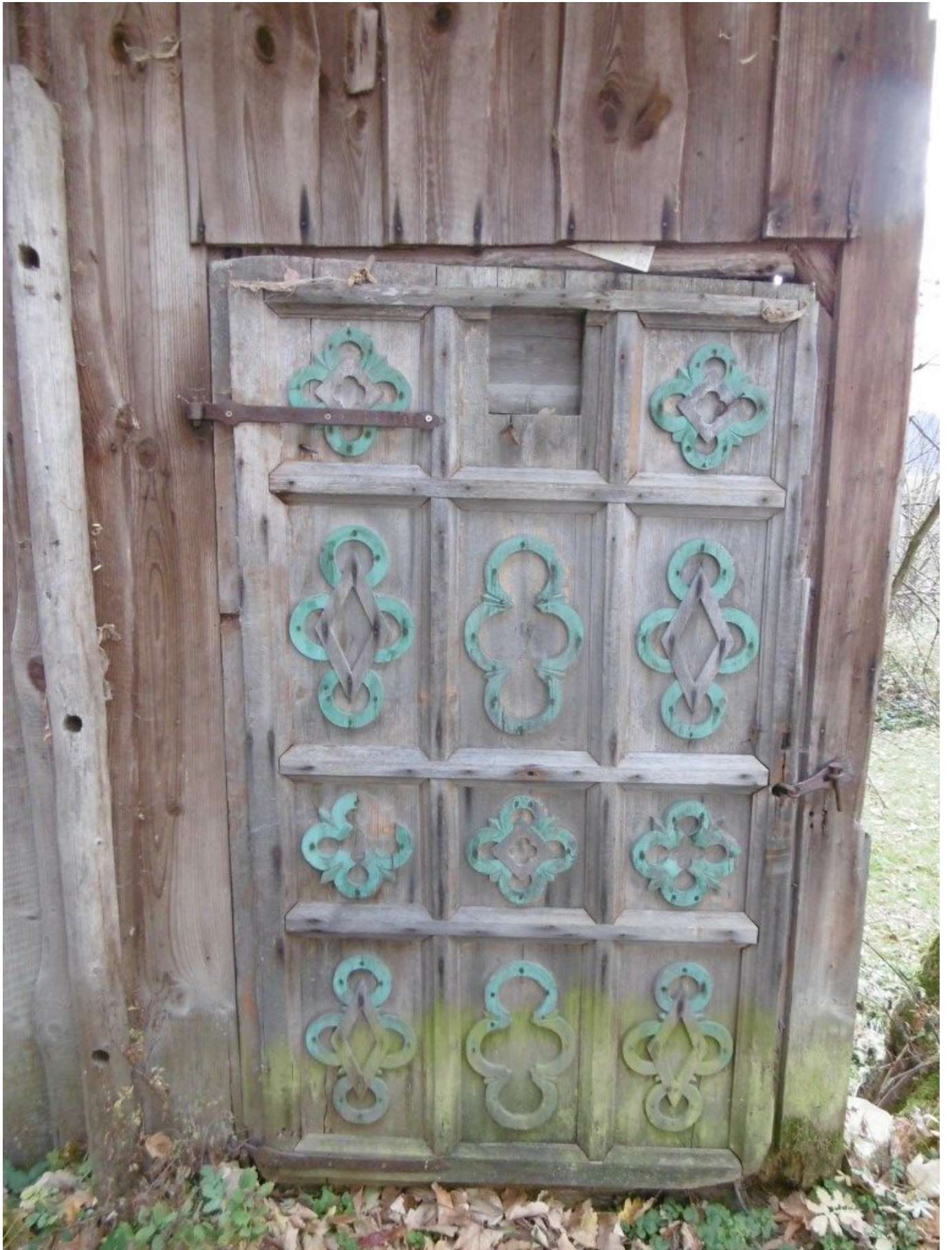
Alte Holztür beim besagten Anwesen in Karglhof