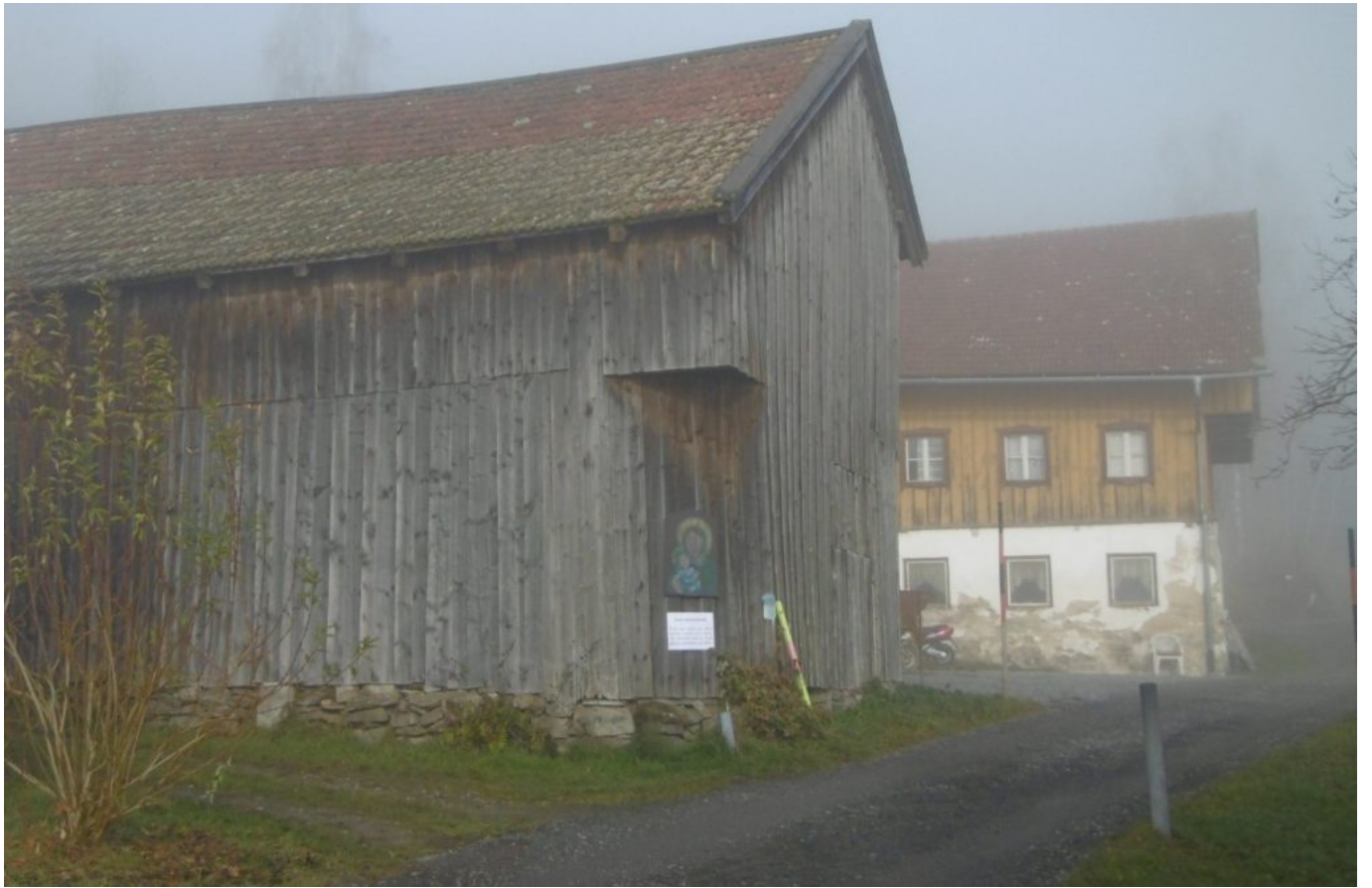
Das Penzkofer -Anwesen in Ramersdorf