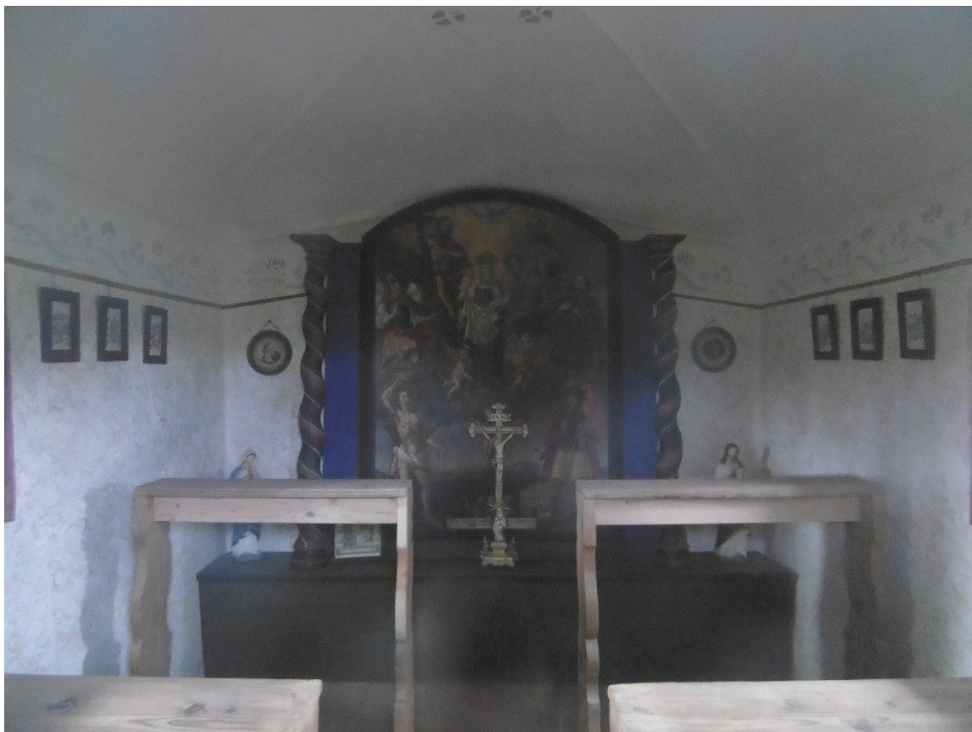
Durchs Fensterchen gesehen...