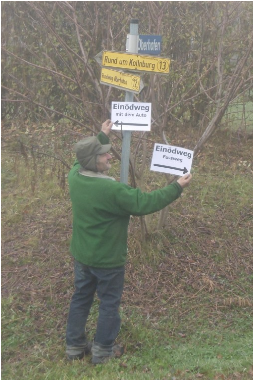
Die Auswahl zwischen Auto und Fuß ist gut neben der Straße nach Rechertsried erkennbar