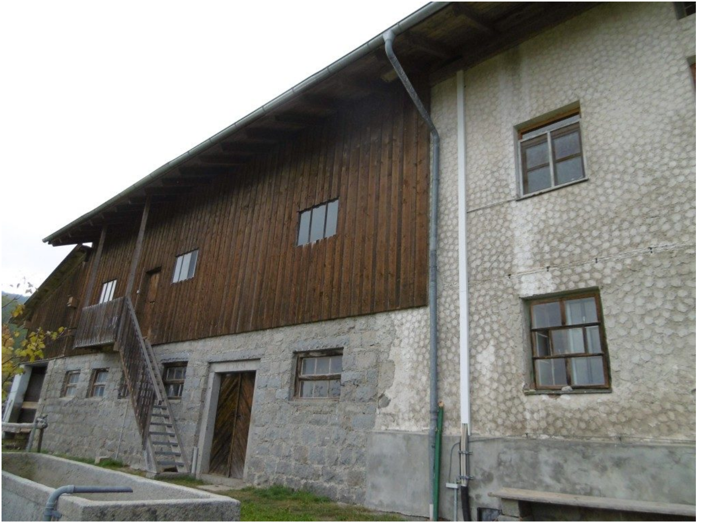
Der Waldhof am Baierweg

“Advent auf der Einöde” – ein Rundweg wird anvisiert: Der Erdlingshof