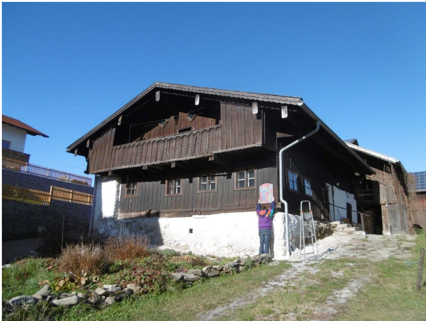
Das denkmalgeschützte Edenhofer-Anwesen in Rechertsried