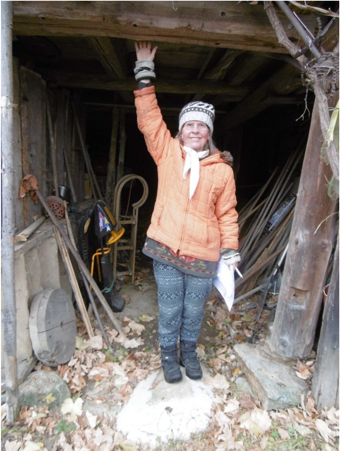
Alter baufälliger Schuppen

Auf ihrer Projektforschungstour "Advent auf der Einöde" machen