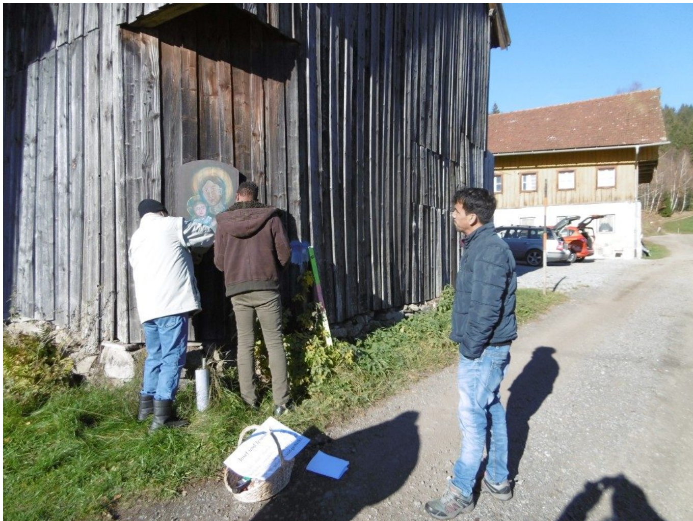
Beim Penzkofer-Anwesen am Wolfgangsweg bei Ramersdorf