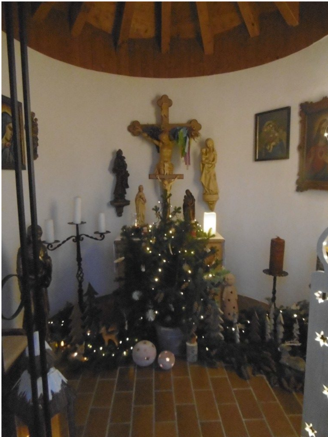
Das Innere der Berging Kapelle ist adventlich geschmückt. Am vergangenem Dienstag, den 27.November, fand auf der