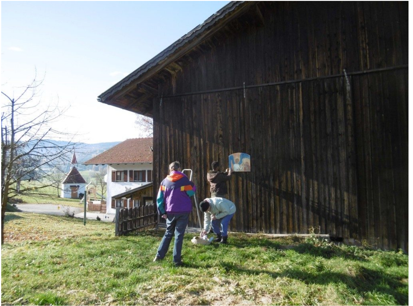
Lobmeier/Bielmeier-Anwesen mit Kapelle