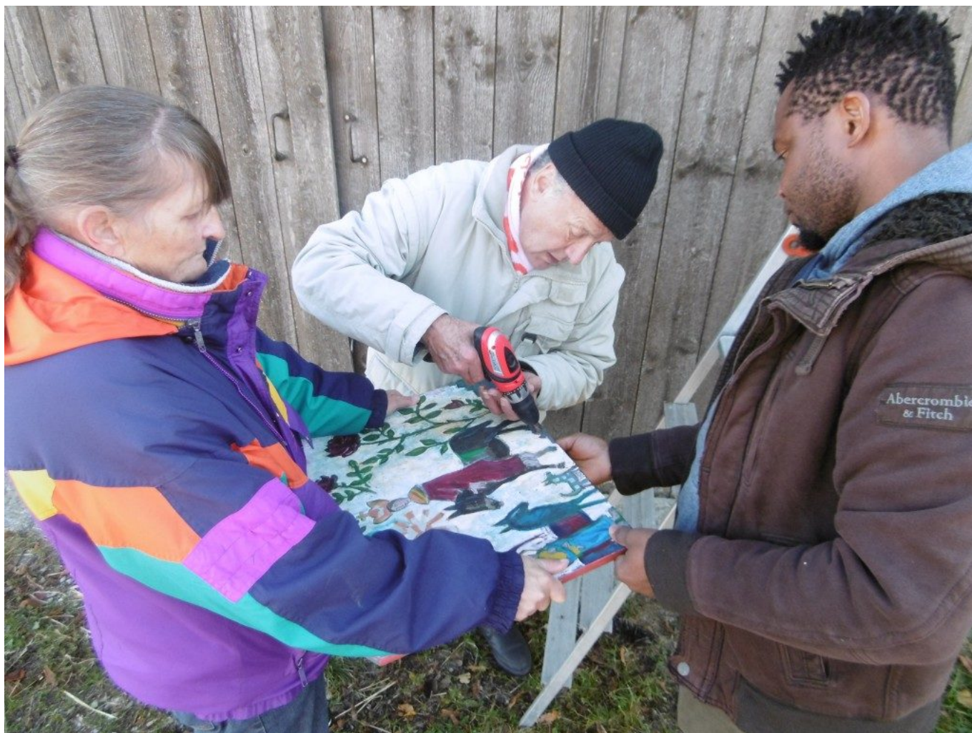
Konzentration beim Aufbau. Hier beim "Langerbauer" in Stein.