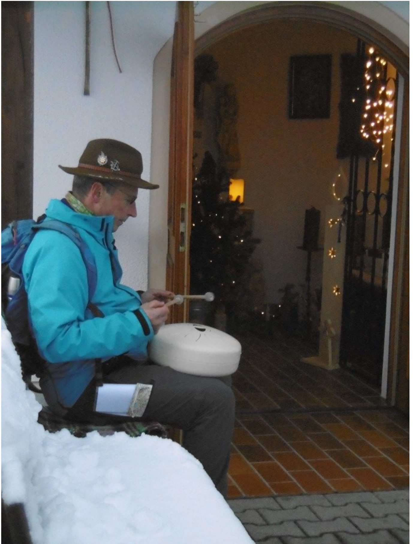
Zwischen den Fürbitten ertönen die sanften Klänge aus Pilger Rudis Klangauge.