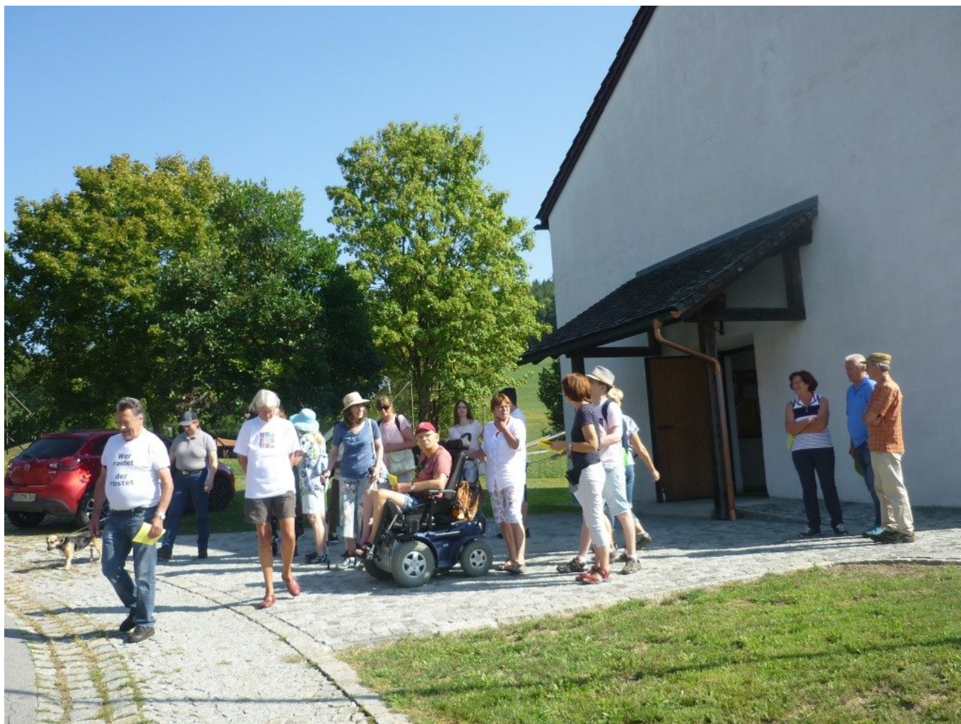
Start: die Fernsdorfer Dorfkirche