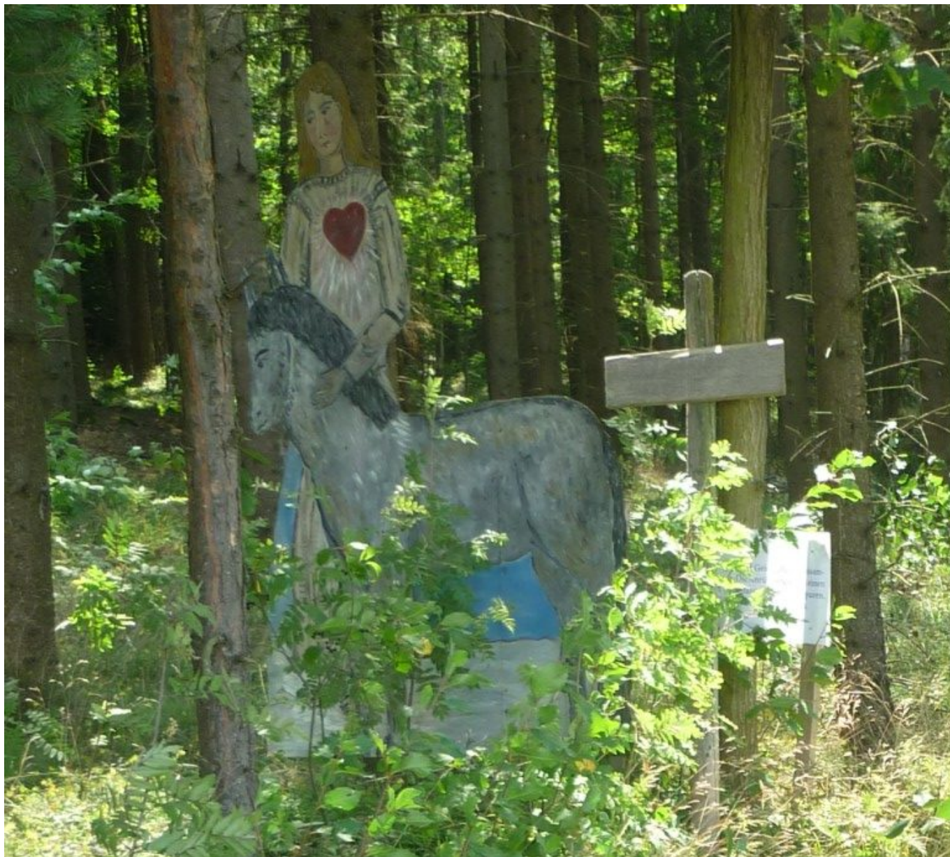
Der Herzens-Engel am Engelweg Das Interview haben wir dem Tourist Guide entnommen.