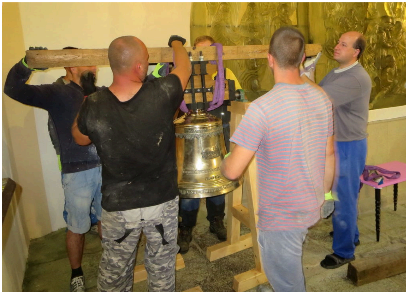
Glockeninstallation in Gutwasser

Kurznachricht für alle Gunther- und Wolfgangspilger und -Fans betreffend Dobra Voda/Tschechien: